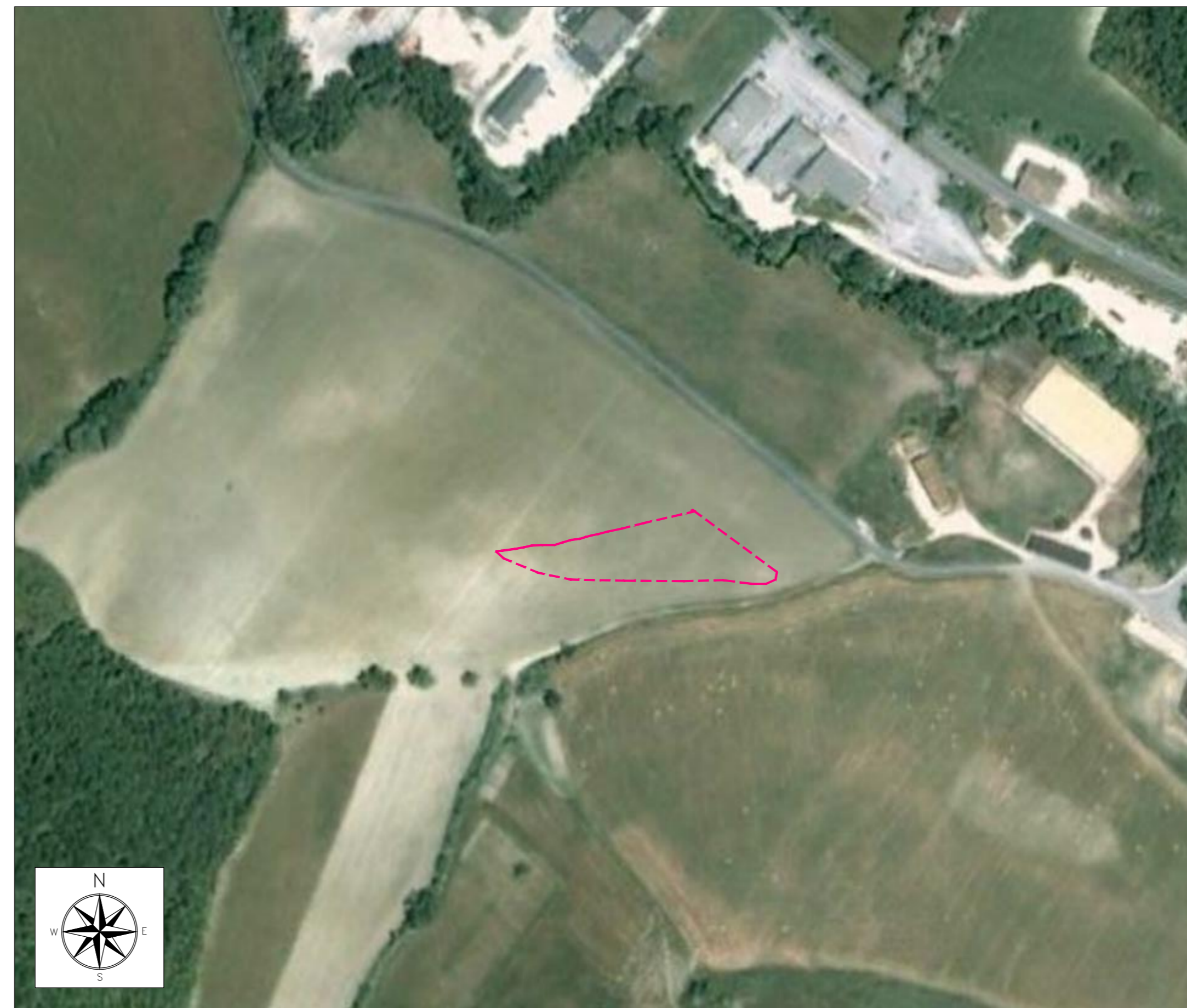
ORTOFOTO DI INQUADRAMENTO - SCALA 1:2000