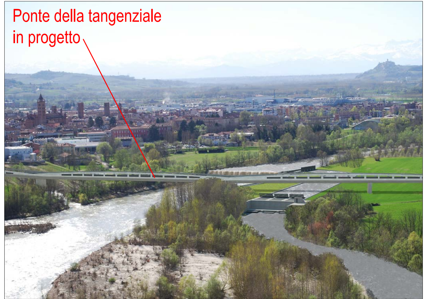
Ponte della tangenziale in progetto