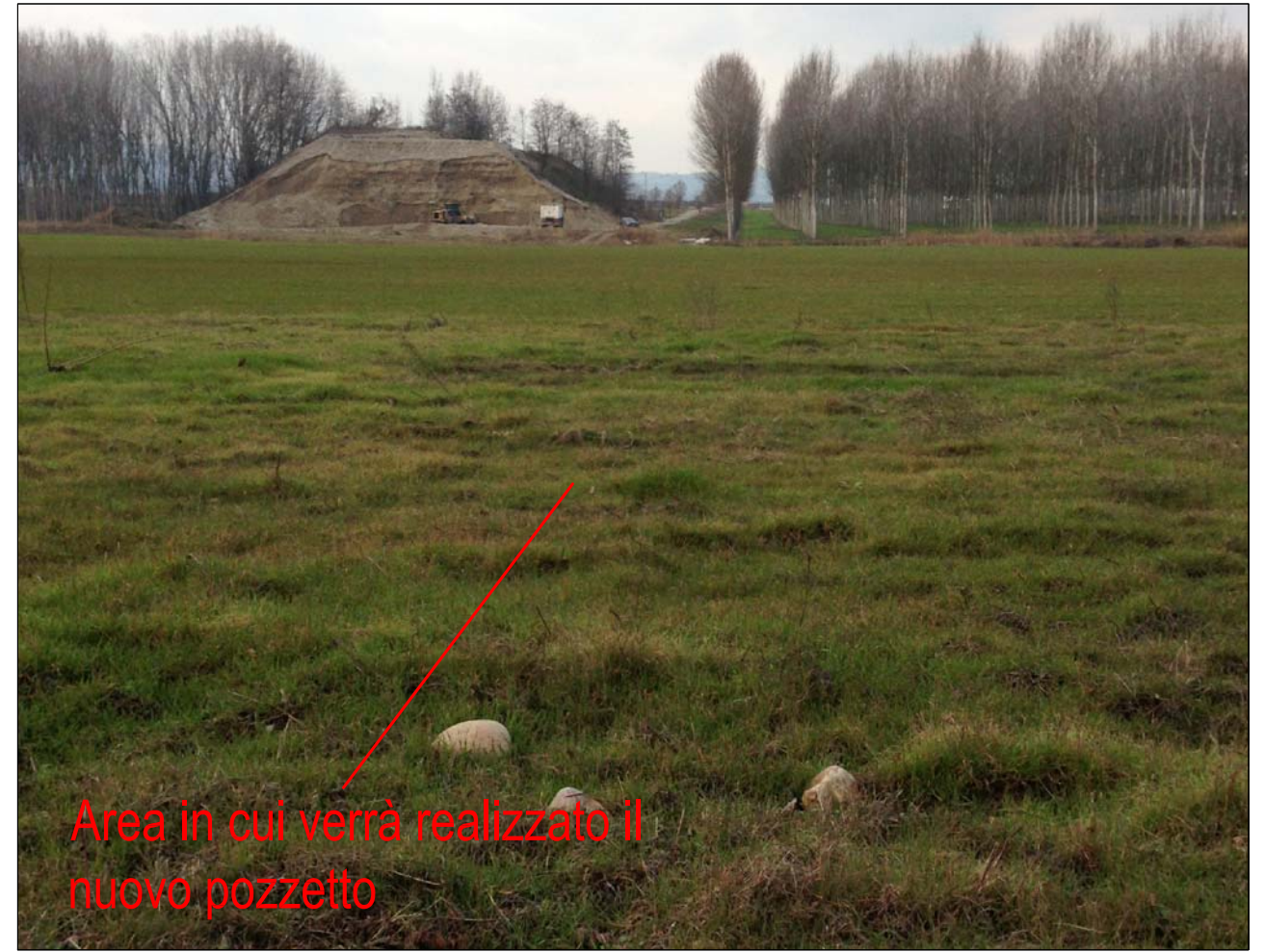
Area in cui verrà realizzato il nuovo pozzetto