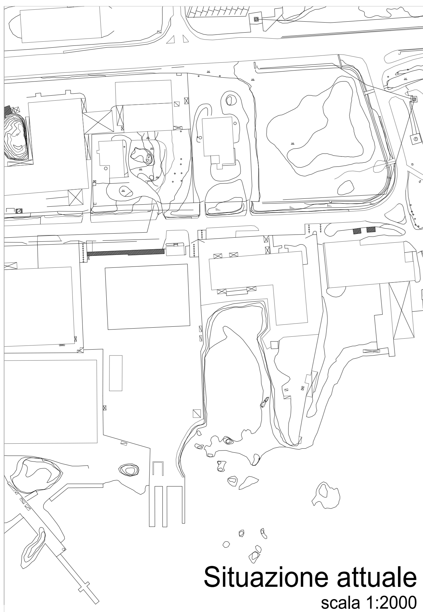
Situazione attuale scala 1:2000

REGIONE AUTONOMA DELLA SARDEGNA COMUNE DI OLBIA