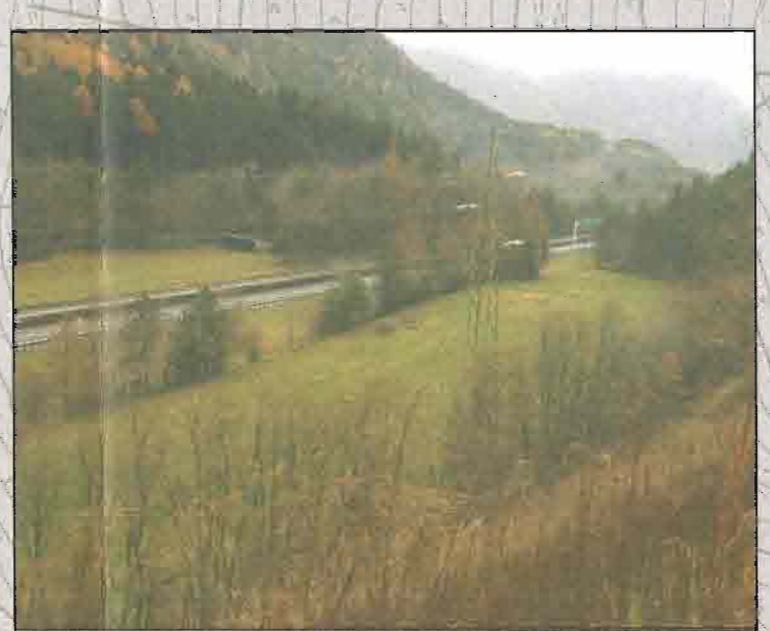
FOTO 3 - VISTA DELL'AREA DESTINATA AI CANTIERI OPERATIVI C.O.02A E C.O.02B