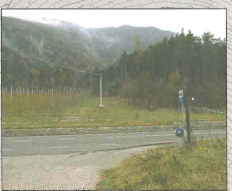
FOTO 4 - VISTA DELL'AREA DESTINATA AL CANTIERE BASE C.B.01 (ZONA NORD)