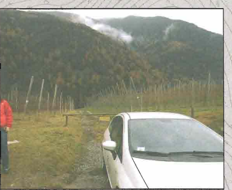
FOTO 5 - VISTA INGRESSO AREA TECNICA A.T.02A