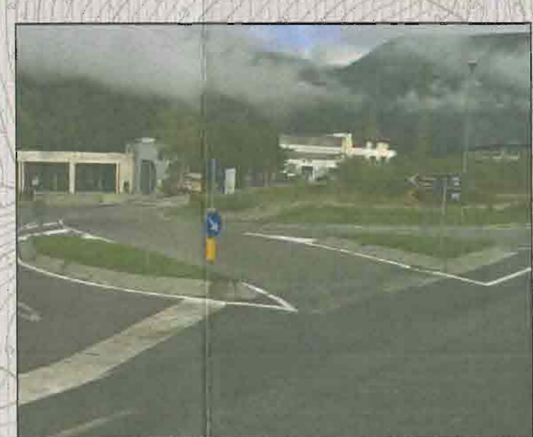
FOTO 1 - VISTA STRADA DI ACCESSO AI CANTIERI OPERATIVI