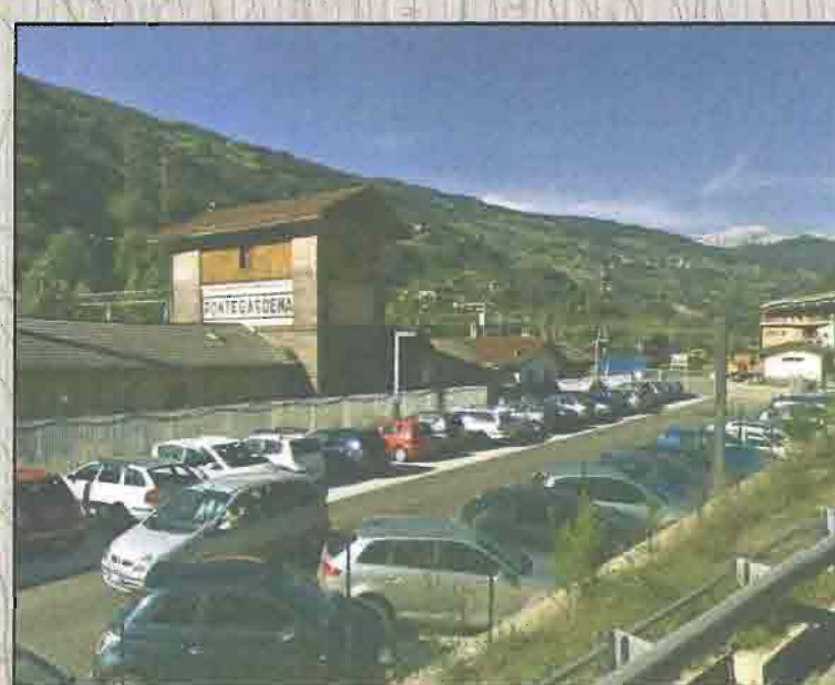
FOTO 1 - VISTA DELL'AREA DESTINATA AL CANTIERE OPERATIVO CB.05