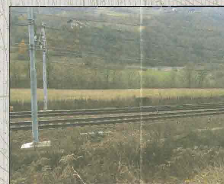
FOTO 2 - VISTA DELL'AREA DESTINATA AL CANTIERE OPERATIVO CO.06A