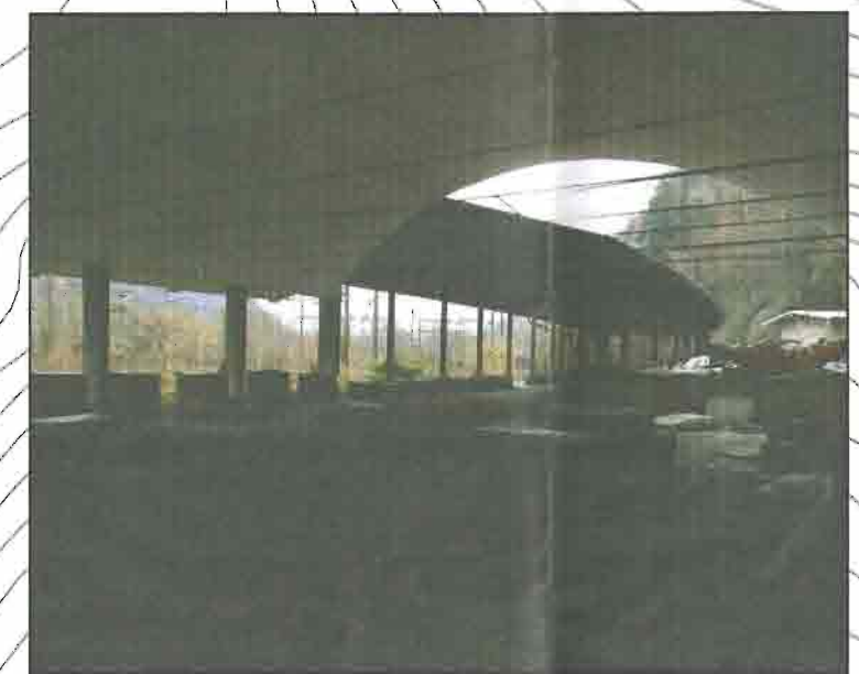
FOTO 2 - VISTA CANTIERE OPERATIVO C.O.01A - DEPOSITO ESISTENTE DA DEMOLIRE