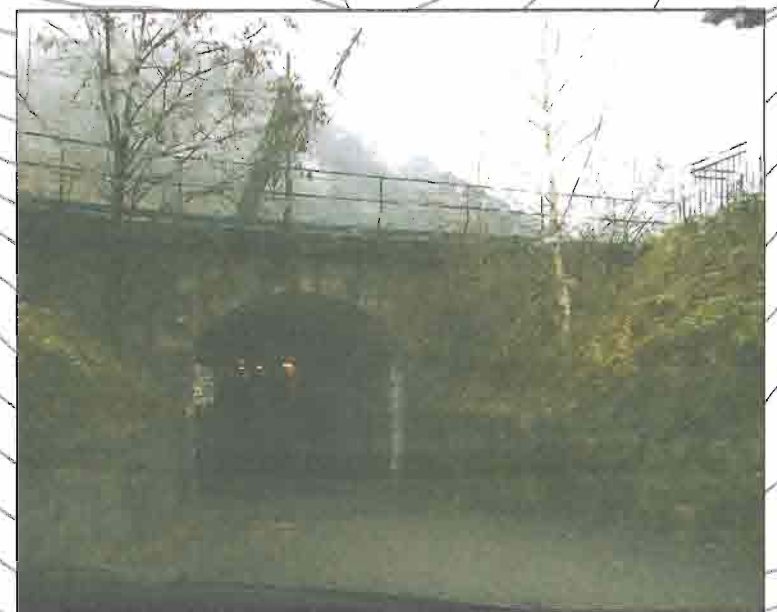
FOTO 3 - SOTTOVIA ESISTENTE