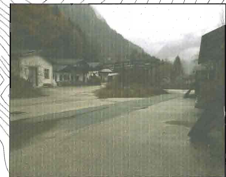
FOTO 1 - VISTA CANTIERE OPERATIVO C.O.01A - TETTOIA ESISTENTE DA DEMOLIRE