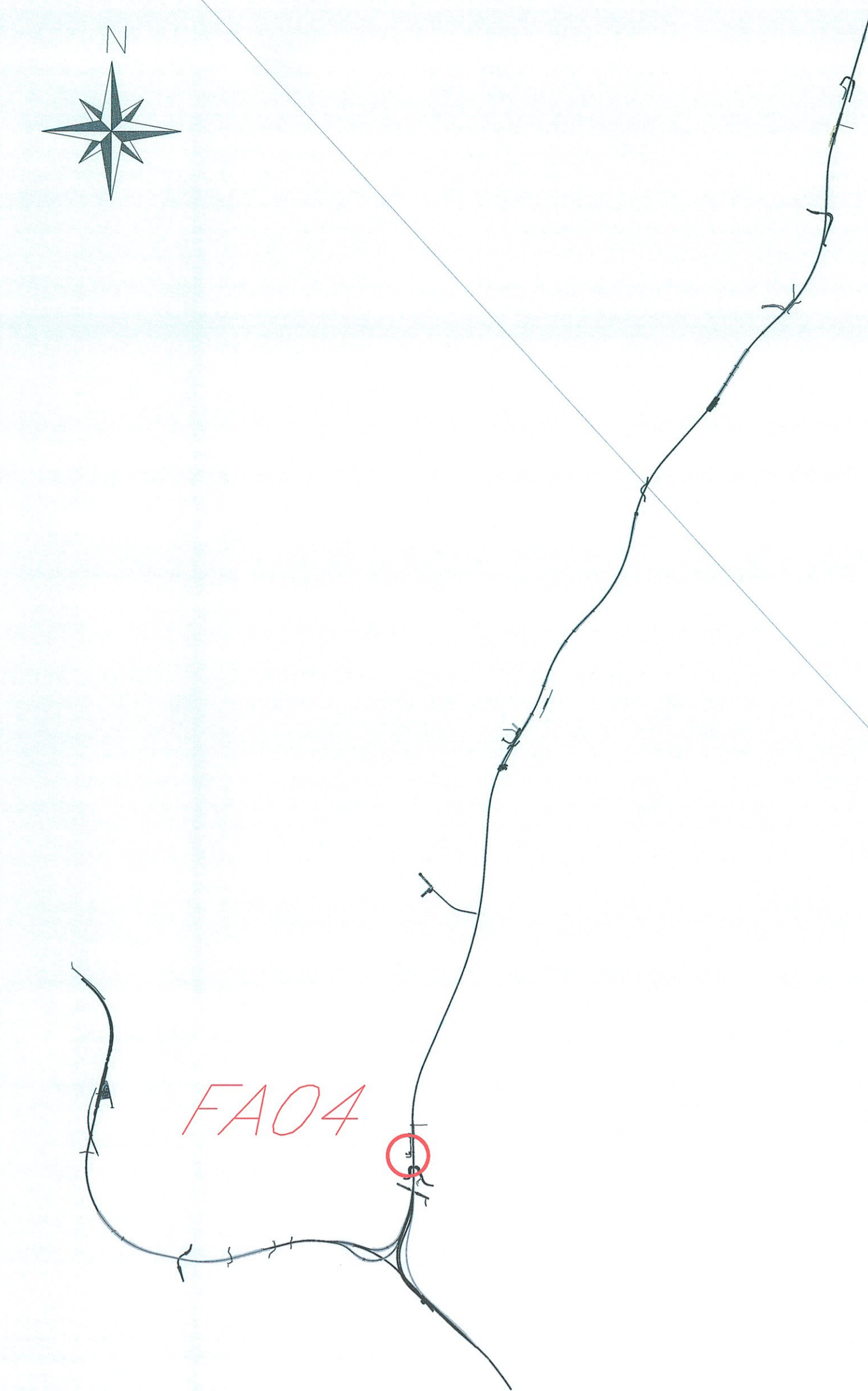
PIANTA PIAZZALE CON FABBRICATO FA04 scala 1:100

NOTA: Il riporto degli scavi andrà eseguito con terre provenienti dagli scavi o da cave di prestito secondo le indicazioni del Capitolato di Costruzione delle opere civili