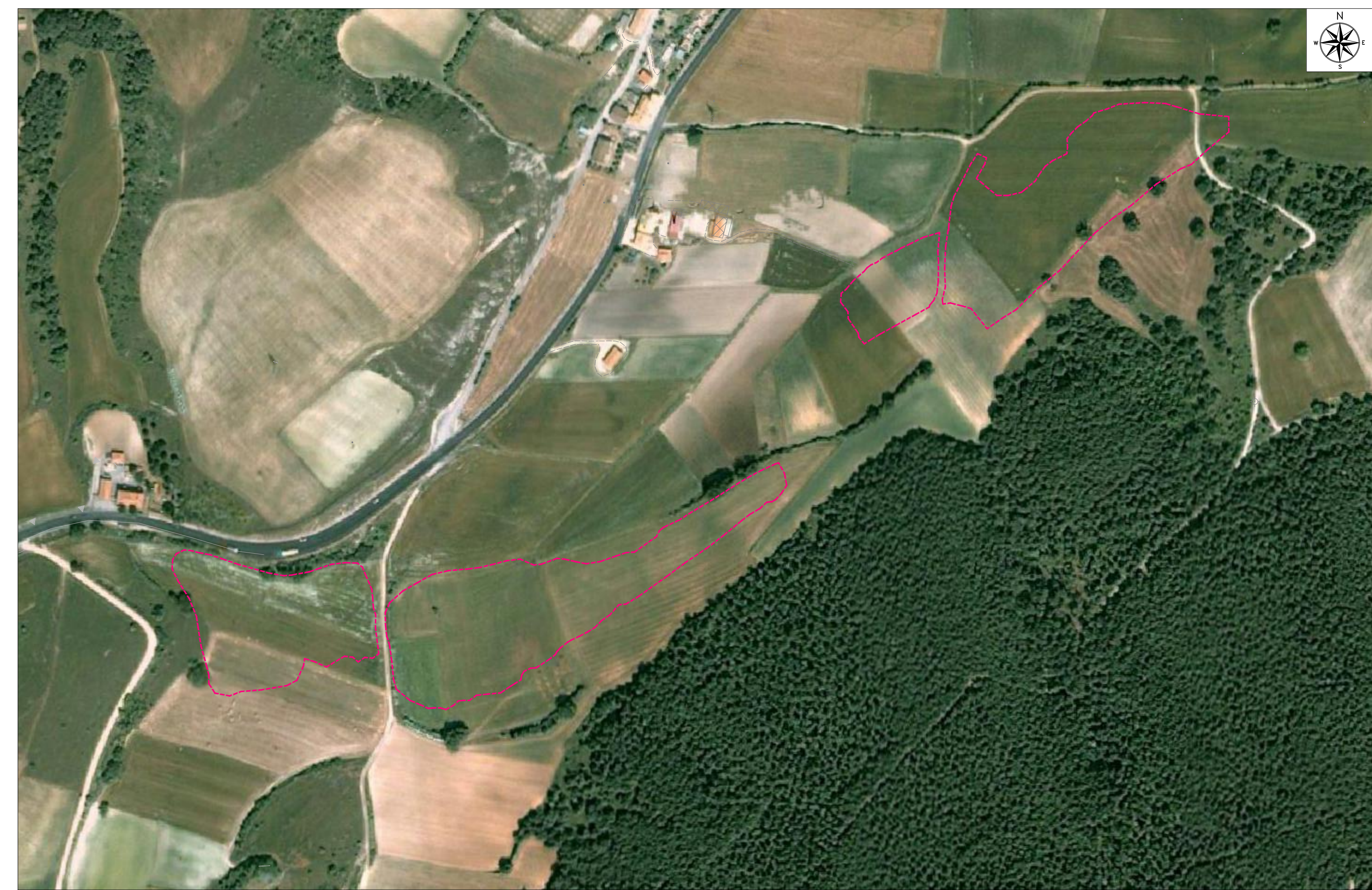
ORTOFOTO DI INQUADRAMENTO - SCALA 1:2000