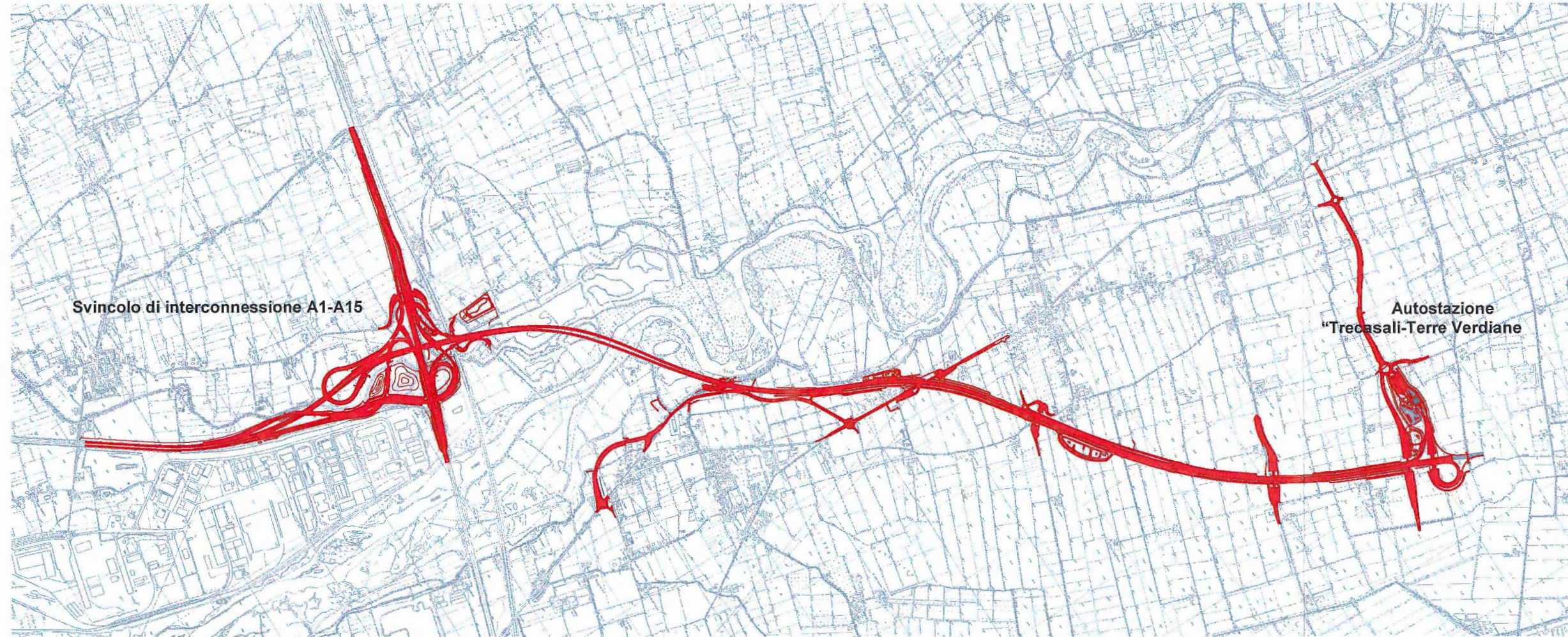
COROGRAFIA DEL TRACCIATO DEL PROGETTO ESECUTIVO DELLO SVINCOLO INFRASTRUTTURALE DI COLLEGAMENTO A15/A22 SU CARTA TECNICA REGIONALE