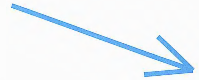
DATI TRACCIAMENTO RILEVATO ARGINALE