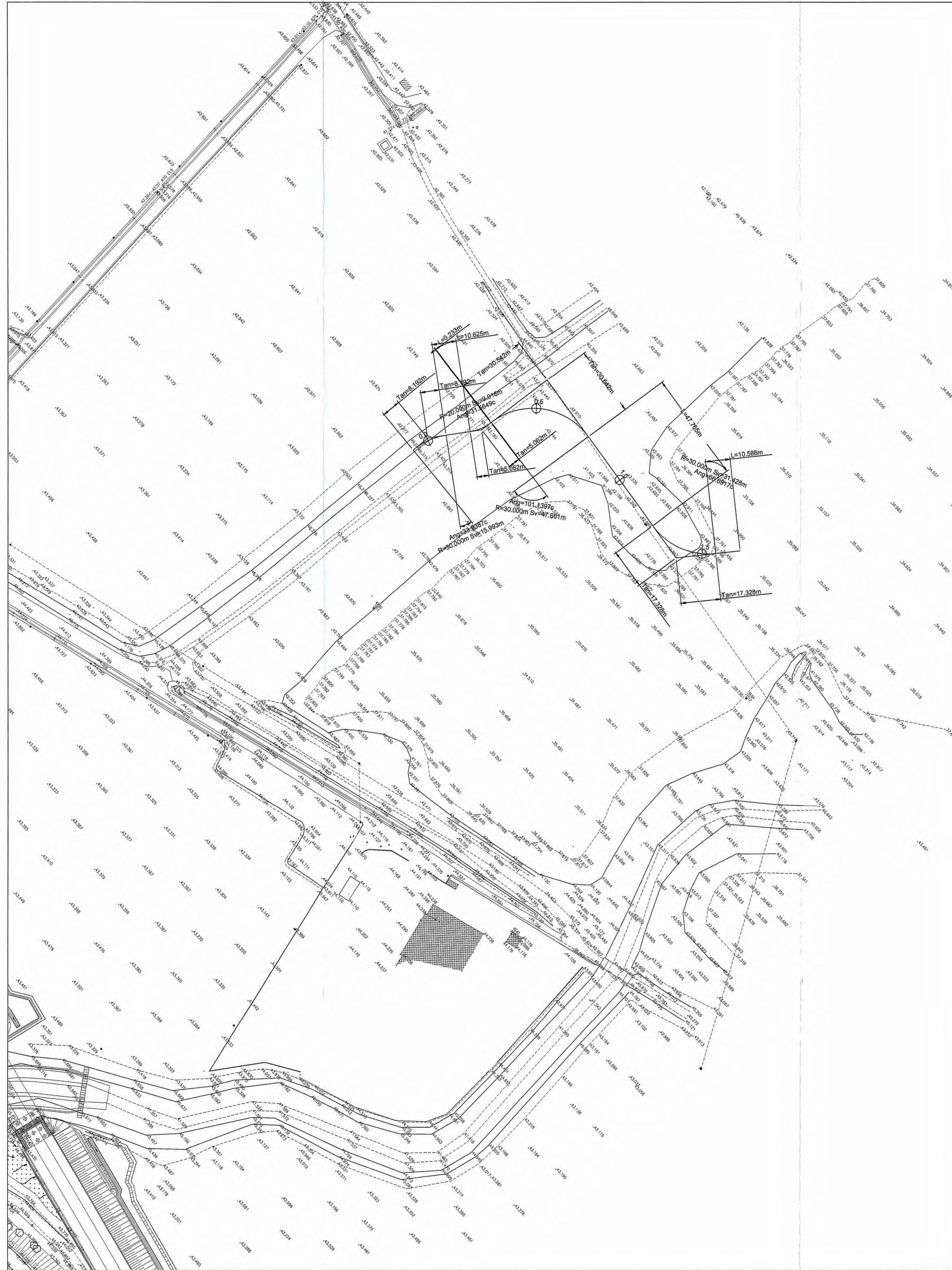
1 Planimetria di tracciamento - asse pista 2 - 1:1000