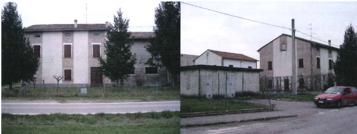
Figura 3.1.1: Ricettore RRUM0708A

L'edificio in questione è rappresentato graficamente nella successiva Fig. 3.1.1.