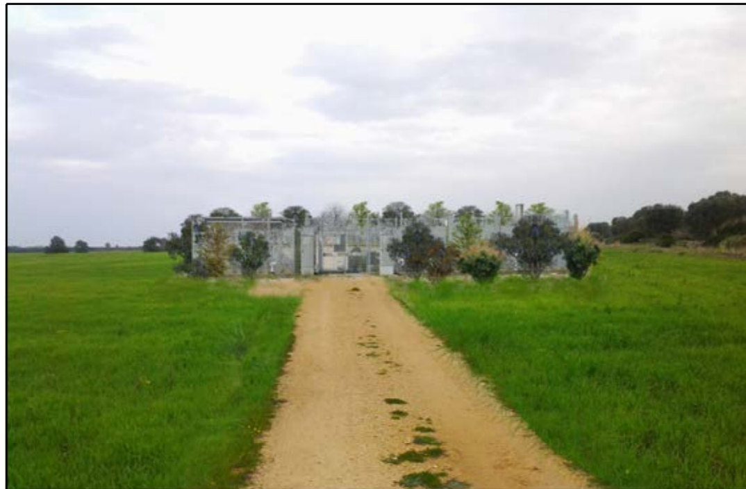
VISTA 3: STATO DI PROGETTO CON MASCHERAMENTO