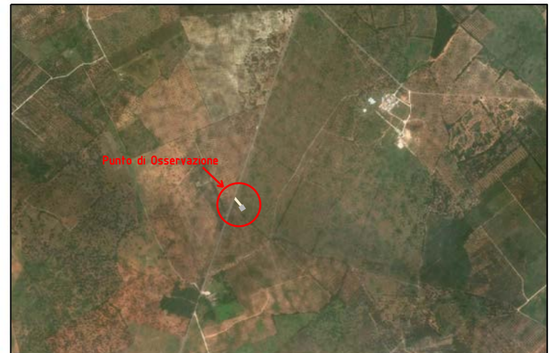
VISTA 4: FOTO AEREA CON EVIDENZIATA L'AREA DI INTERVENTO

Il presente disegno e' di proprieta' aziendale - La Societa' tutelera' i propri diritti a termine di legge.