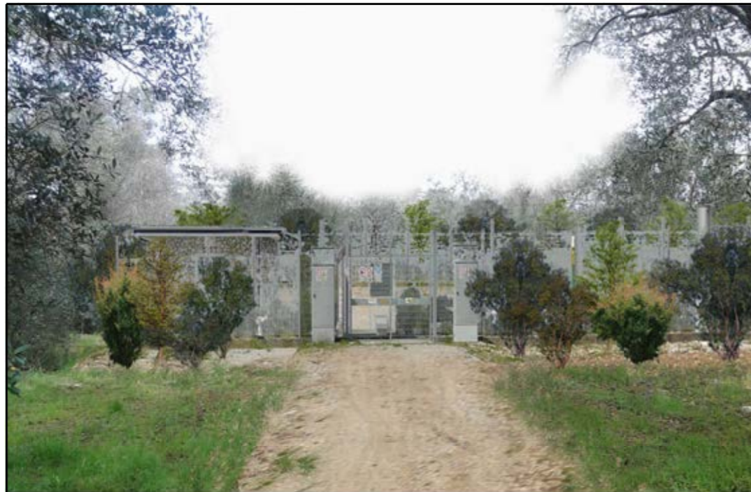
VISTA 3: STATO DI PROGETTO CON MASCHERAMENTO