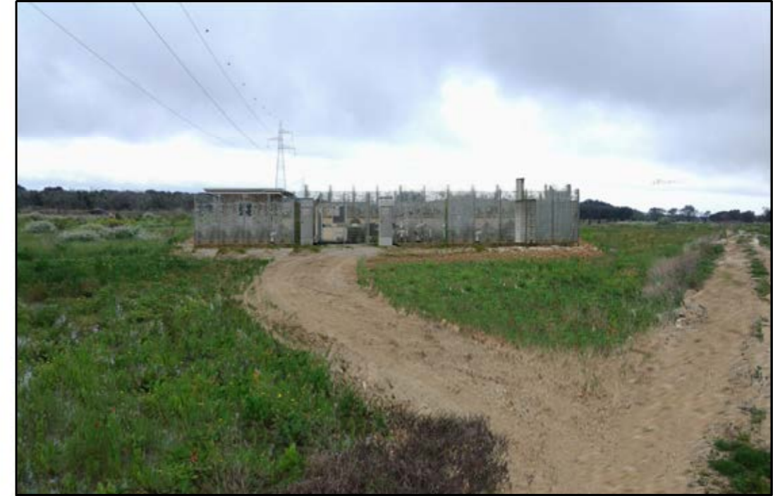
VISTA 2: STATO DI PROGETTO