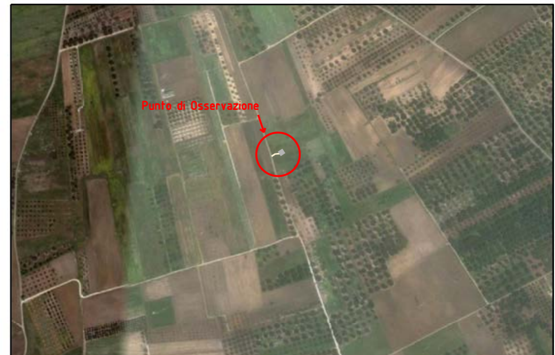
VISTA 4: FOTO AEREA CON EVIDENZIATA L'AREA DI INTERVENTO