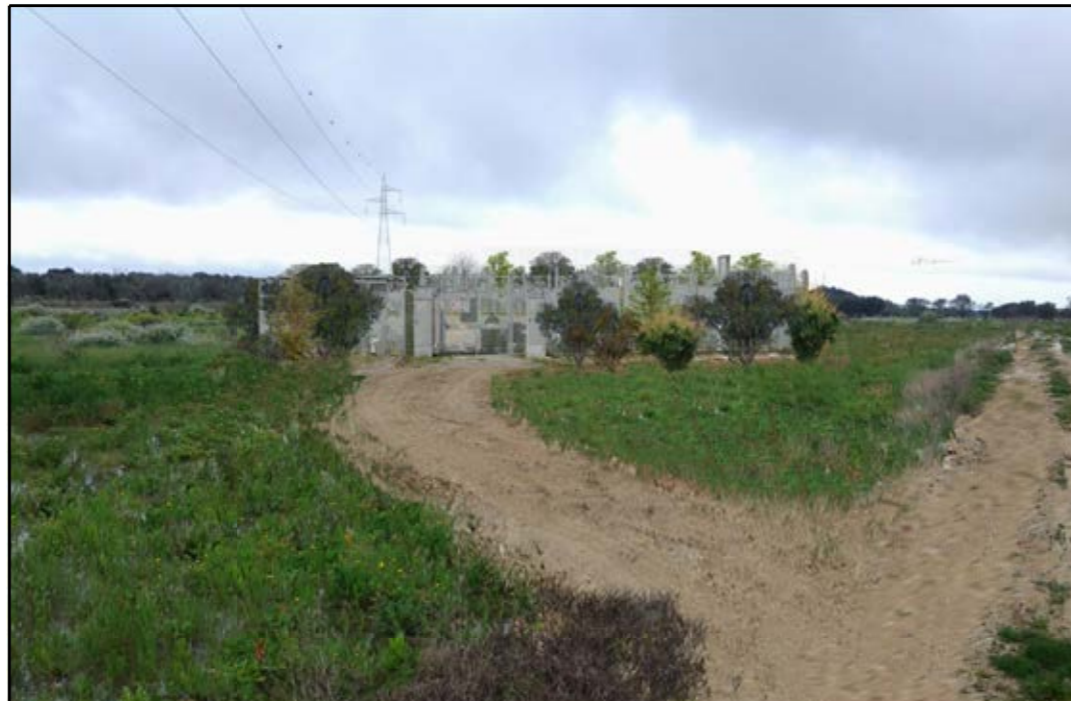
VISTA 3: STATO DI PROGETTO CON MASCHERAMENTO