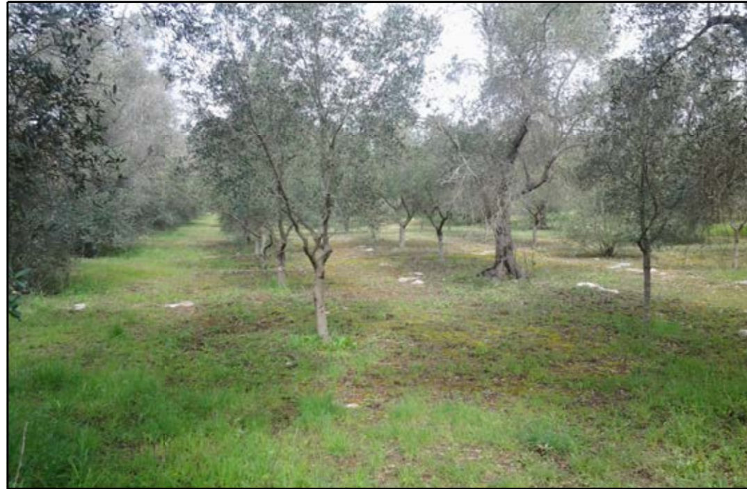
VISTA 1: STATO DI FATTO