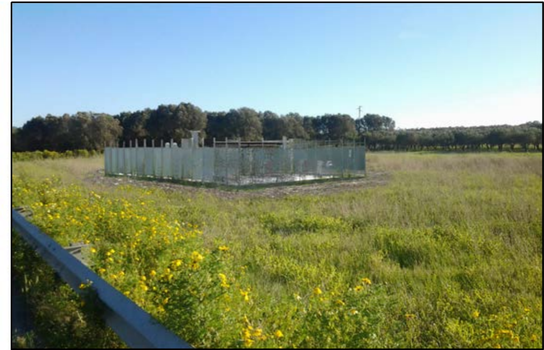
VISTA 2: STATO DI PROGETTO