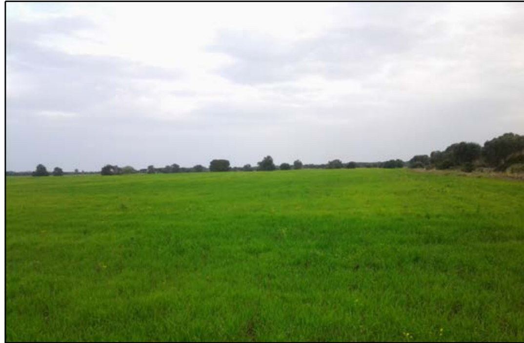
VISTA 1: STATO DI FATTO