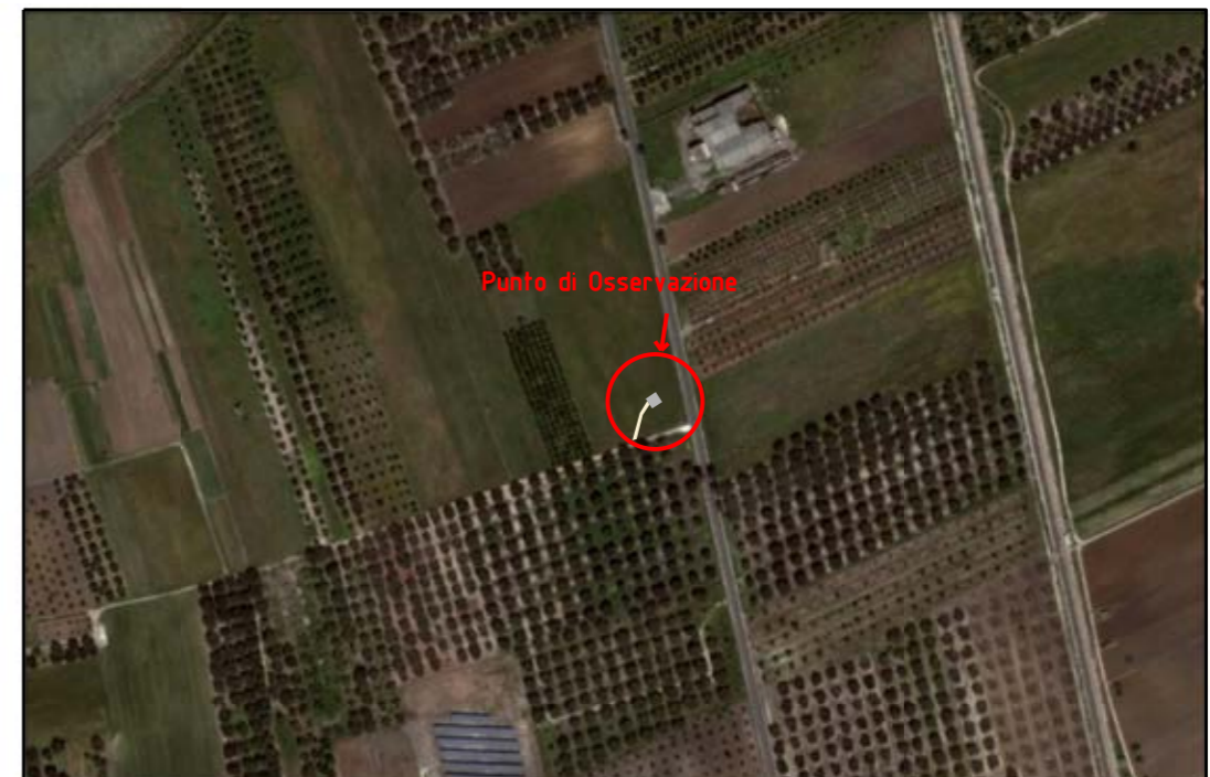
VISTA 4: FOTO AEREA CON EVIDENZIATA L'AREA DI INTERVENTO

Il presente disegno e' di proprieta' aziendale - La Societa' tutelera' i propri diritti a termine di legge.