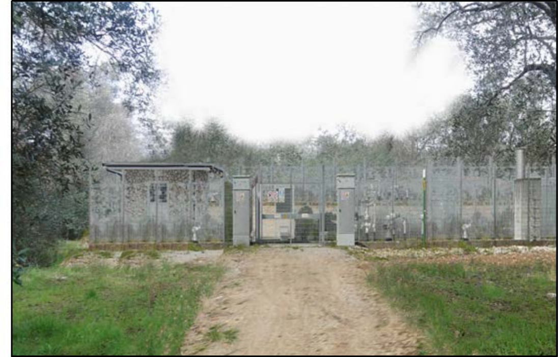
VISTA 2: STATO DI PROGETTO