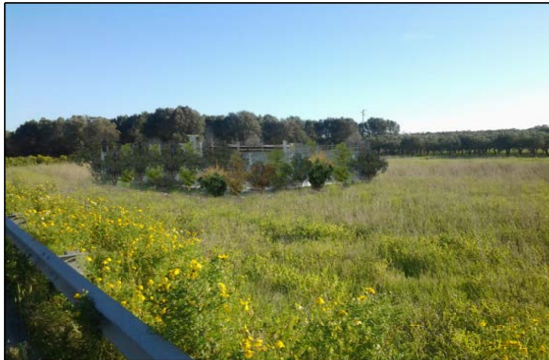
VISTA 3: STATO DI PROGETTO CON MASCHERAMENTO