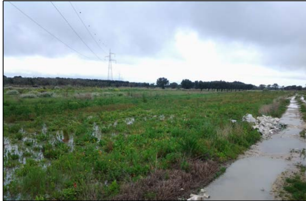
VISTA 1: STATO DI FATTO