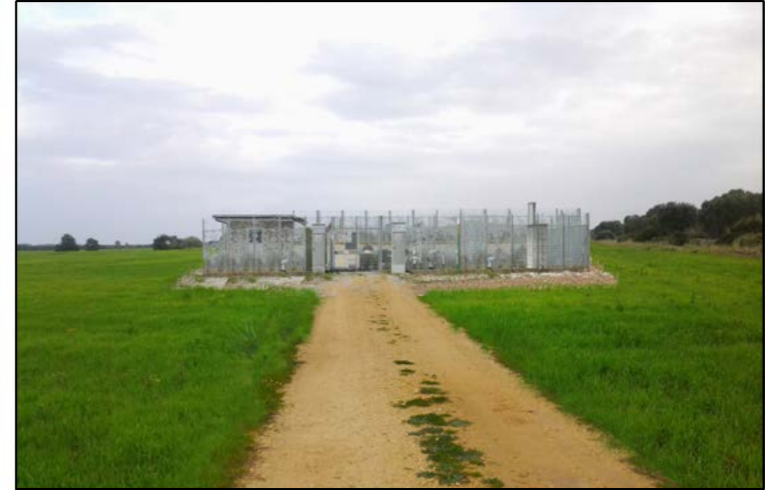
VISTA 2: STATO DI PROGETTO