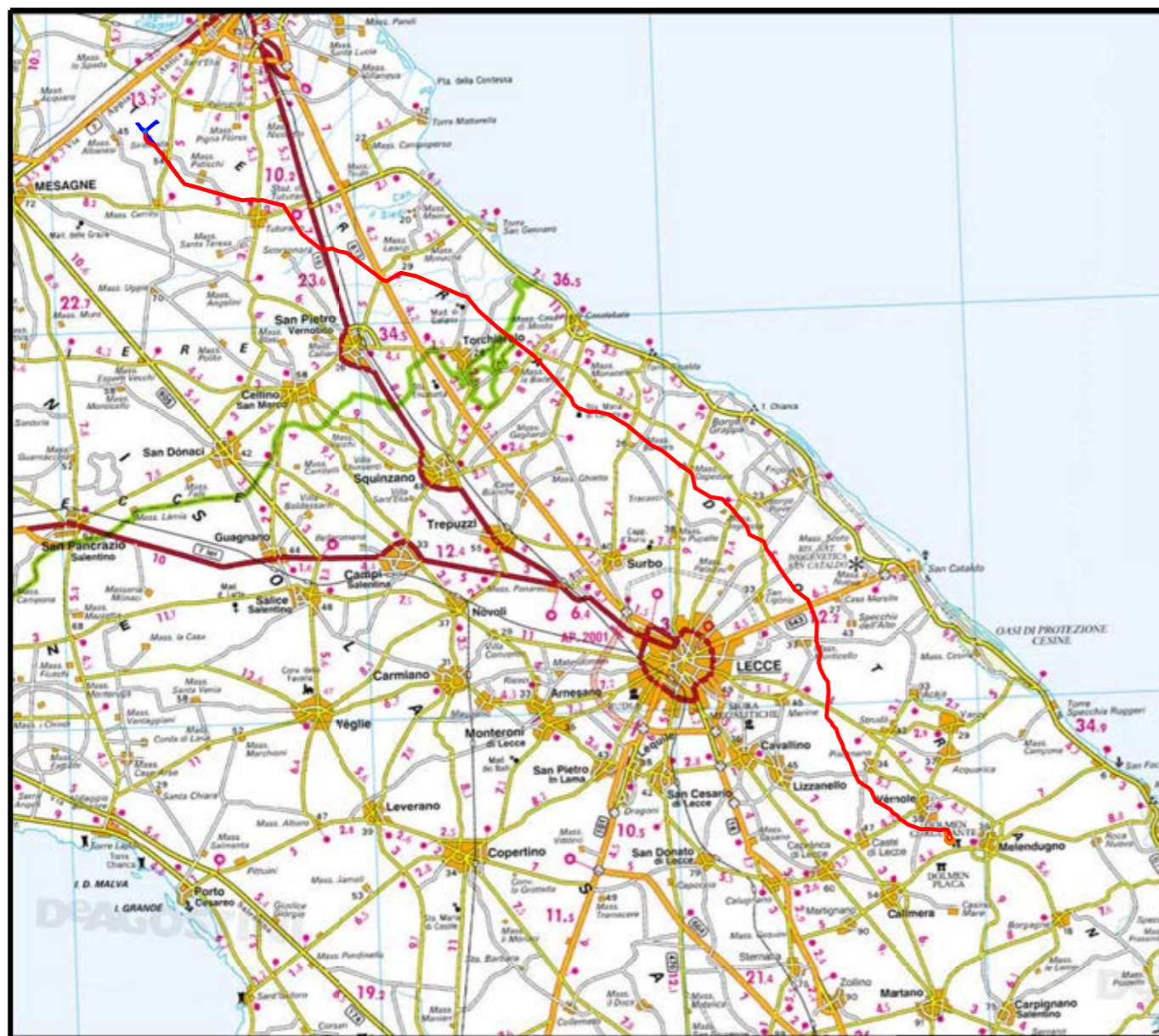
COROGRAFIA Scala 1:300.000