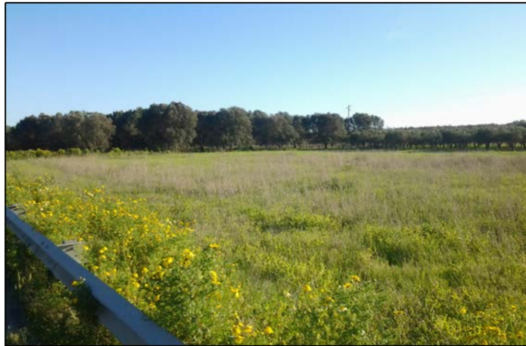
VISTA 1: STATO DI FATTO