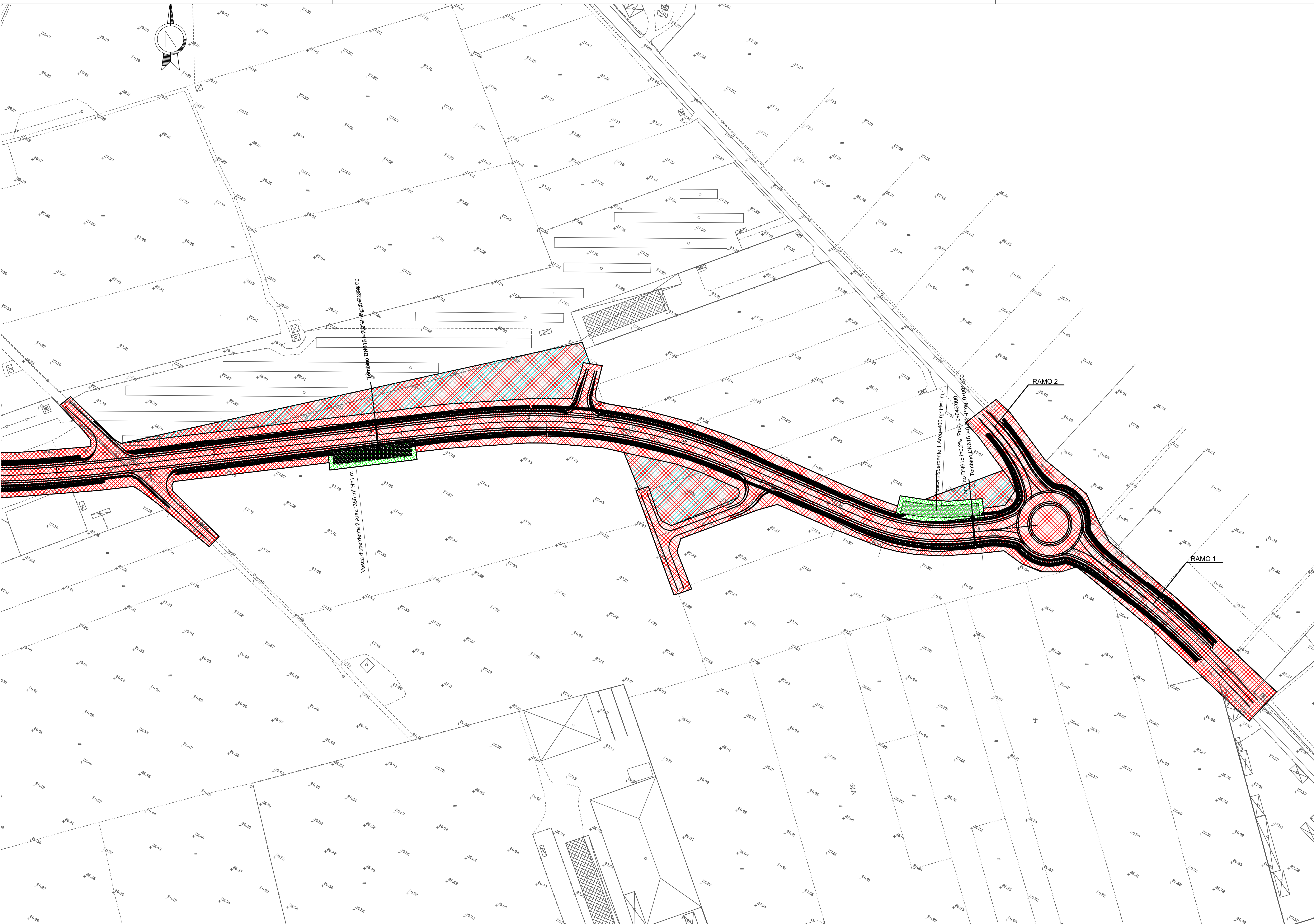
SCHEMA BONIFICA DA ORDIGNI BELLICI PROFONDA