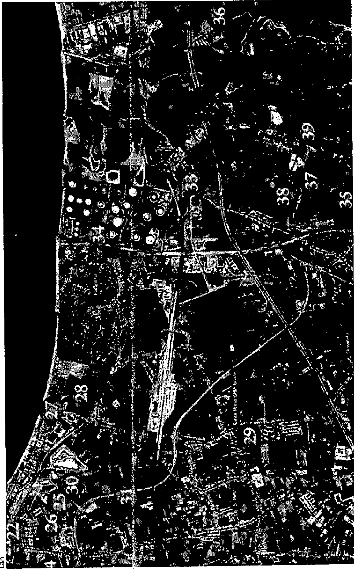
La Centrale Edipower si trova a NNE rispetto al ritrovamento 33