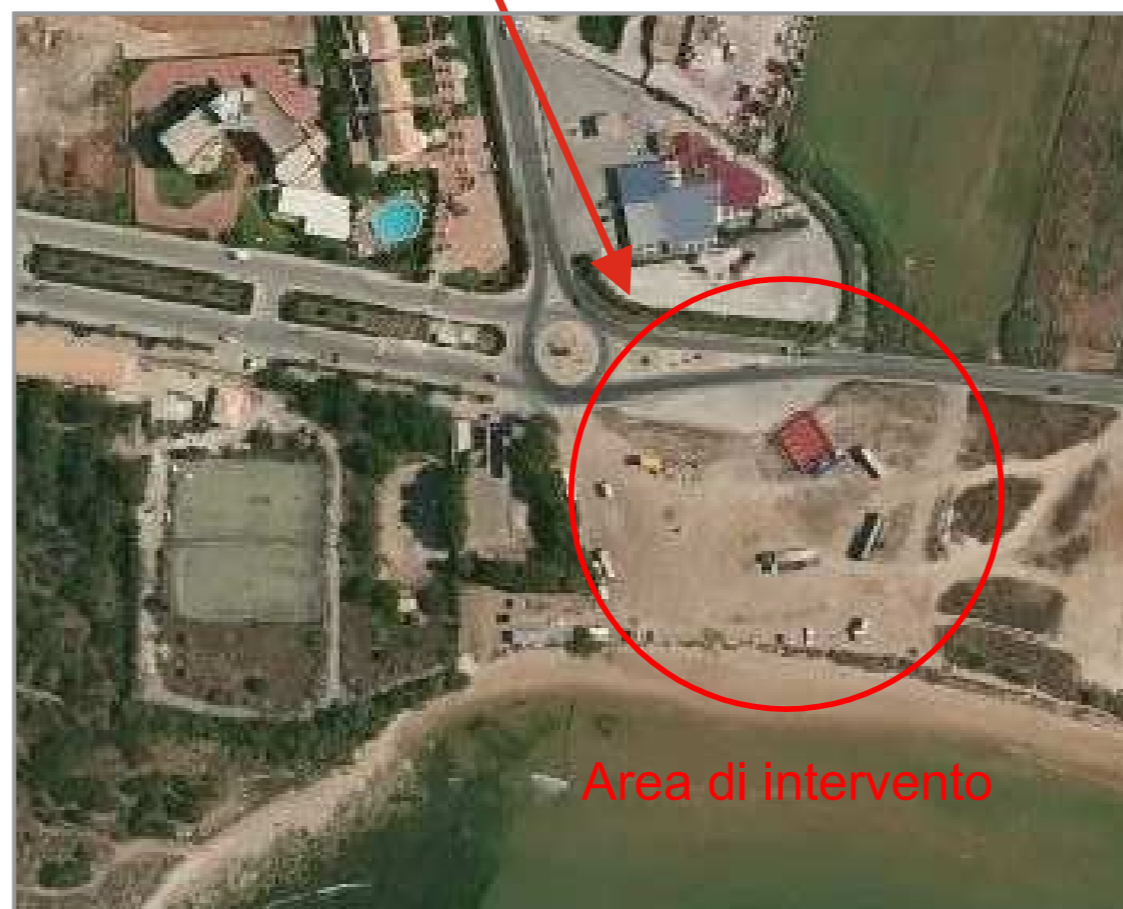
Ortofoto area approdo scala 1.2000