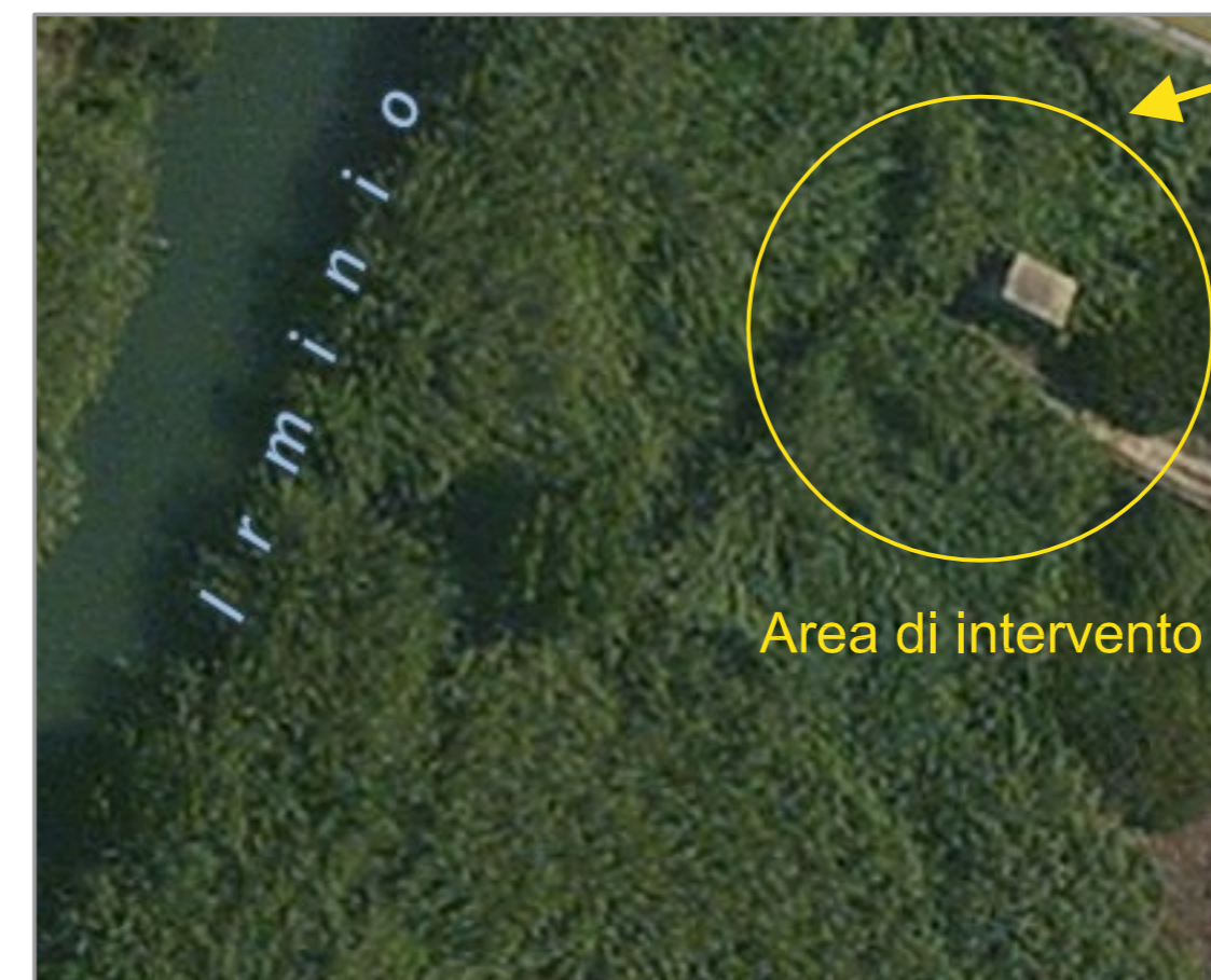
Ortofoto area Riserva