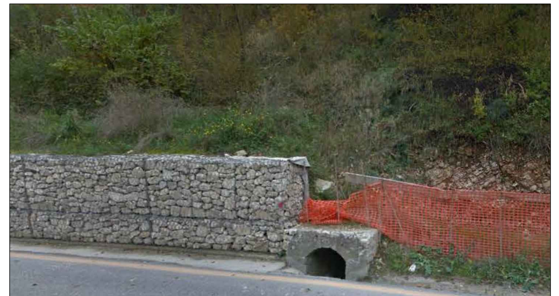
FOTO 3: Vista gabbionata esistente a protezione della strada S.S. 77 e tombino di scolo esistente