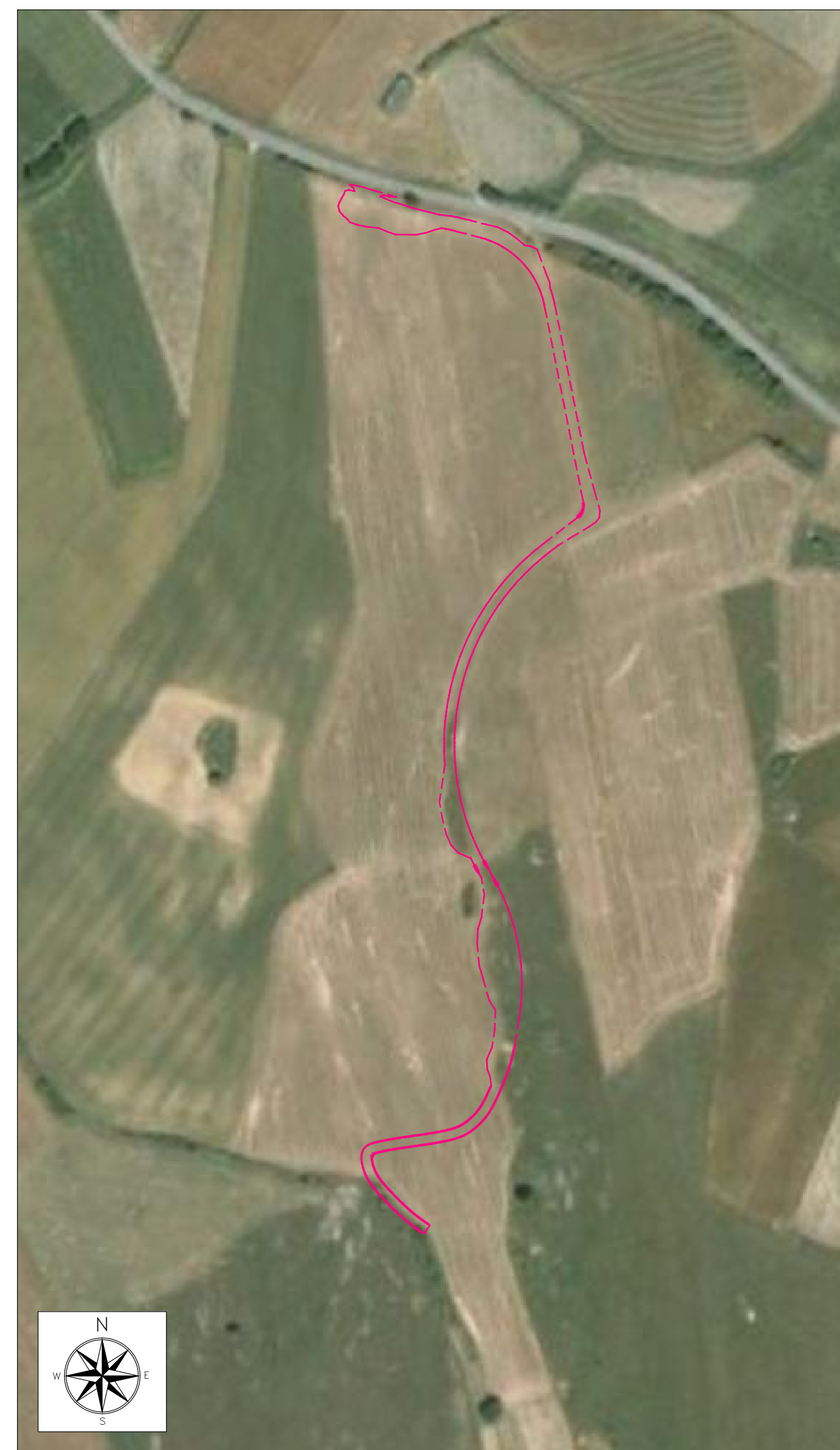
ORTOFOTO DI INQUADRAMENTO - SCALA 1:2000