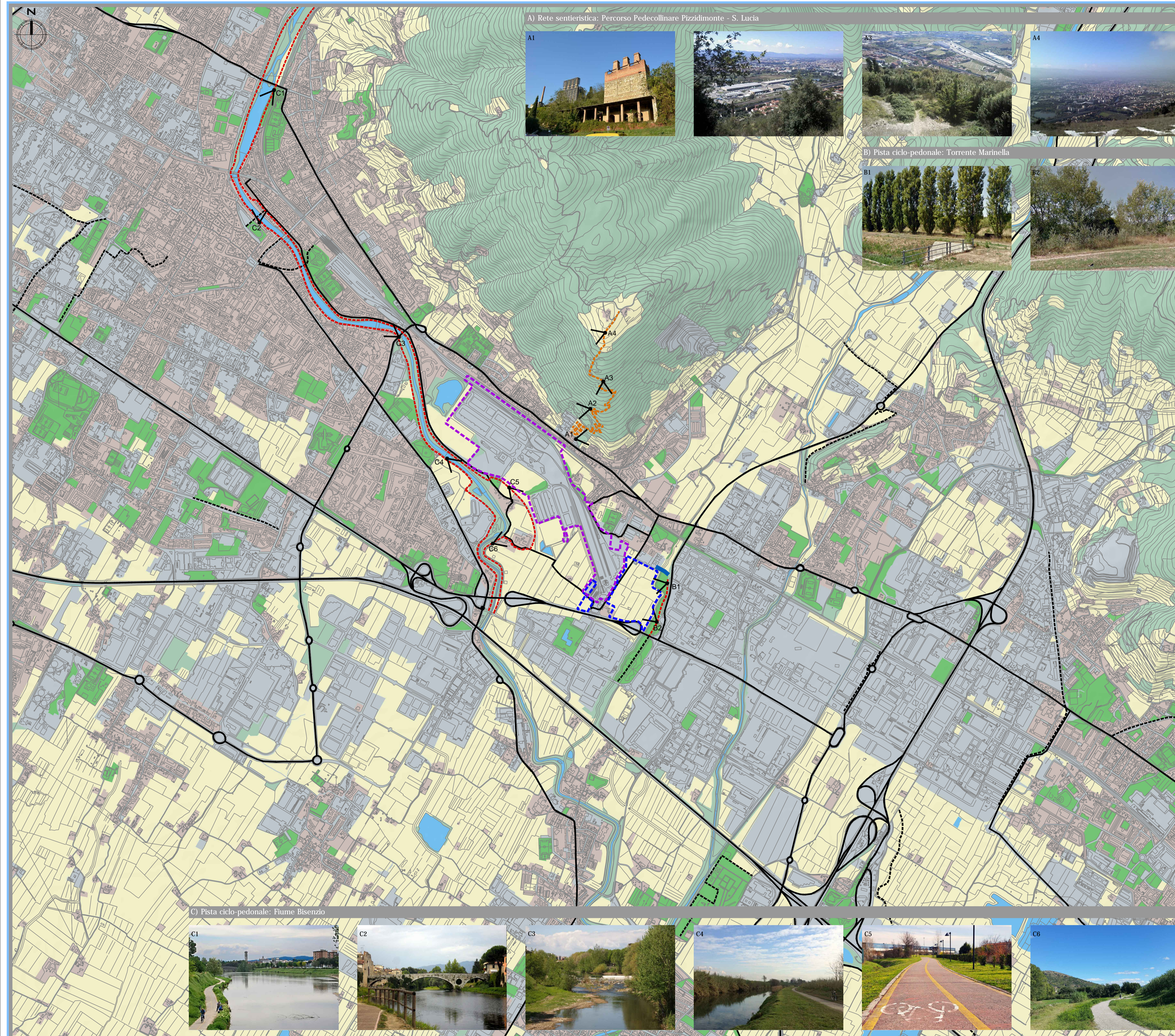
A) Rete sentieristica: Percorso Pedecollinare Pizzidimonte - S. Lucia