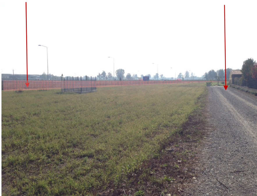
Foto 2 Raddoppio: La vista sui campi agricoli è limitata dalla presenza dell'autostrada.