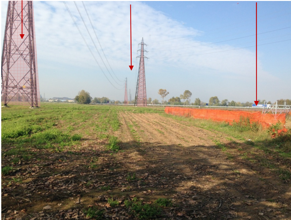
Foto 5 Raddoppio: La vista sui campi agricoli è ampia ma al contempo limitata da alcuni fattori di detrazione visiva, quali gli elettrodotti e l'autostrada.