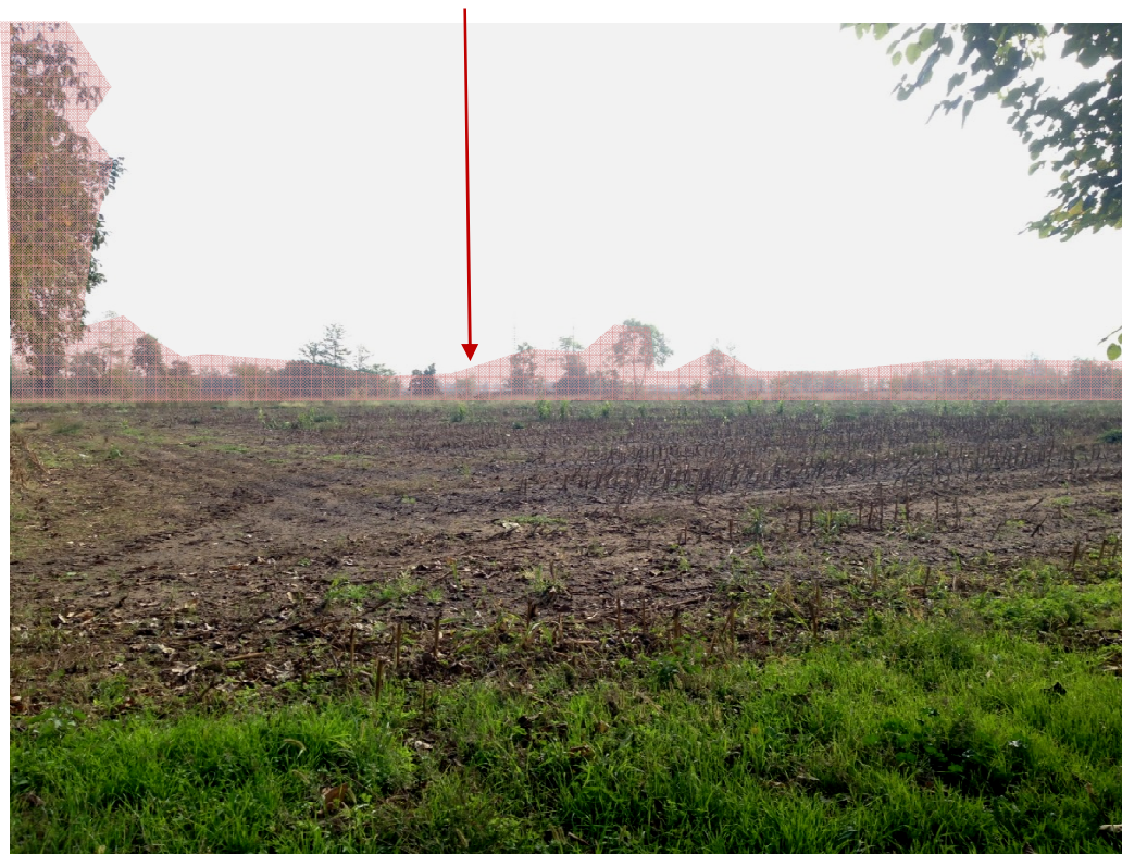
Foto 4 Raddoppio: La vista sui campi agricoli è ampia; le fasce vegetate costituiscono un limite alla fruizione visiva.