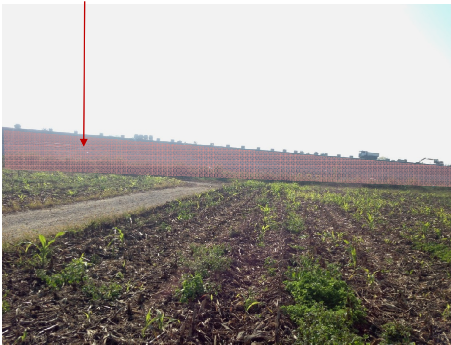
Foto 1 Raddoppio: La vista sui campi agricoli è limitata dalla presenza del fascio infrastrutturale.

Detrattore visivo: fascio infrastrutturale