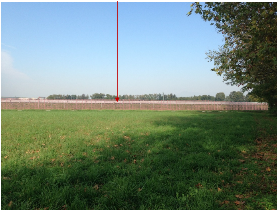
Foto 6 Raddoppio: La vista sui campi agricoli è limitata dalla presenza dell'autostrada.