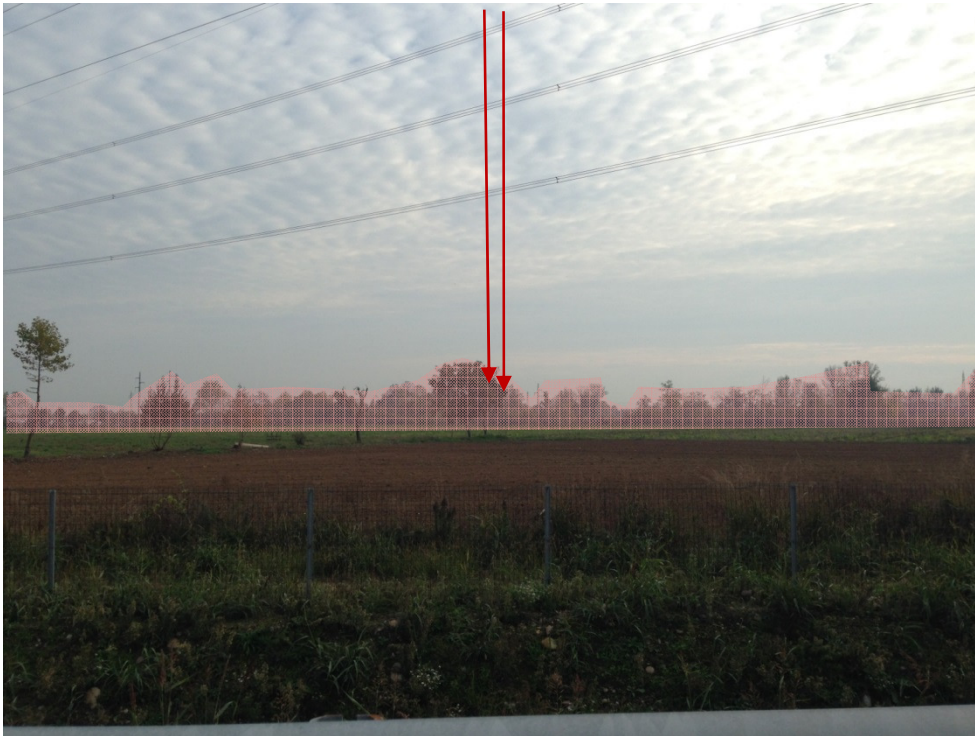
Foto 3 Raddoppio: La vista sui campi agricoli è ampia; le fasce vegetate costituiscono un limite alla fruizione visiva.