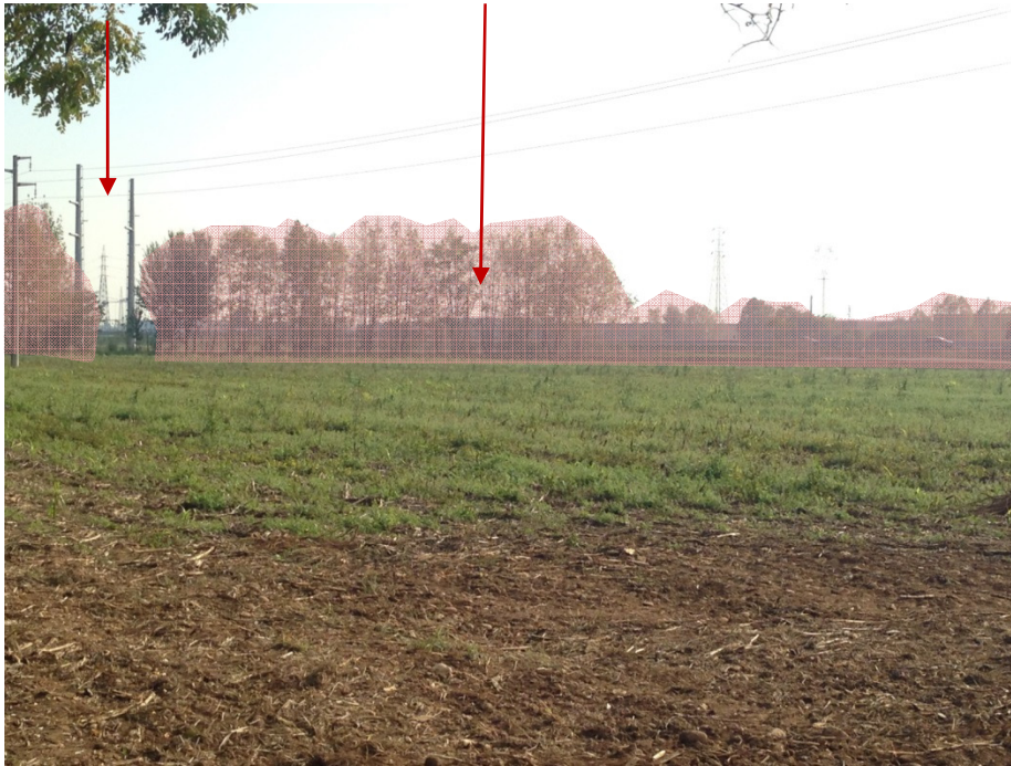
Foto 7 Raddoppio: La vista sui campi agricoli è ampia; le fasce vegetate costituiscono un limite alla fruizione visiva. Sono presenti nell'area alcuni elettrodotti.