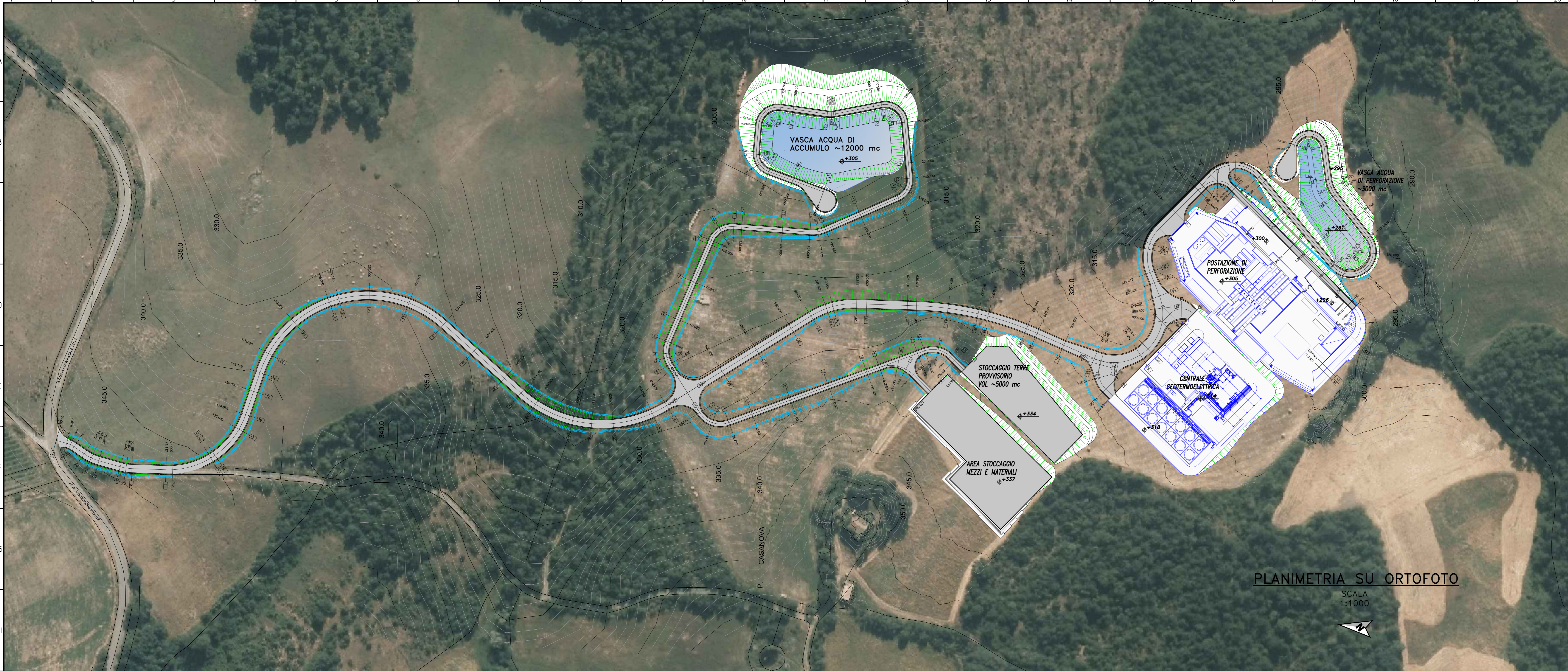
PLANIMETRIA SU ORTOFOTO