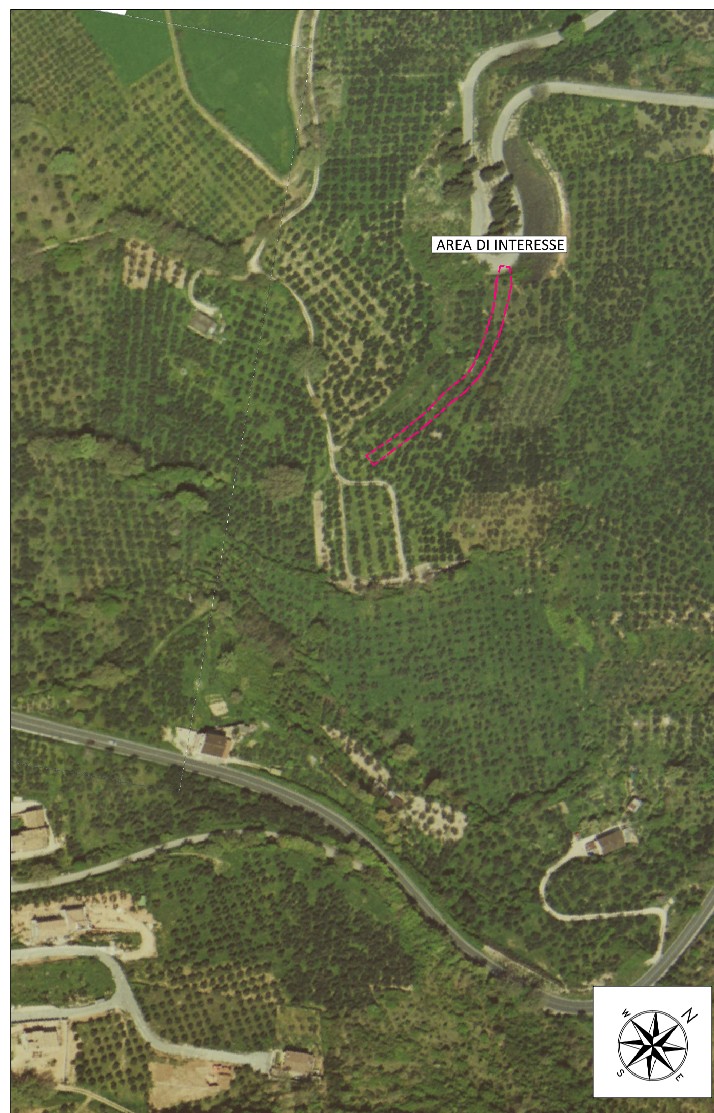
ORTOFOTO DI INQUADRAMENTO - SCALA 1:2000