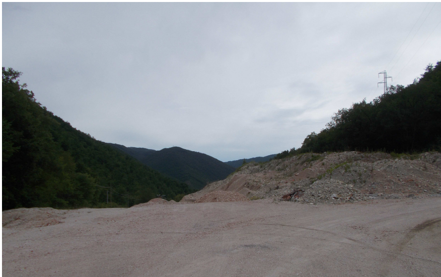
Figura 6.a - Immagine dell'area in fase di cantiere

Si riporta di seguito lo stato di fatto dell'area.