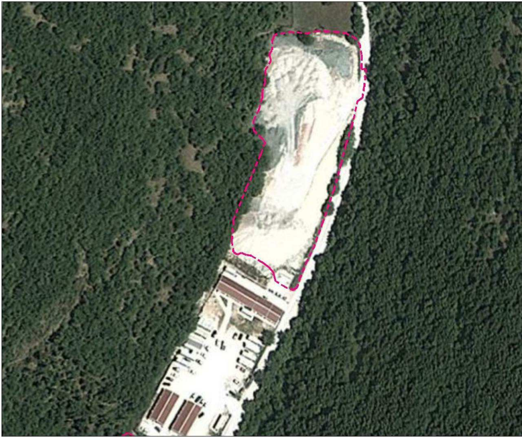
Figura 2 - Ortofoto d'inquadramento dell'area "ST18" stato attuale.