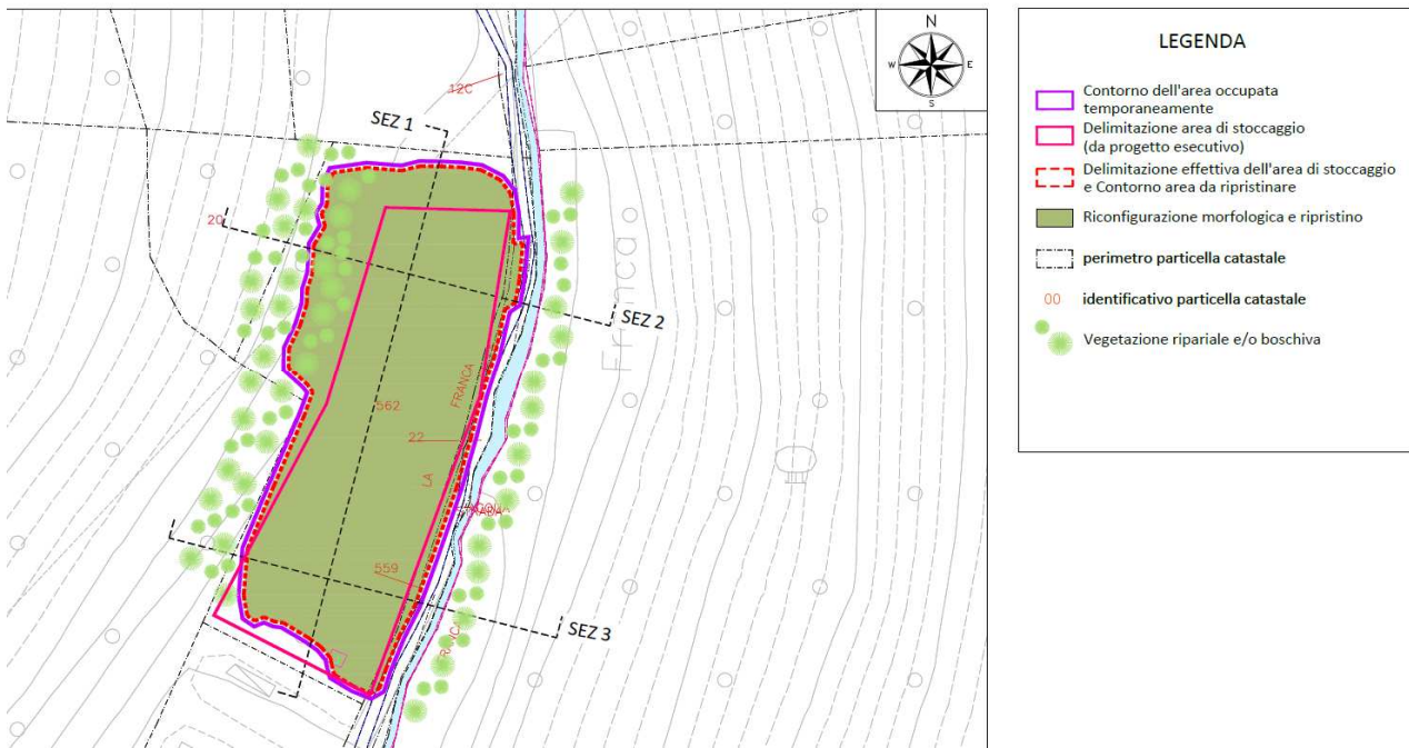
Figura 7 - Sistemazioni ambientali previste