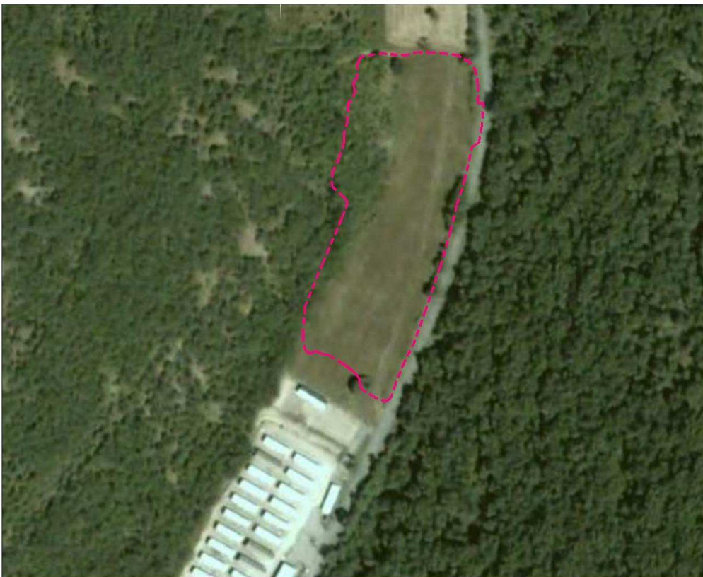
Figura 1 - Ortofoto d'inquadramento dell'area "ST18" ante operam.

L'area di cantiere "ST18", ubicata in località Leggiana, frazione di Foligno in provincia di Perugia, (Figura 1) ha operato al servizio del "Sublotto 2.1: S.S. 77 "Val di Chienti" tronco Pontelatrave – Foligno, tratto Valmenotre - galleria Muccia (esclusa galleria)", del Maxilotto 1 del sistema "Asse Viario Marche-Umbria e Quadrilatero di penetrazione interna".