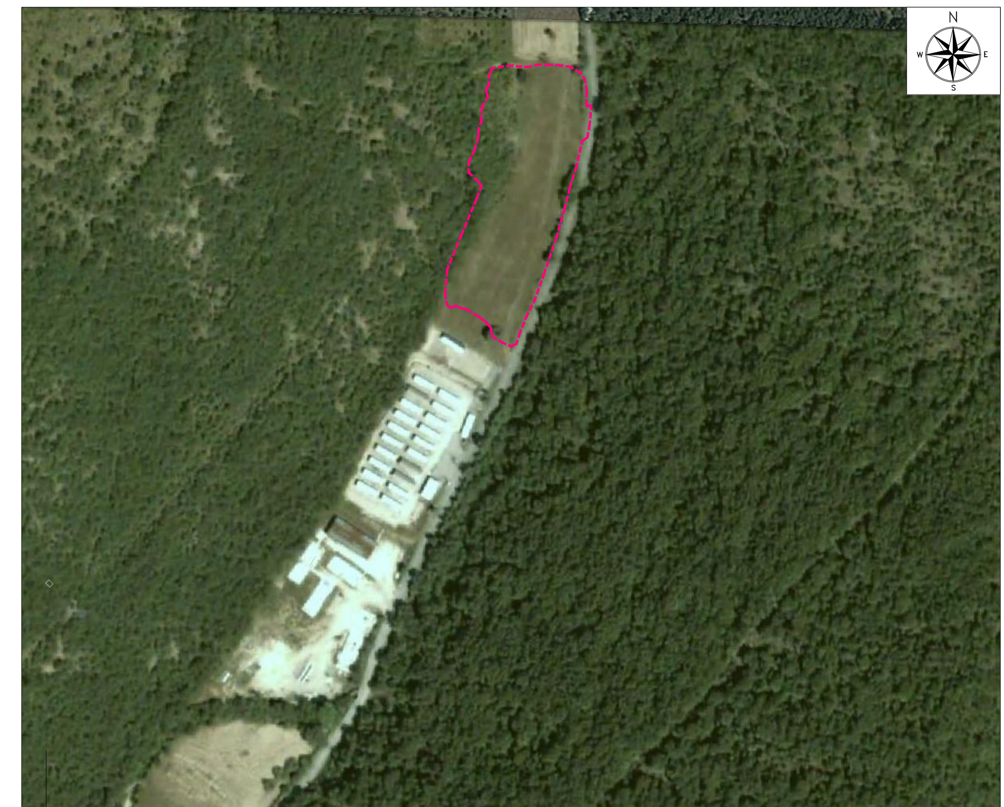
ORTOFOTO DI INQUADRAMENTO - SCALA 1:2000