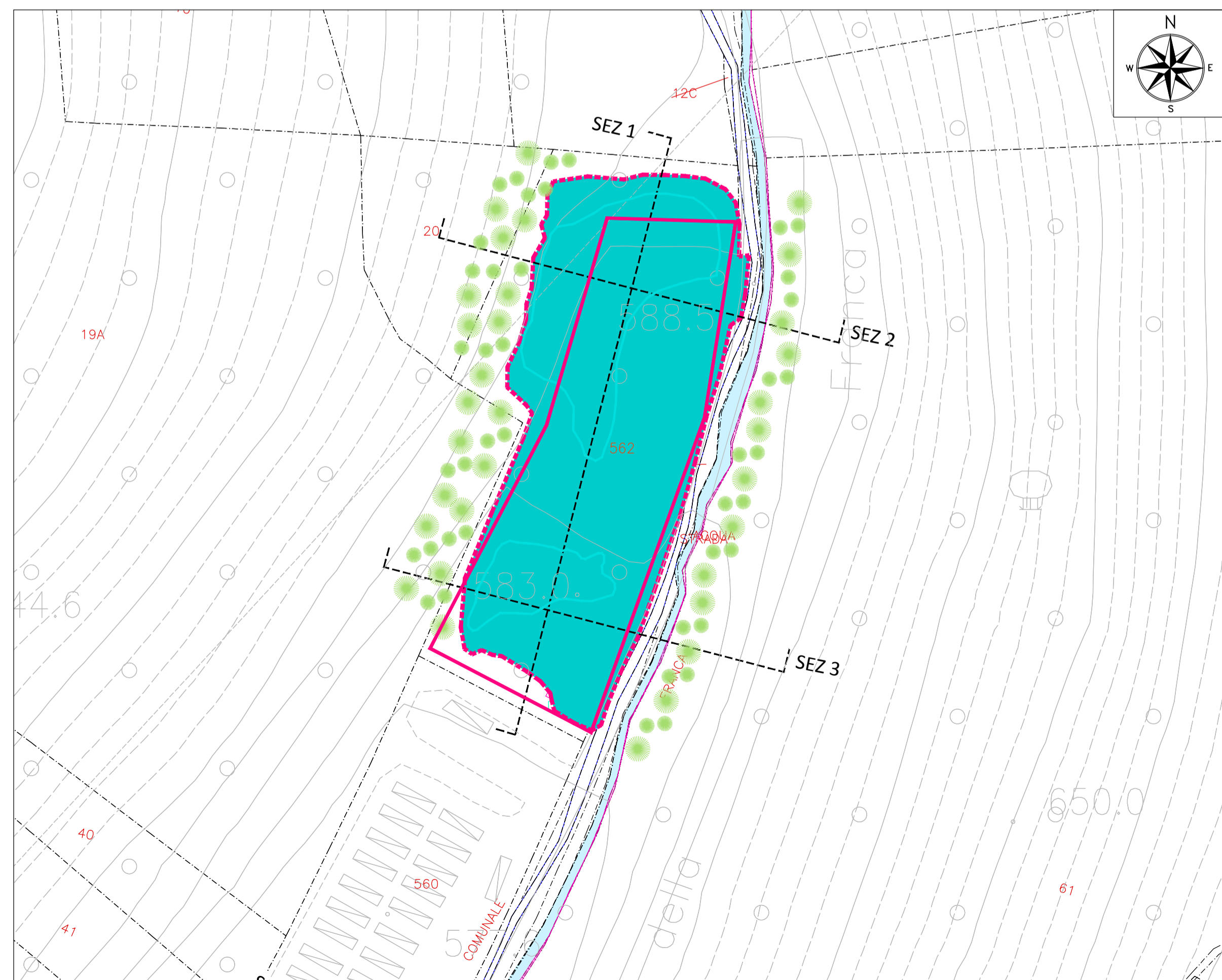
PLANIMETRIA DELLO STATO DI FATTO - SCALA 1:1000