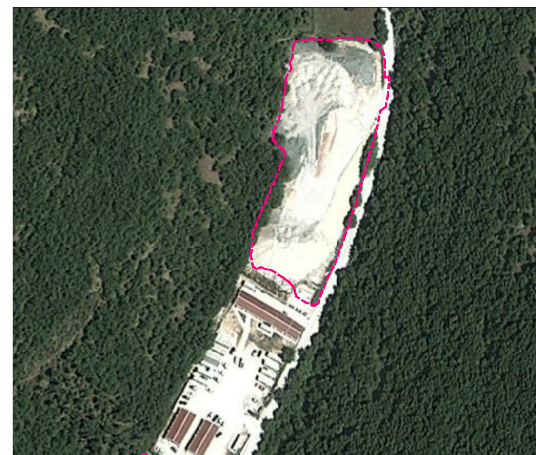
ORTOFOTO DELLO STATO DI FATTO - SCALA 1:2000