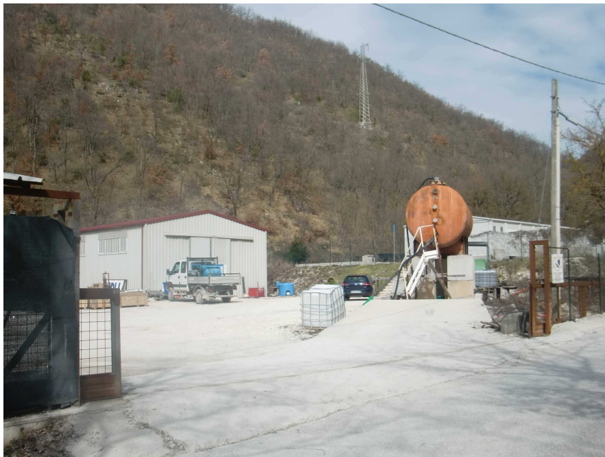
Figura 6.a - Immagine dell'area in fase di cantiere

Si riportano di seguito alcune foto riportanti lo stato di fatto dell'area.