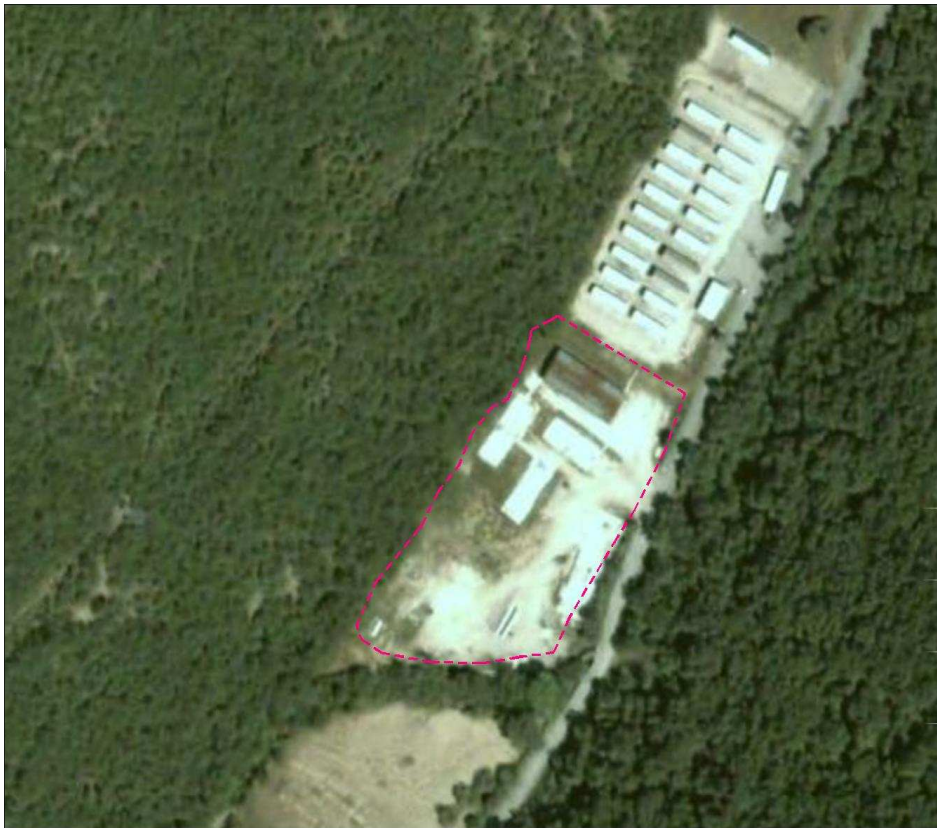
Figura 1 - Ortofoto d'inquadramento dell'area "ST19" ante operam.

L'area di cantiere "ST19", ubicata a nord-est dell'abitato di Leggiana, frazione montana del comune di Foligno (PG), (Figura 1) ha operato al servizio del "Sublotto 2.1: S.S. 77 "Val di Chienti" tronco Pontelatrave – Foligno, tratto Valmenotre - galleria Muccia (esclusa galleria)", del Maxilotto 1 del sistema "Asse Viario Marche-Umbria e Quadrilatero di penetrazione interna".