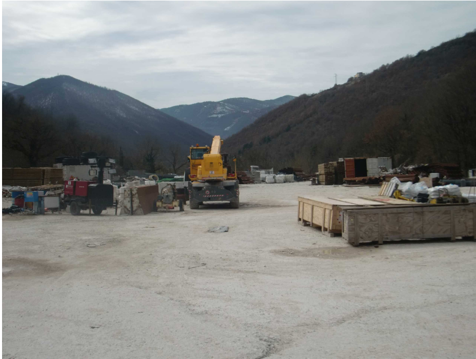
Figura 6.d - Immagine dell'area in fase di cantiere