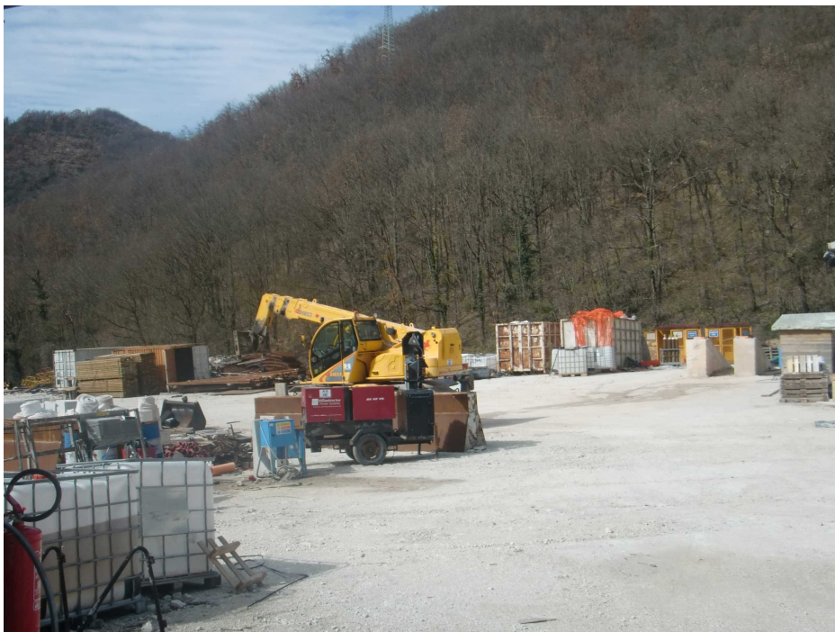
Figura 6.c - Immagine dell'area in fase di cantiere