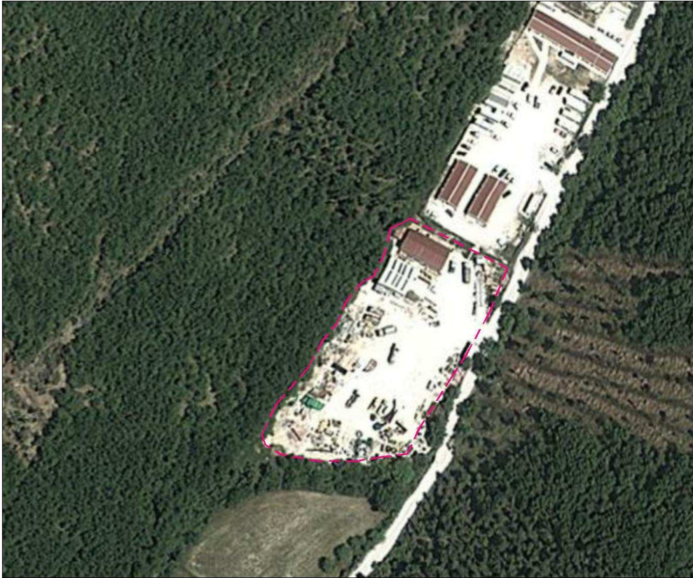
Figura 2 - Ortofoto d'inquadratura dell'area "ST19" stato attuale.