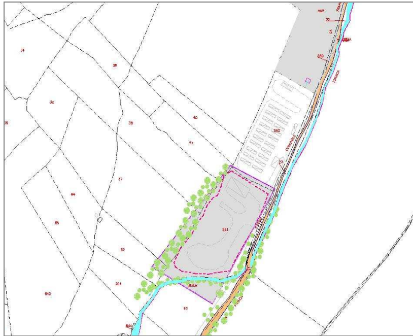
Figura 3 - Mappale con indicazione delle particelle impegnate