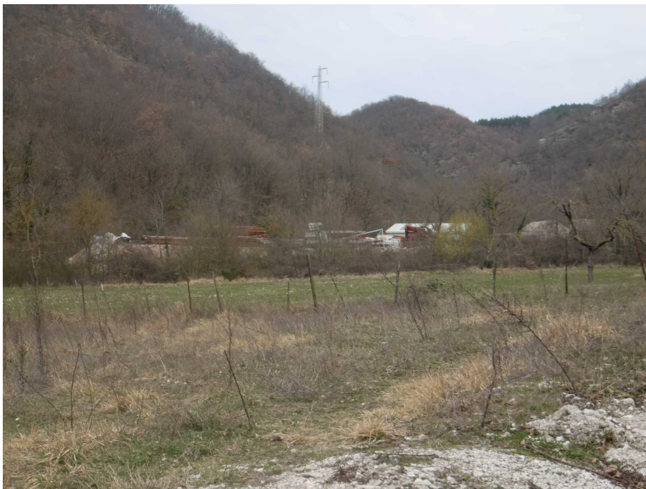
Figura 6.e - Immagine dell'area in fase di cantiere