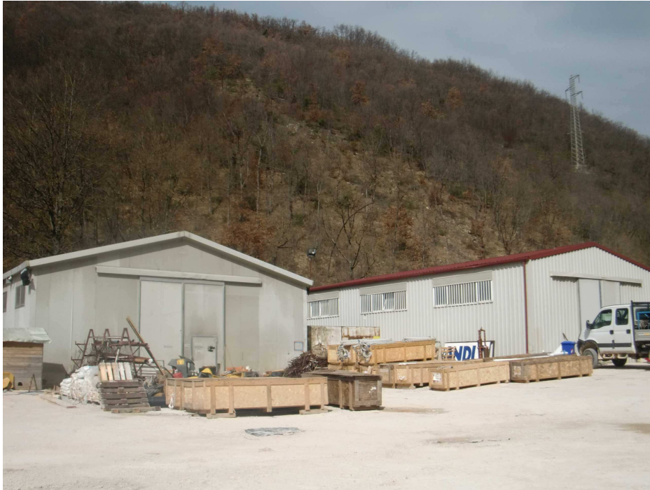
Figura 6.b - Immagine dell'area in fase di cantiere