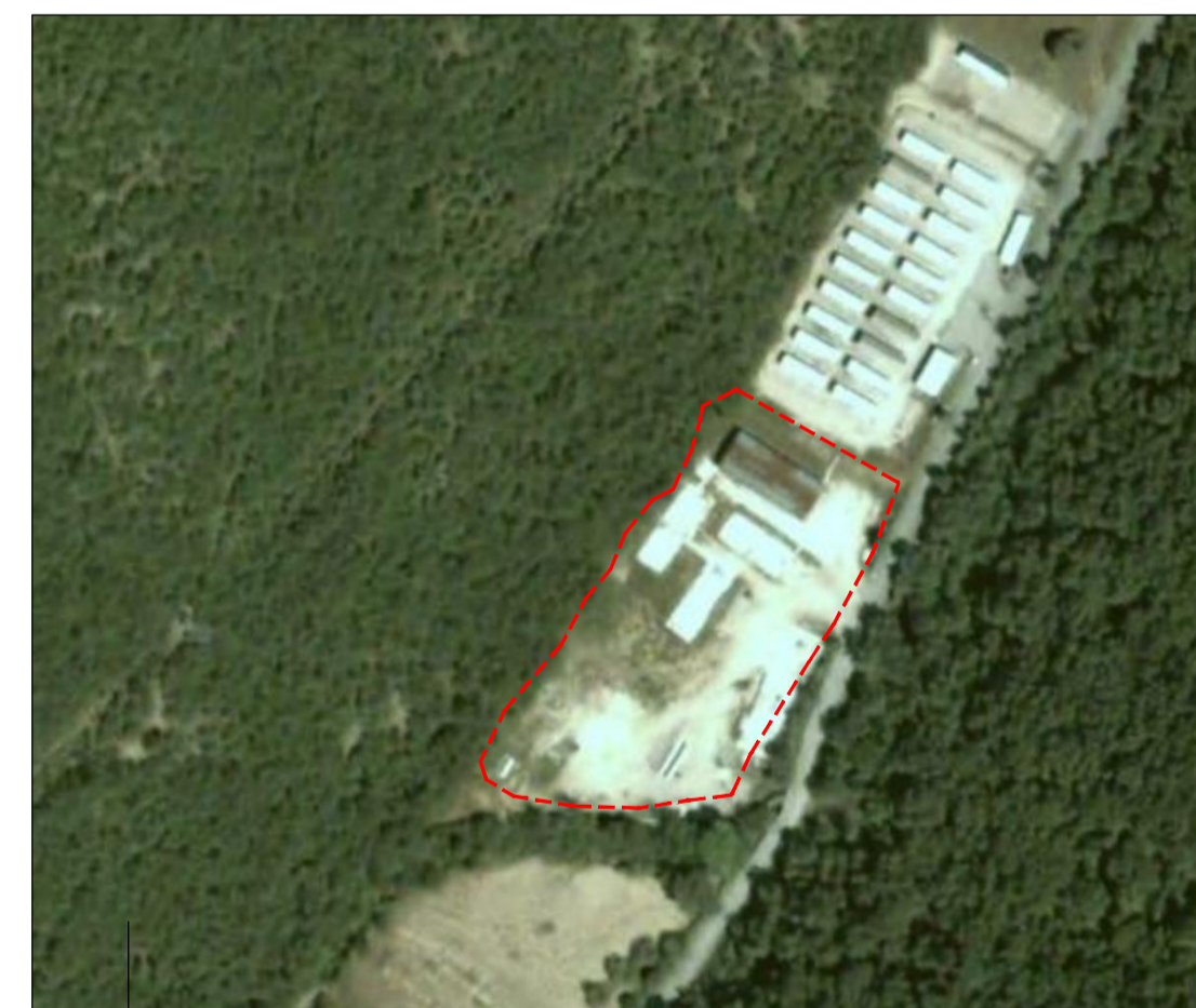
ORTOFOTO STATO ANTE OPERAM DA RIPRISTINARE - SCALA 1:2000