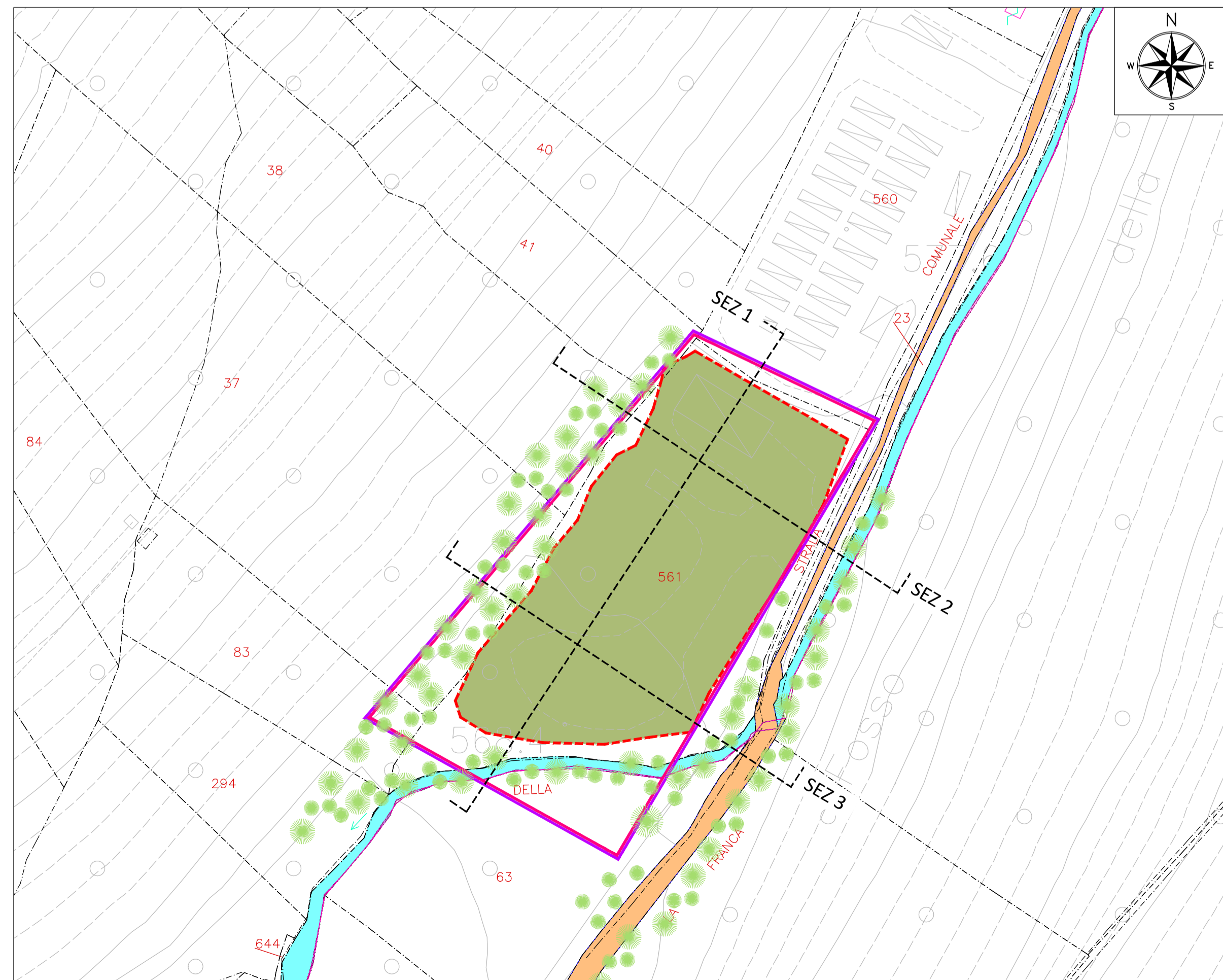
PLANIMETRIA DI PROGETTO - SCALA 1:1000