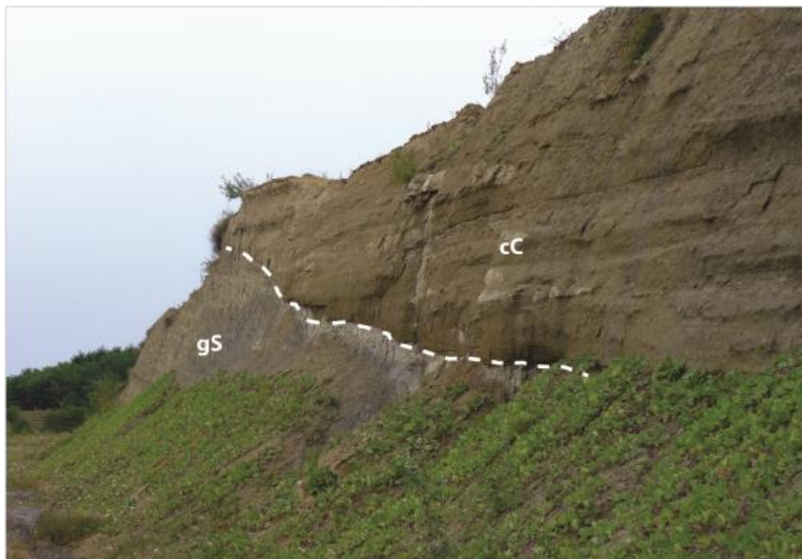
Figura 1: Evidenza del passaggio stratigrafico tra il Membro di Riomaggiore (gS) e i Conglomerati di Cassano Spinola (cC), qui rappresentati da facies fini siltoso-argillose.

I corpi conglomeratici, nel settore interessato dall'opera possono raggiungere i 2-3 m di spessore e mostrano un'estensione laterale variabile intorno alla decina di metri. Si tratta di conglomerati clast-supported, con matrice sabbiosa, a ciottoli centimetrico-decimetrici, passanti lateralmente ad areniti medie e grossolane. Localmente sono osservabili ciottoli embricati e una stratificazione mal definita. Il contatto inferiore con i depositi pelitico-siltosi sottostanti risulta netto ed erosionale. Sulla base del modello proposto da Ghibaudo et al. (1985), questi depositi possono essere interpretati come depositi di delta-conoide distale.