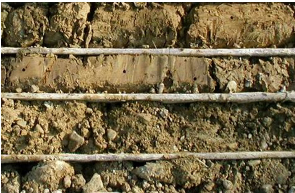
Figura 2: Sondaggio XA301B111, dettaglio dell'unità fl2.

Le osservazioni stratigrafiche derivano soprattutto dalle stratigrafie di sondaggio e in minima parte da osservazioni dirette. I depositi fluviali medi (fl2) sono costituiti da ghiaie sabbioso-limose debolmente argillose. Dall'analisi granulometrica di 4 campioni raccolti in 1 sito le classi granulometriche risultano così distribuite: 57% ghiaia, 21% sabbia, 15% limo e 7% argilla. La matrice fine, siltoso-arenacea è mediamente alterata. Solo localmente sono presenti livelli metrici di argille e silt-argillosi (Figura 2).