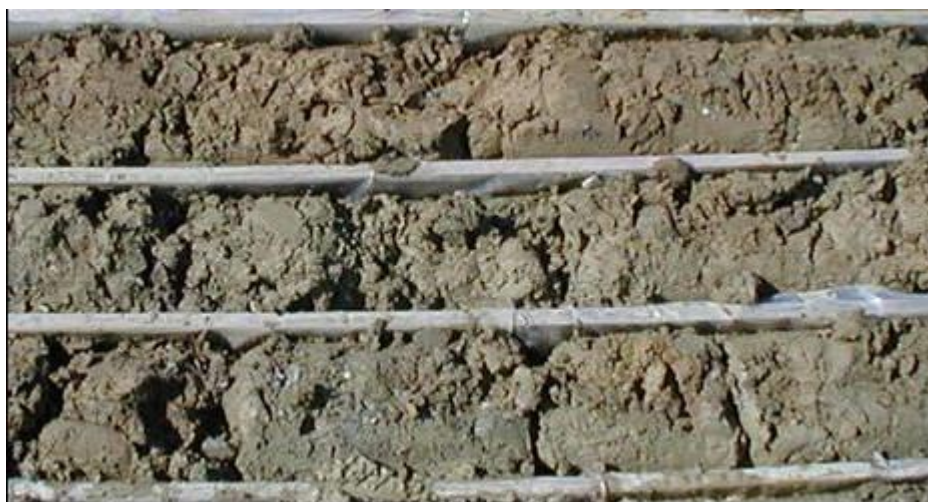
Figura 3: Sondaggio XA301C087, dettaglio dell'unità fl3a.

L'unità stratigraficamente inferiore è costituita da ghiaie sabbiose limoso/argillose (fl3a). Dall'analisi granulometrica di 18 campioni raccolti in 7 siti differenti le classi granulometriche risultano così distribuite: 64% ghiaia, 19% sabbia, 11% limo e 6% argilla (Figura 3). Nel complesso si presentano da mediamente a poco alterati. Localmente sono presenti livelli metrici di argille e silt argillosi.