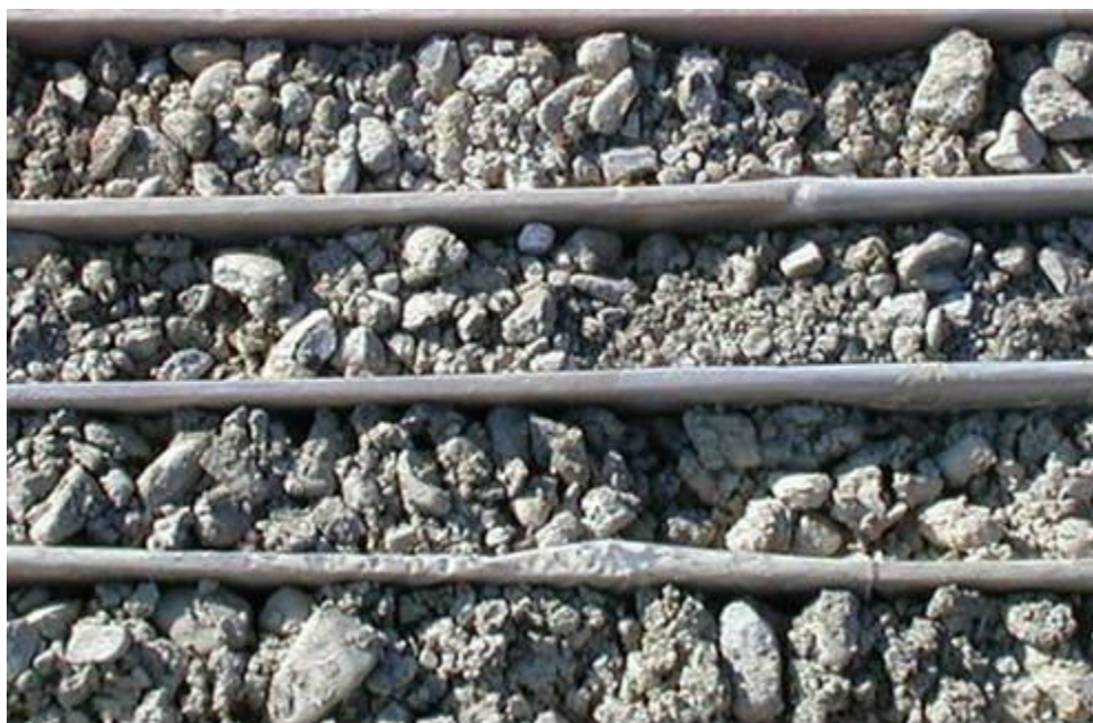
Figura 4: Sondaggio XA301C087, dettaglio dell'unità f13b.

La superficie di appoggio basale, probabilmente di natura erosiva, è modellata nei depositi fluviali recenti (f13a). I depositi fluviali recenti (f13) sono ricoperti da suoli che presentano un grado di evoluzione medio-basso con potenza media variabile da 0,5 a 2 metri, attualmente utilizzati come coltivo.