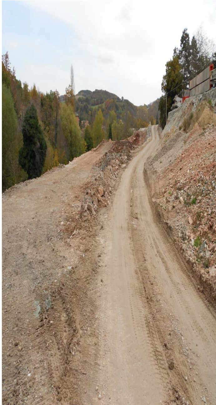
Figura 6.d - Immagine dell'area in fase di cantiere