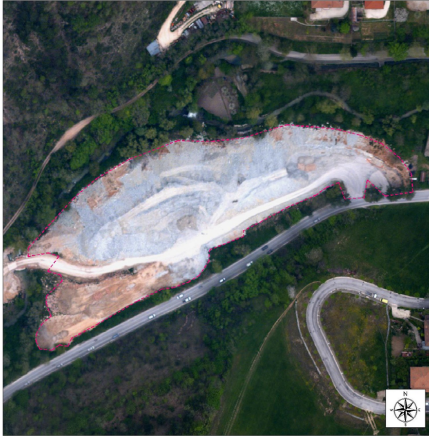
Figura 2 - Ortofoto d'inquadratura dell'area "S7" stato attuale