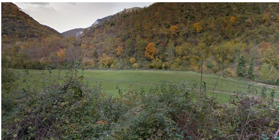
Figura 4 - Immagini dell'area di cantiere Ante Operam

Il coltivo originario rispondeva esattamente alla classificazione catastale, cioè consisteva in seminativo e zone di cespugli-bosco (Figura 4).