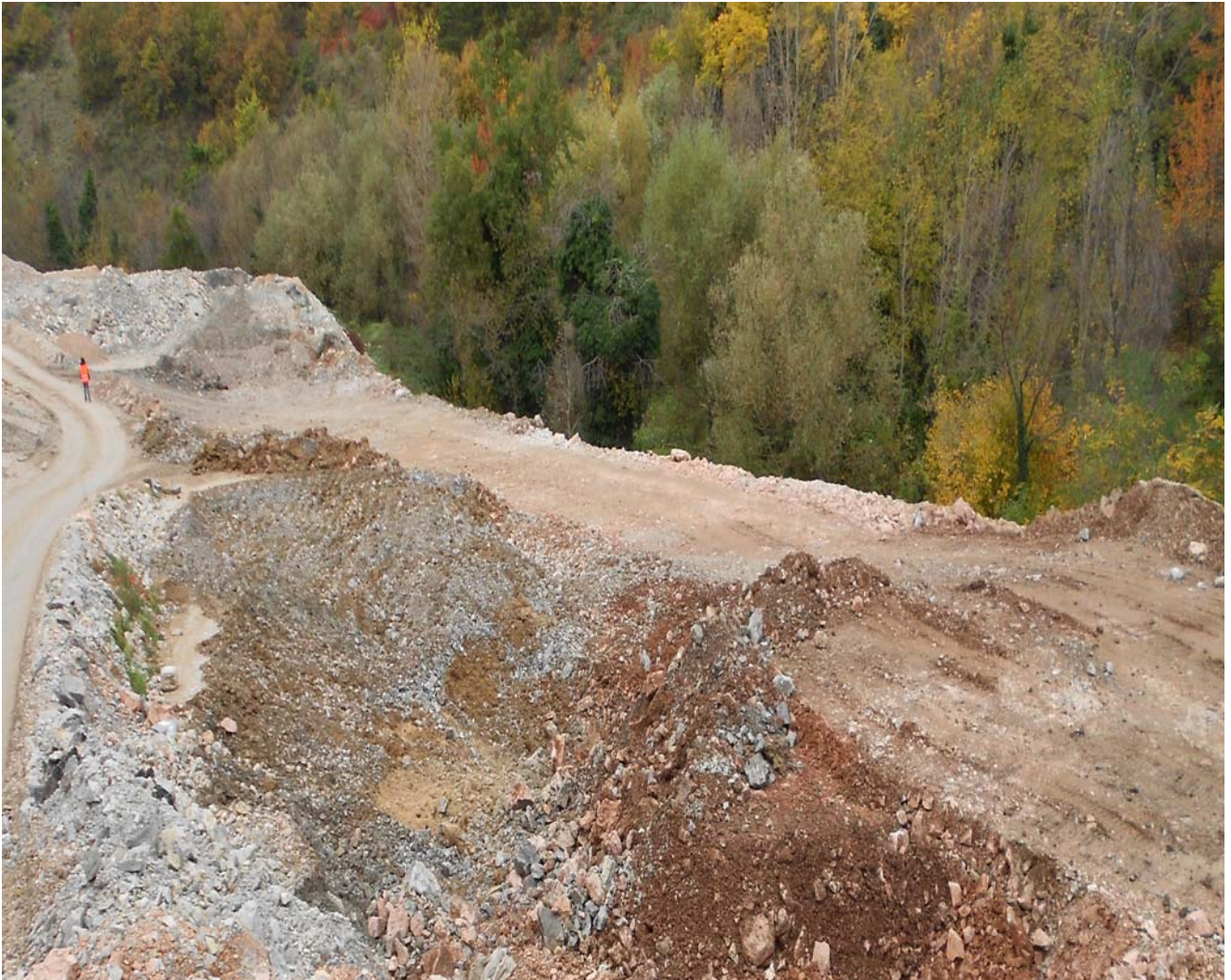
Figura 6.c - Immagine dell'area in fase di cantiere