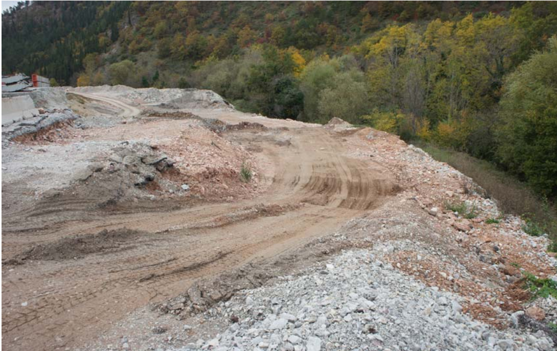
Figura 6.a - Immagine dell'area in fase di cantiere