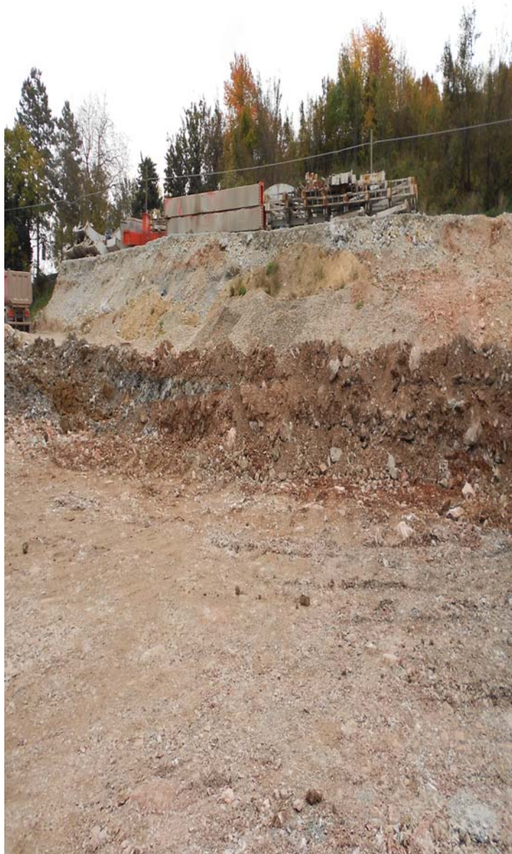
Figura 6.e - Immagine dell'area in fase di cantiere

Le azioni ambientalmente rilevanti e con effetti duraturi della realizzazione del cantiere secondario S7 furono essenzialmente le seguenti: