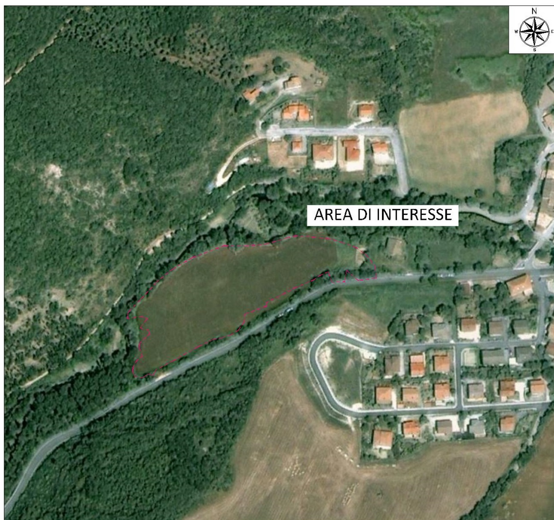
Figura 1 - Ortofoto d'inquadramento dell'area "S7" ante operam

L'area S7 (Figura 1 e 2), ubicata in località Muccia, in provincia di Macerata, ha operato al servizio del subplotto 1.2 - lato est (Tratto Galleria Muccia-Pontelatrave), del Maxilotto 1 del sistema "Asse Viario Marche-Umbria e Quadrilatero di penetrazione interna".