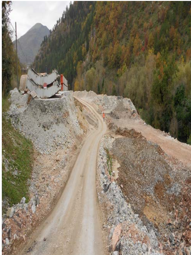
Figura 6.b - Immagine dell'area in fase di cantiere