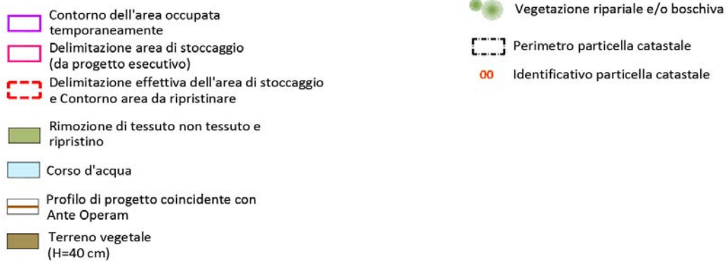
Figura 7 - Sistemazioni ambientali previste