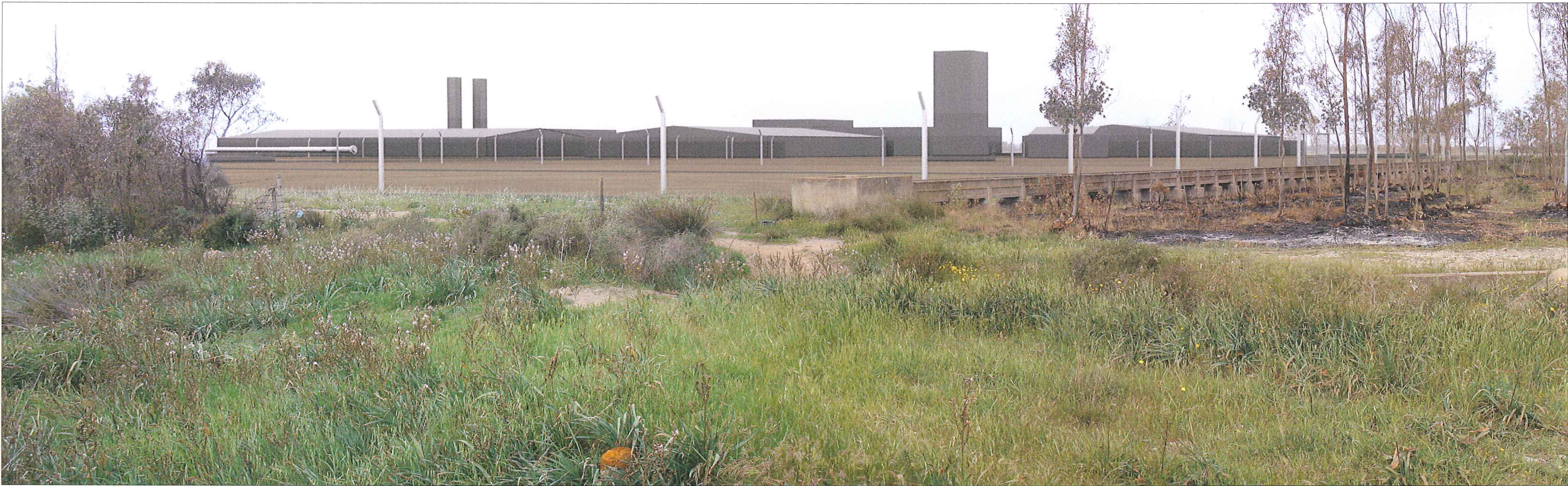
FOTOINSERIMENTO DEL TERMINALE DI PORTO BOTTE