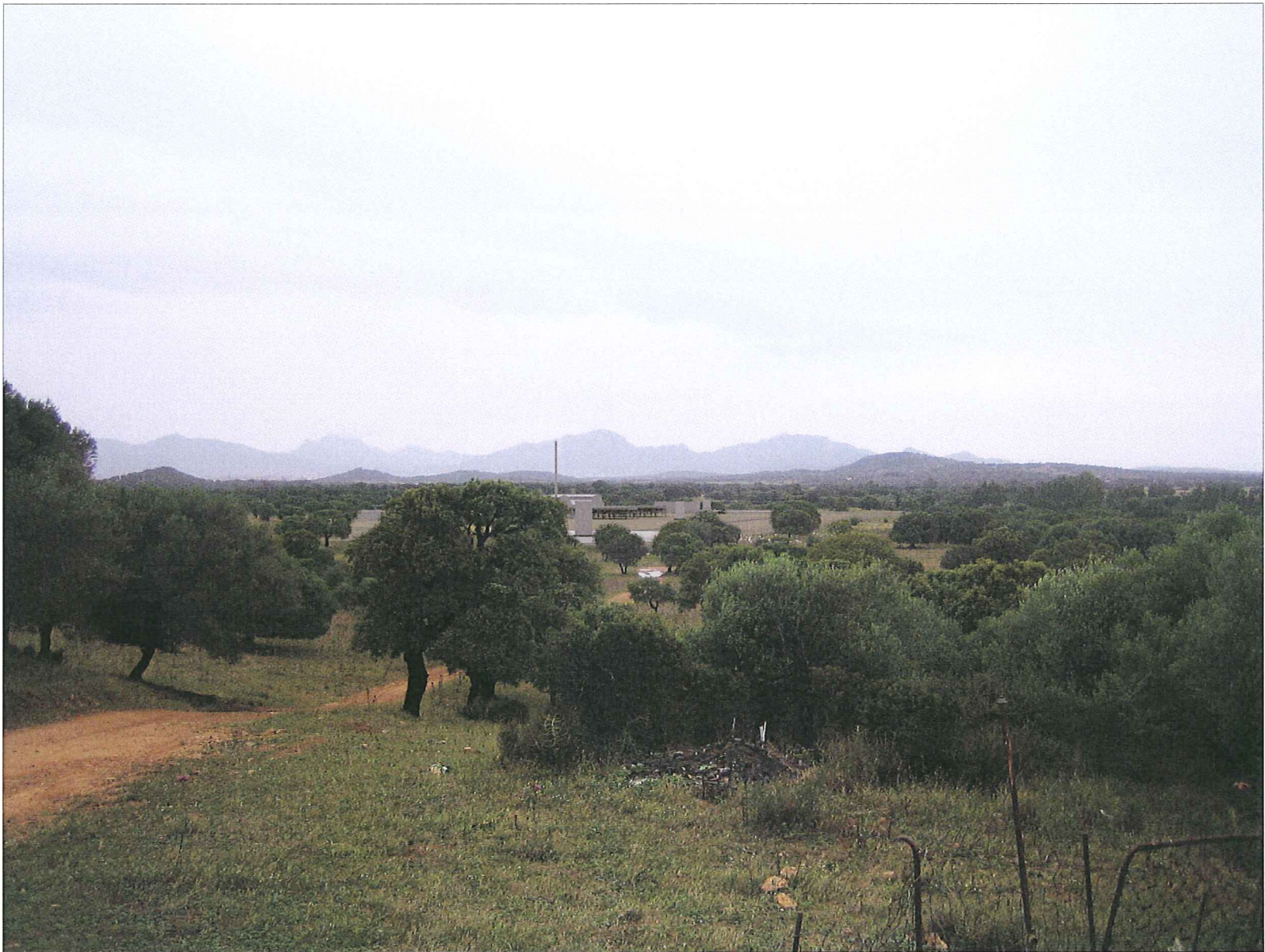
FOTOINSERIMENTO DELLA CENTRALE DI COMPRESSIONE