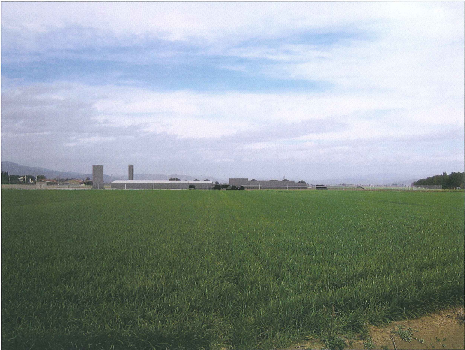
FOTOINSERIMENTO DEL TERMINALE DI PIOMBINO