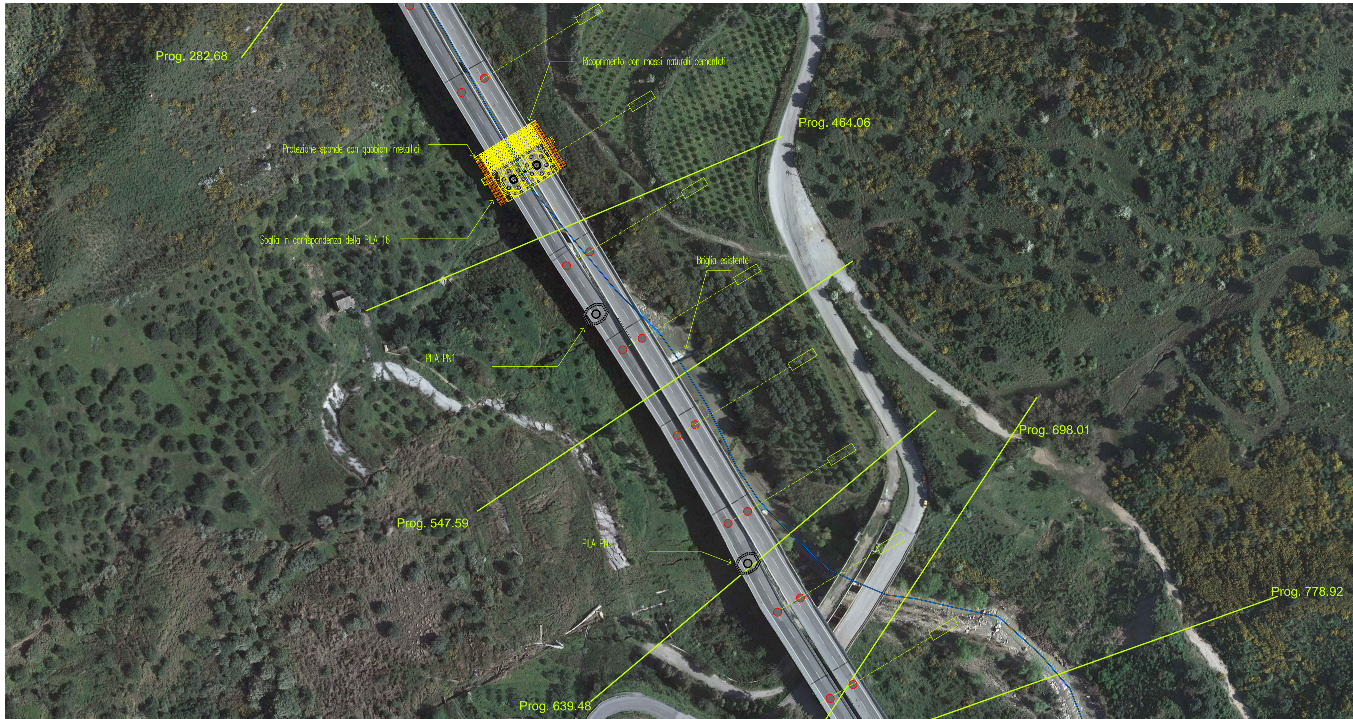
PROFILO IDRICO scala Y 1:500 scala X 1:5000