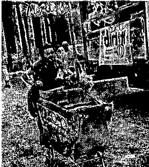
itore di mojito "in carrello"