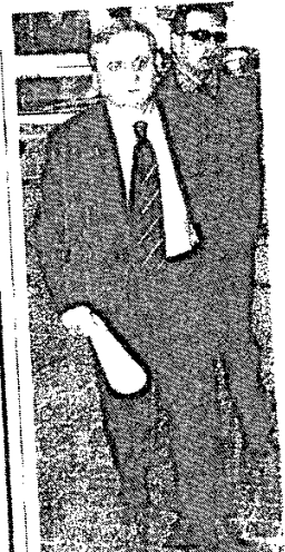
WELFARE Il ministro Maurizio Sacconi (A). A destra, il presidente dell'Inps, Antonio Mastrapasqua

TERNA S.p.A. - Sede in Roma - Viale Egidio Galvani, 70 Capitale sociale Euro 140.195.000 (a 30 aprile 2009) interamente versato Registro della Impresa di Roma - Codice Fiscale e Partita I.V.A. n. 09779651007 R.E.A. di Roma n. 927410