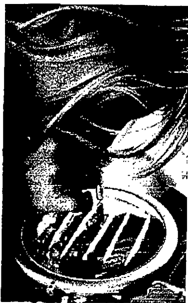
La cocaina è sempre più diffusa fra i giovanissimi, soprattutto a fine settimana

FERRARA, SEI ARRESTI. STUPEFACENTI OFFERTI A RAGAZZINI DI 15 ANNI