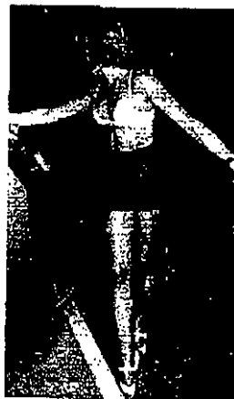
L'episodio si è verificato nei pressi di Villa Celli alla periferia della città

vetture per prendere, a suo dire, il portafogli nel baule. Entro' invece in scena il complice che, armato di mazza da baseball, pestò selvaggiamente il sudamericano, al quale la coppia sottrasse la borsa con gli introiti della serata. Uno dei due aggressori però, nella foga del pestaggio, perse il cellulare, che è servito agli agenti come elemento di partenza per laboriose indagini. La coppia di malviventi è stata così identificata e, riconosciuta dalla vittima, ha ammesso le proprie responsabilità al termine di un lungo interrogatorio.