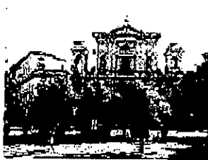
PIAZZA TOMMASEO Nella guida è definito "il principale punto di ritrovo dei bambini di Milano"