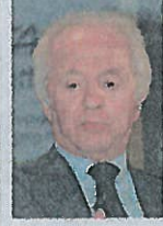
Patron Leonardo Del Vecchio, 81 anni, fondatore del gruppo

Un passaggio che «rappresenta la garanzia che crescita,