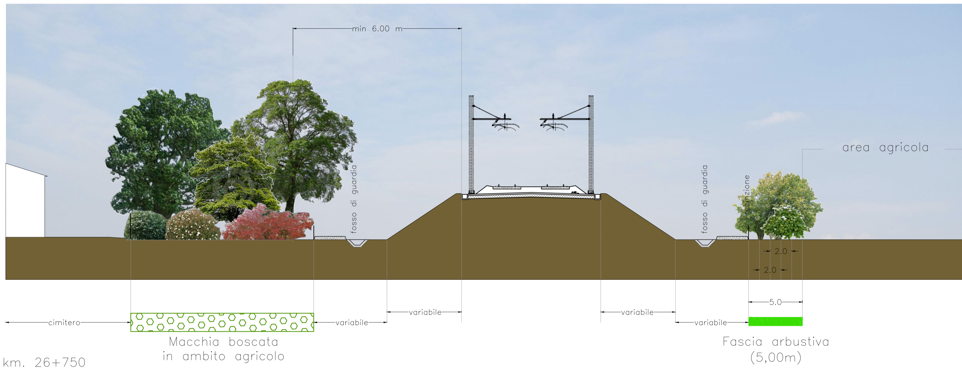
Sezione tipo - km. 26+750

Dati desunti da: IN0D00DI2W9IA0000004B_00A