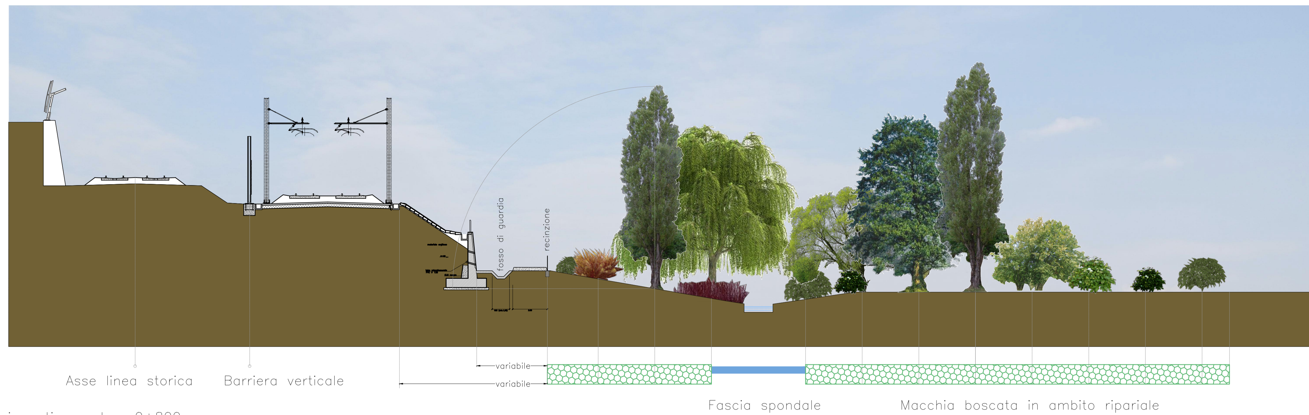
Sezione tipo - km. 0+800