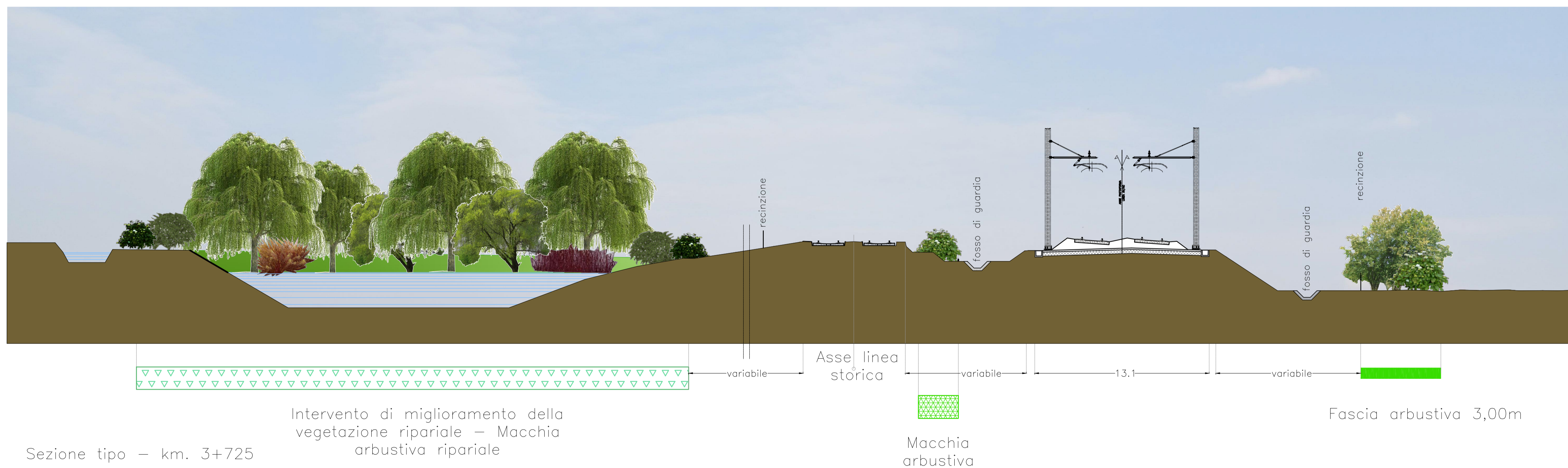
Sezione tipo - km. 3+725