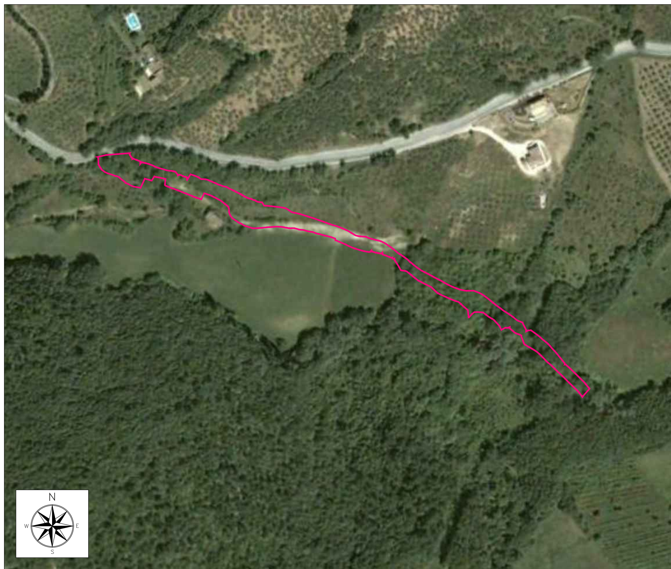
ORTOFOTO DI INQUADRAMENTO - SCALA 1:2000