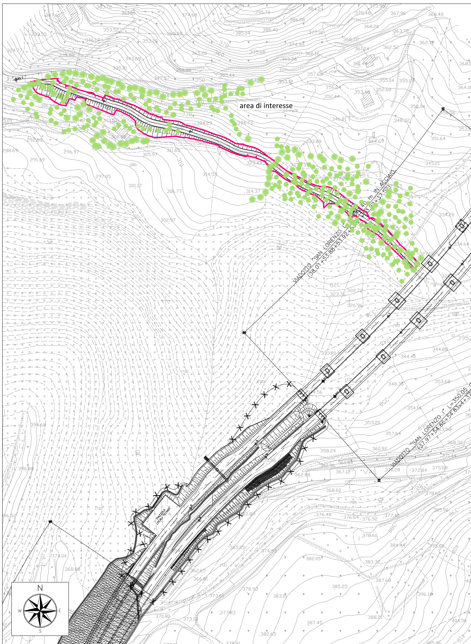
PLANIMETRIA DI INQUADRAMENTO - SCALA 1:2000