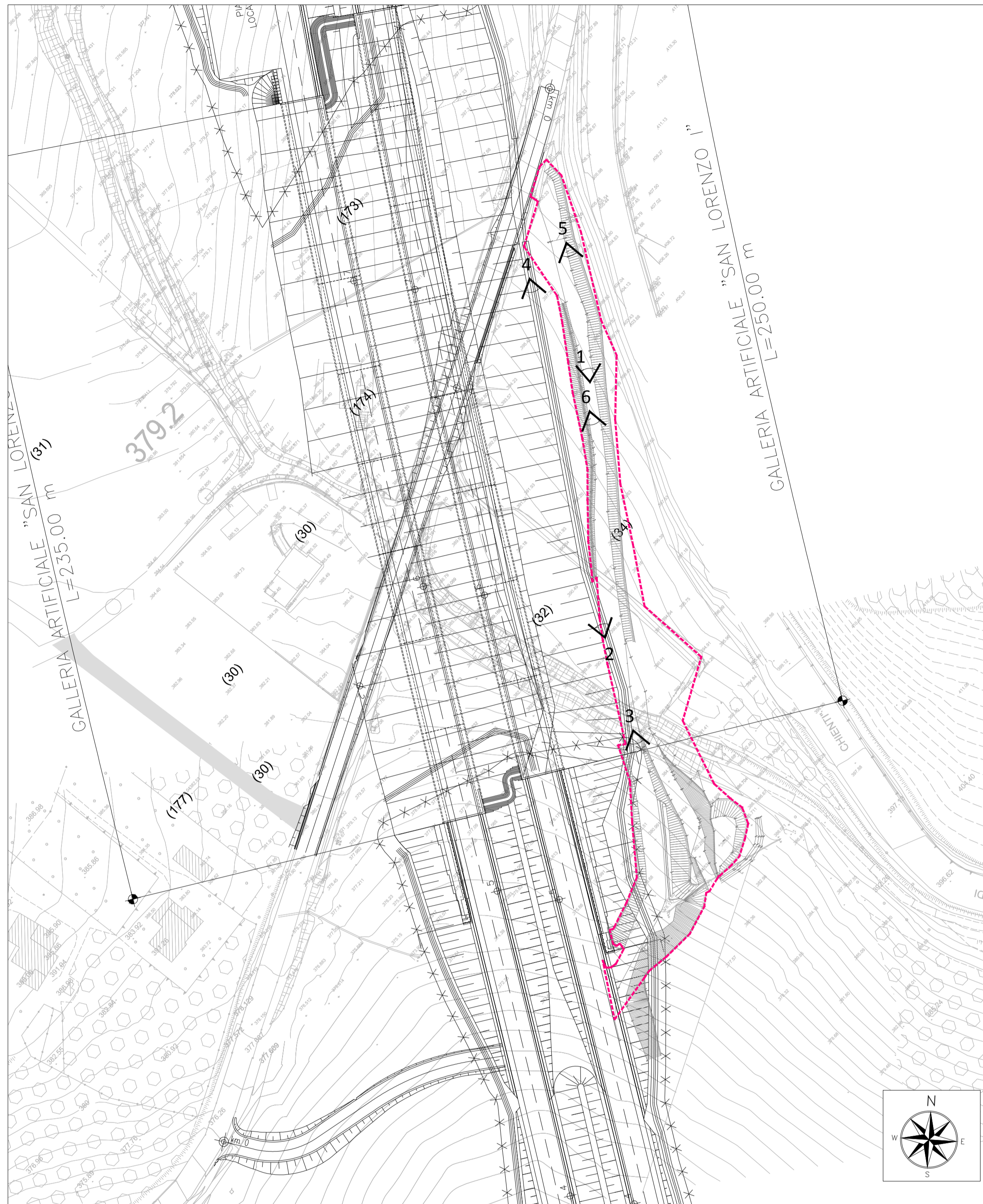
PLANIMETRIA DELLO STATO DI FATTO - SCALA 1:1000