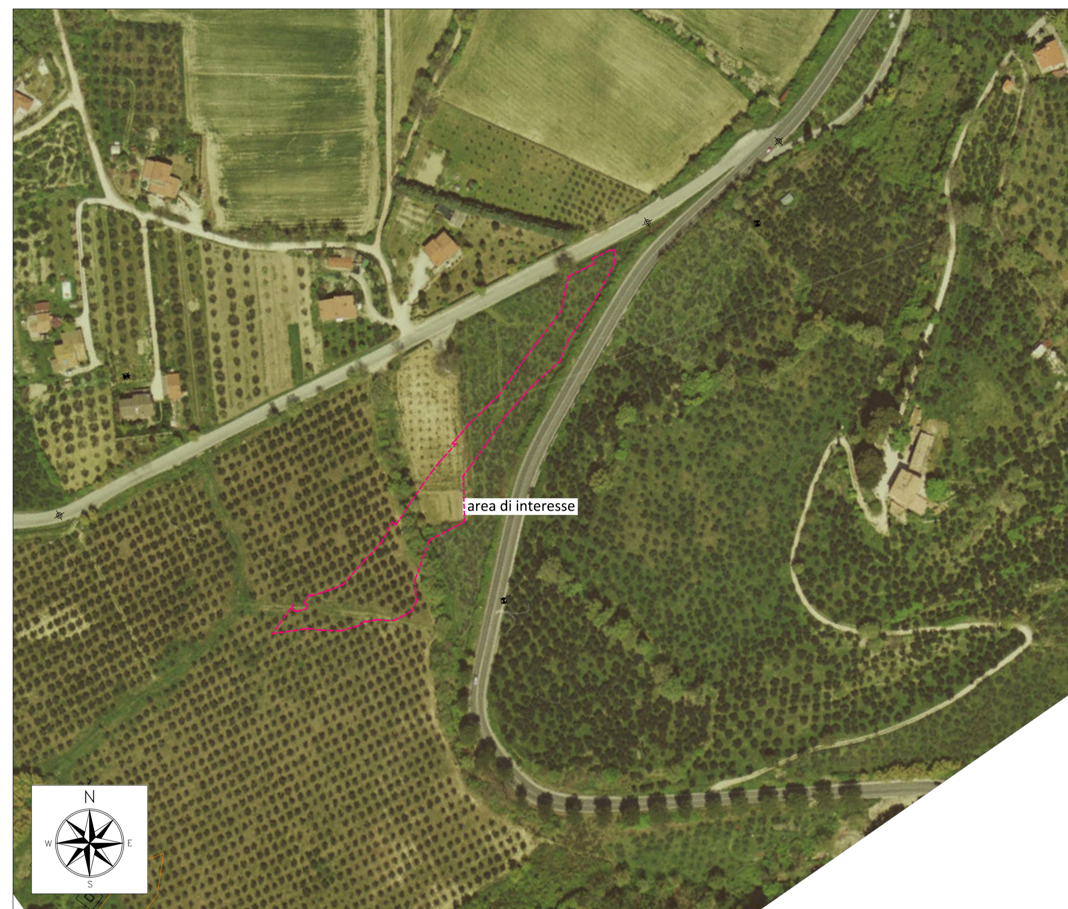
ORTOFOTO DI INQUADRAMENTO - SCALA 1:2000