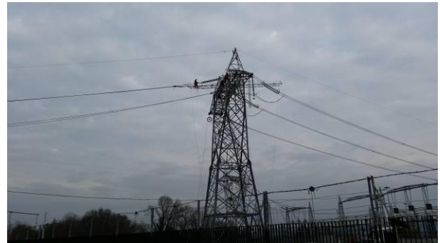
Sostegno n.189a all'interno della S.E. Redipuglia e calata dei conduttori al portale della S.E.