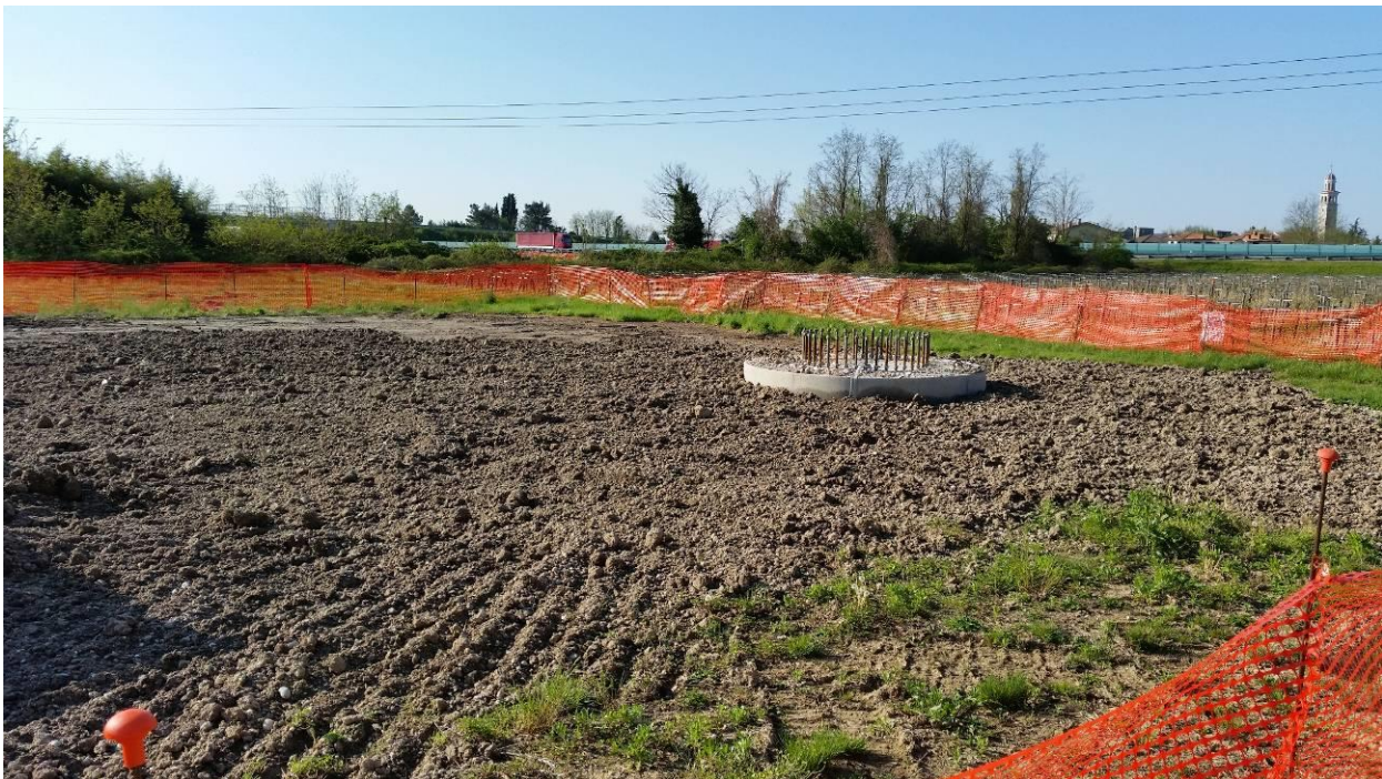
Area di micro cantiere del picchetto n.188a e fondazione del picchetto n.188a