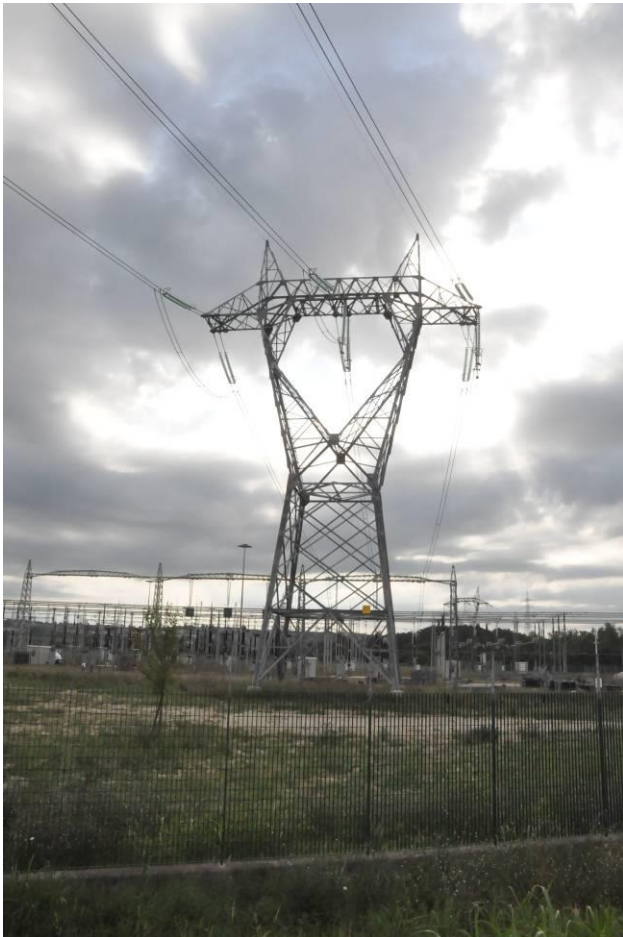
Sostegno n.189a all'interno della S.E. Redipuglia e calata dei conduttori al portale della S.E.