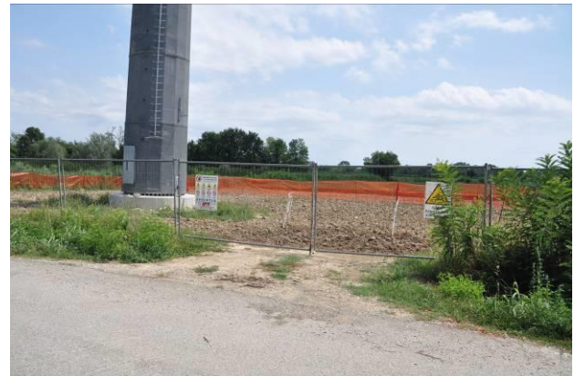
Ingresso al micro cantiere del sostegno n.43