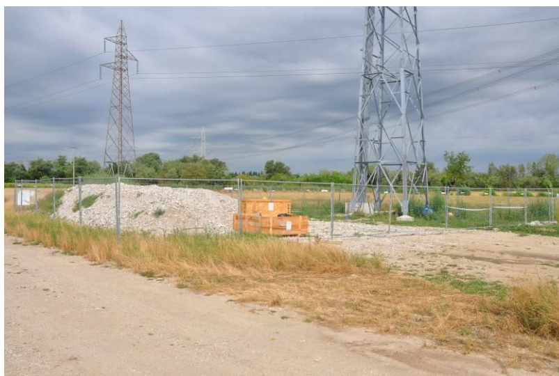
Area di micro cantiere del sostegno n.11a e materiale stoccato all'interno dell'area di micro cantiere