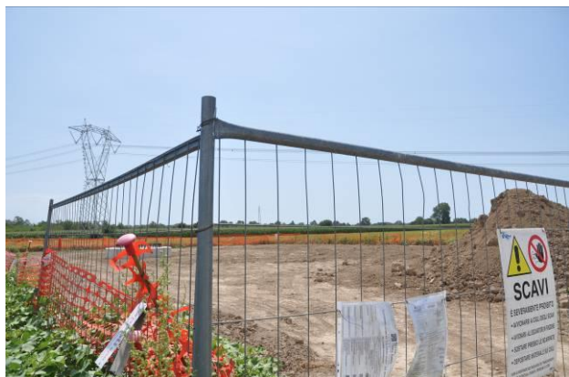
Area di micro cantiere del sostegno n.52