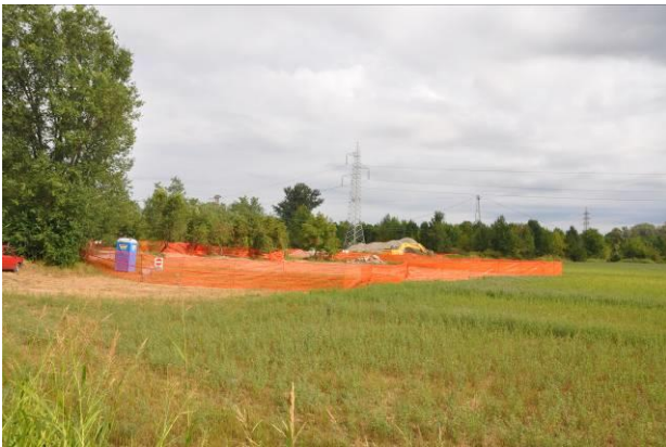
Area di micro cantiere del picchetto n.57