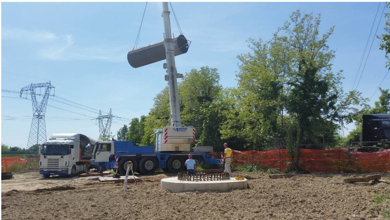
Area di micro cantiere del picchetto n.58 e fondazione del picchetto n.58