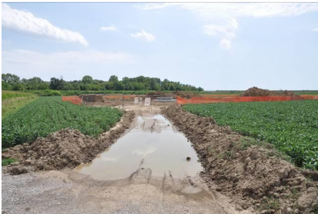
Pista di accesso al picchetto n.44