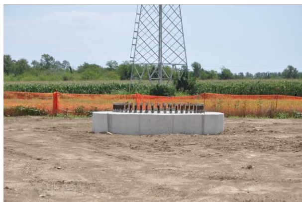
Fondazione del sostegno n.52