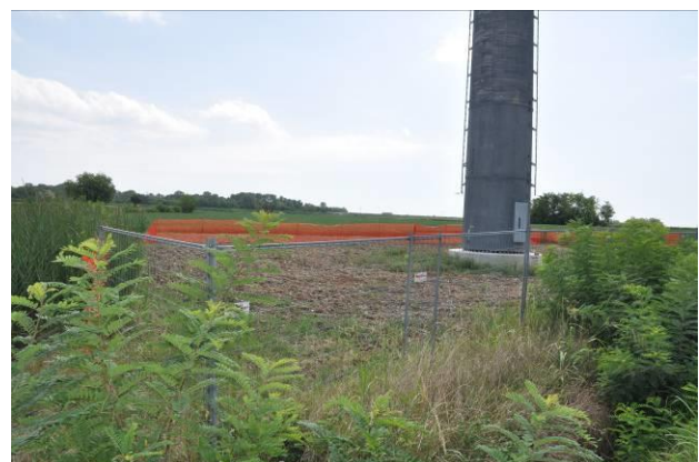
Area di micro cantiere del sostegno n.43