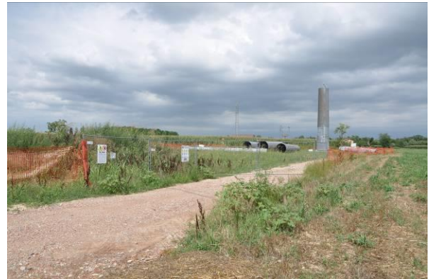
Pista di accesso al sostegno n.51