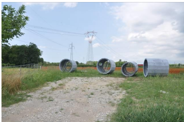
Conci all'interno dell'area di micro cantiere del picchetto n.50