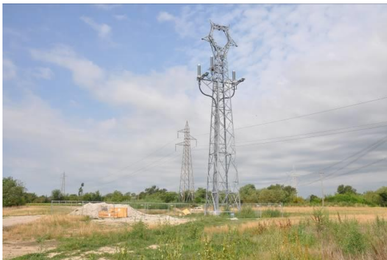
Area di micro cantiere del sostegno n.11a e sostegno n.11a con cavi terminali già montati