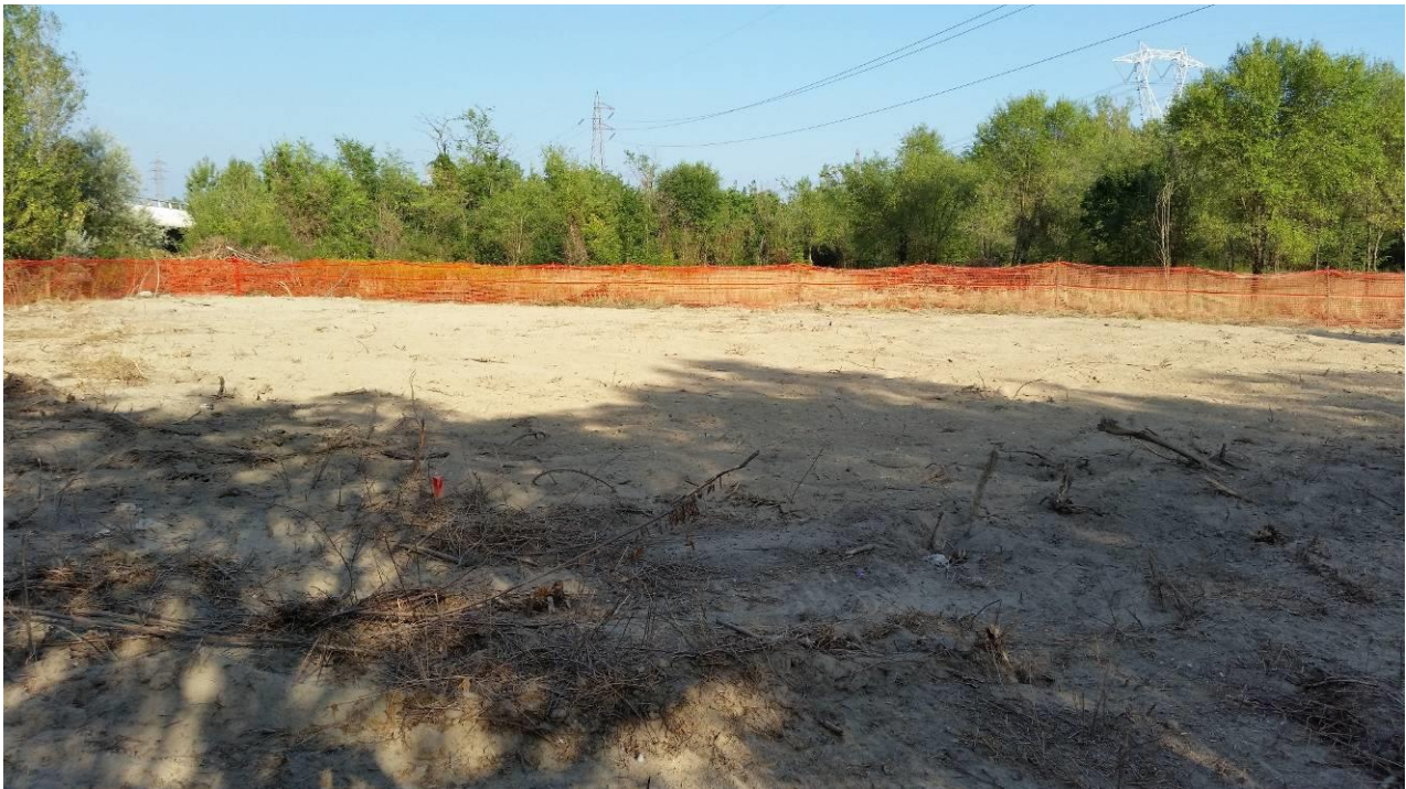
Area di micro cantiere del picchetto n.56