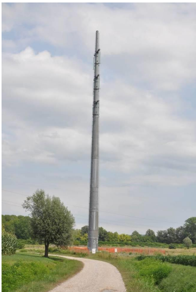
Sostegno n.40 e pista di accesso al sostegno