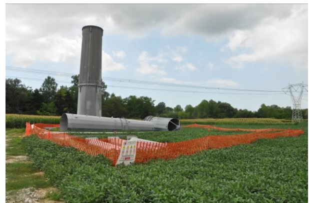
Area di micro cantiere del sostegno n.49