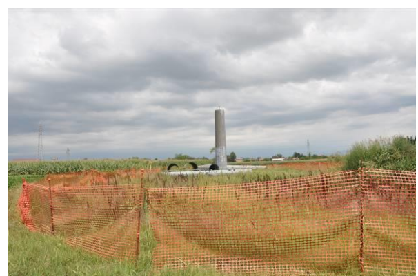
Area di micro cantiere del sostegno n.51