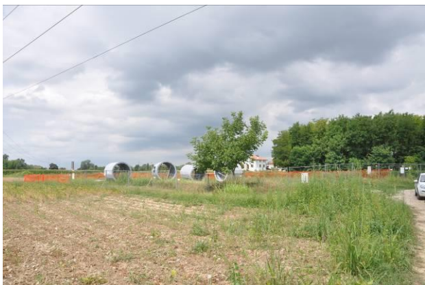
Area di micro cantiere del picchetto n.50