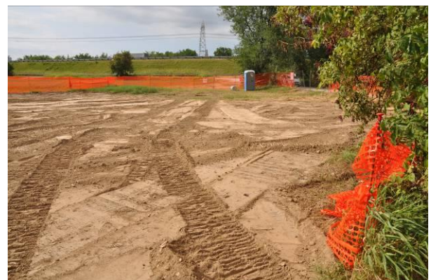
Area di micro cantiere del picchetto n.57