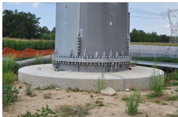
Fondazione del sostegno n.49