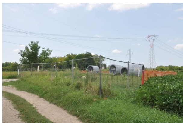
Pista di accesso al picchetto n.50