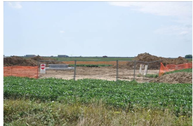
Area di micro cantiere del picchetto n.44