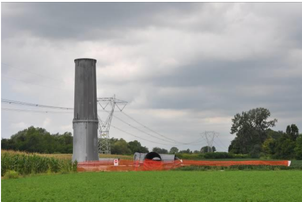
Area di micro cantiere del sostegno n.49