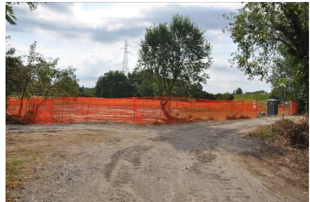
Pista di accesso al picchetto n.57