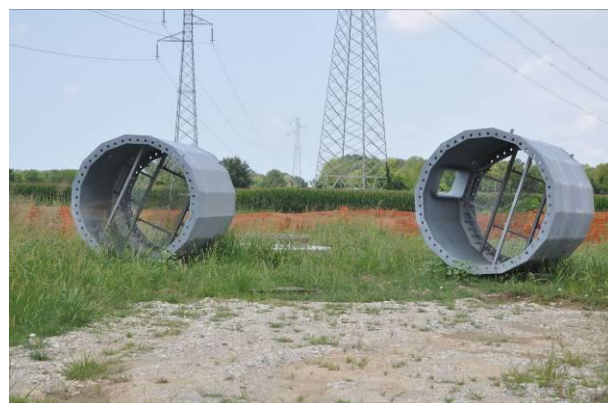
Conci all'interno dell'area di micro cantiere del picchetto n.50