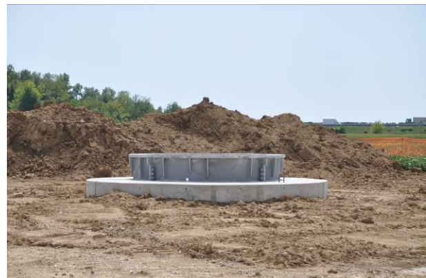
Fondazione del picchetto n.44