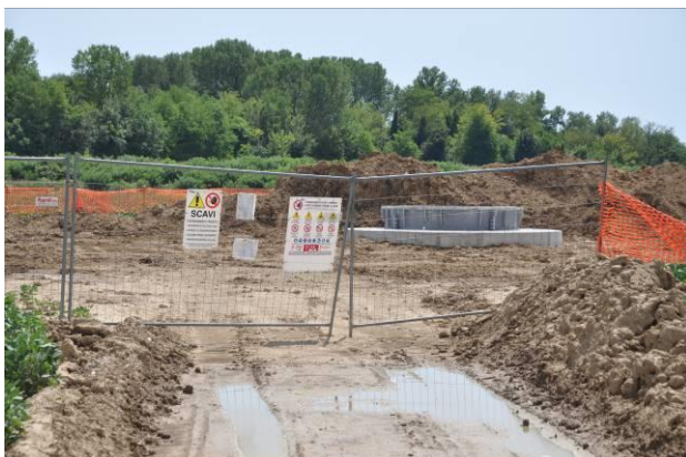
Ingresso al micro cantiere del picchetto n.44