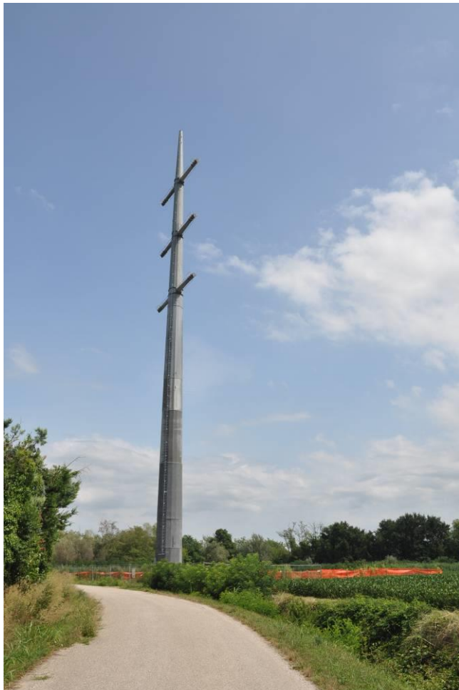
Sostegno n.43 e pista di accesso al sostegno