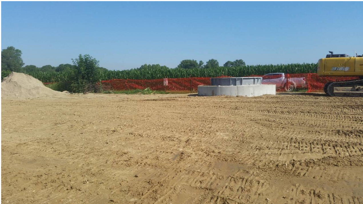
Area di micro cantiere del picchetto n.48 e fondazione del picchetto n.48