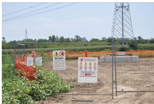
Accesso al micro cantiere del sostegno n.52