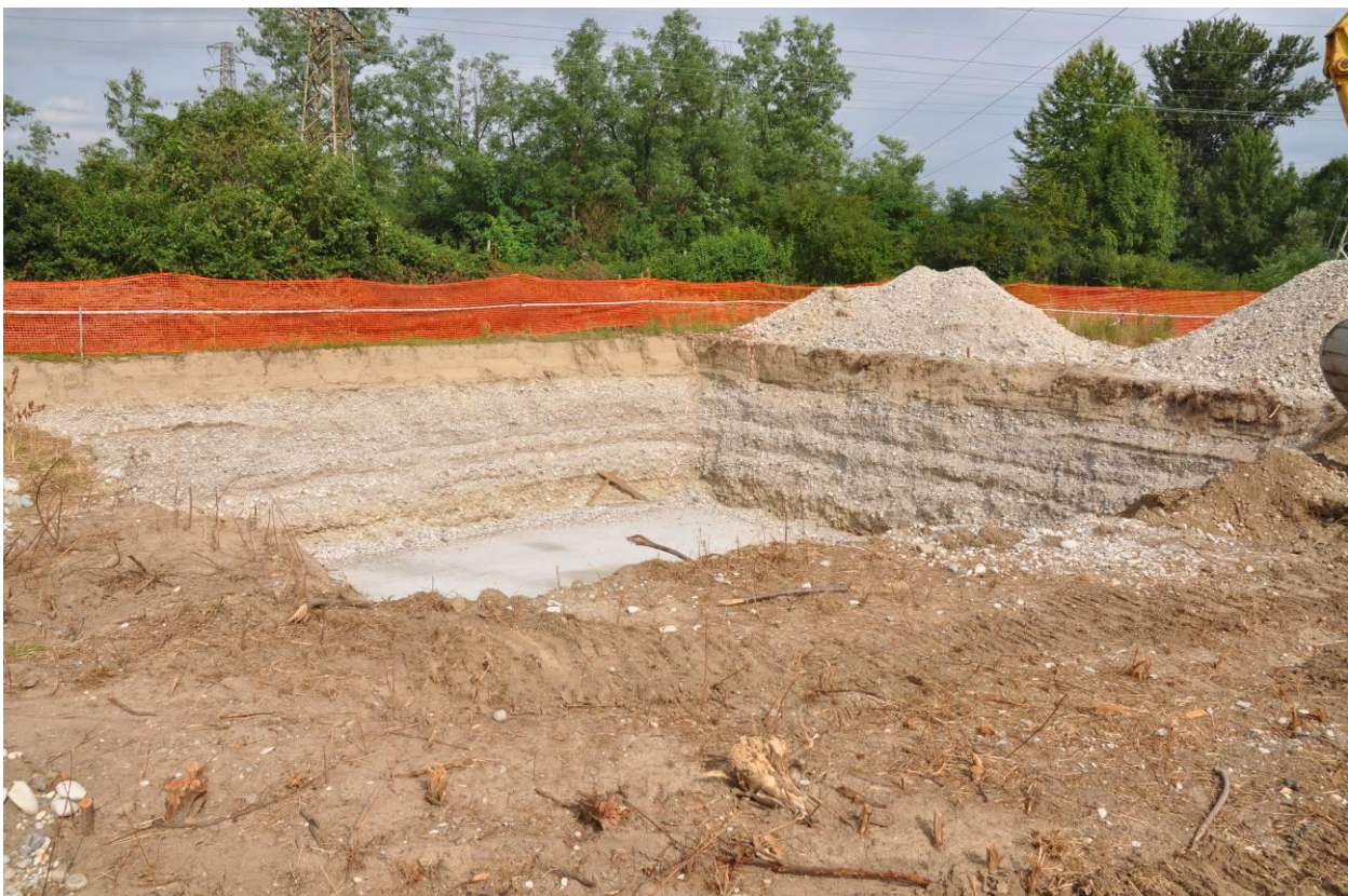
Area di micro cantiere del picchetto n.187a – scavo della fondazione