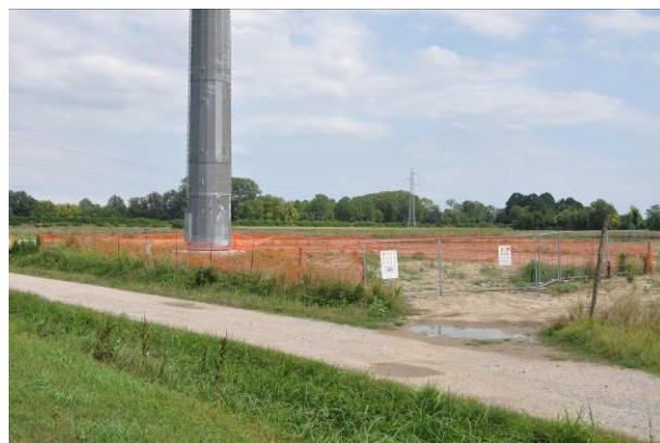
Area di micro cantiere del sostegno n.40