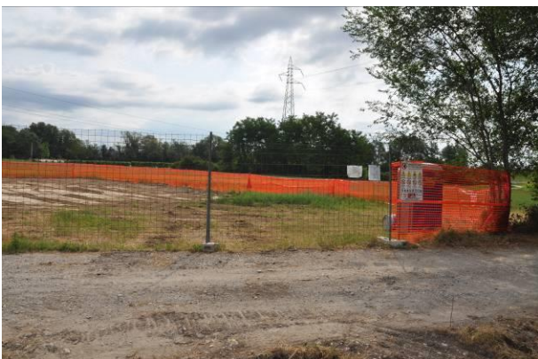
Pista di accesso al picchetto n.57