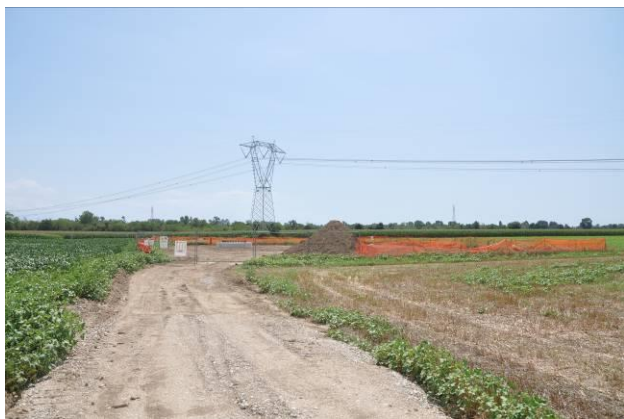
Pista di accesso al sostegno n.52