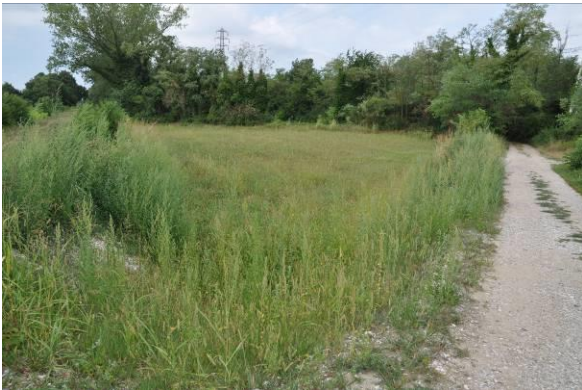
TOC da 1178,27 a 1000