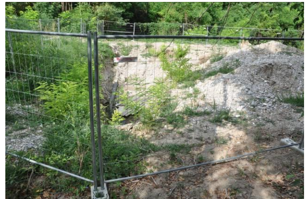
Area di micro cantiere della BG n.2