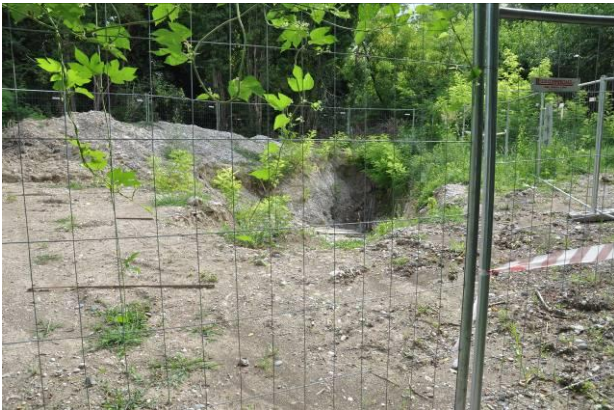
Area di micro cantiere della BG n.2