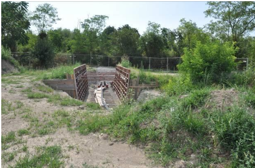
BG n.1 con la presenza dei cavi della tratta 1, dal sostegno n.11a, e i cavi della prima parte della TOC della tratta 2