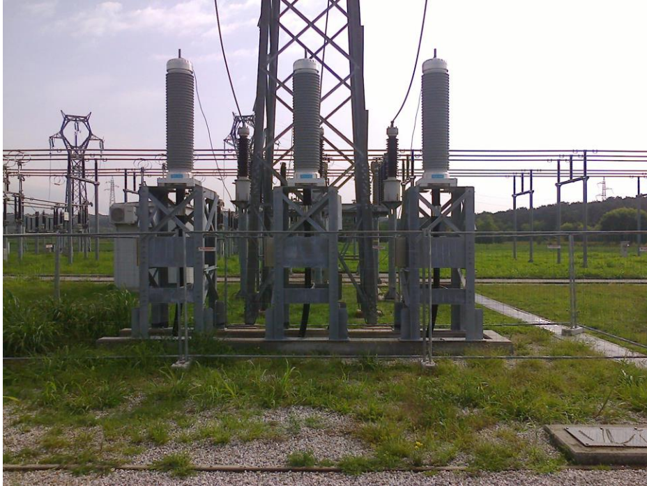
Attestazione cavi terminali