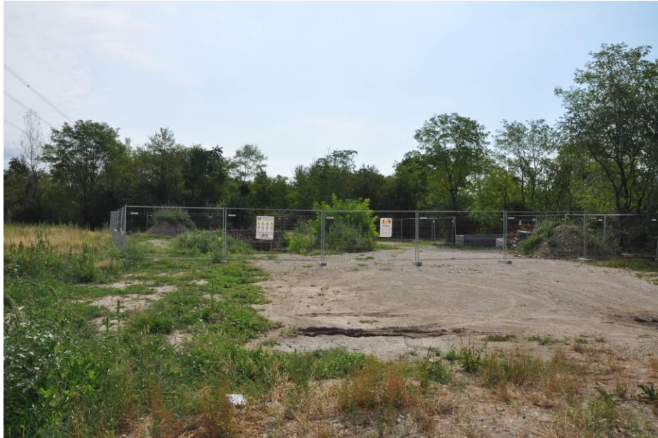
Area di micro cantiere rimanente dopo il rinterro della trincea per la posa del cavo dalla BG 1 al sostegno n.11a