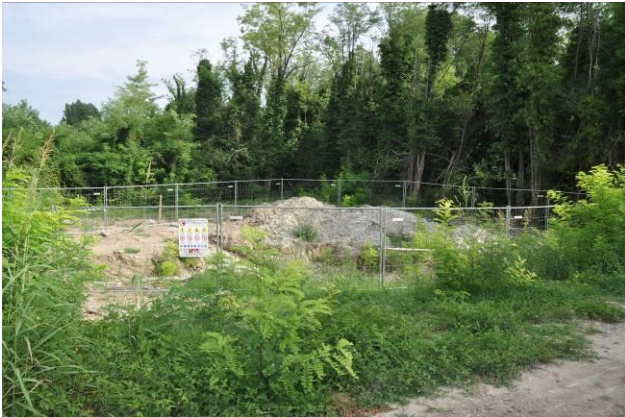
Area di micro cantiere della BG n.2