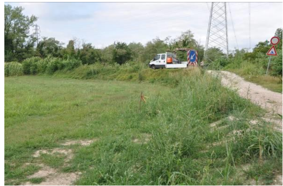
TOC da 1200 a 1000