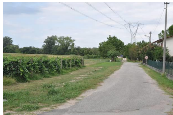
Scavo da 1372 a 1200