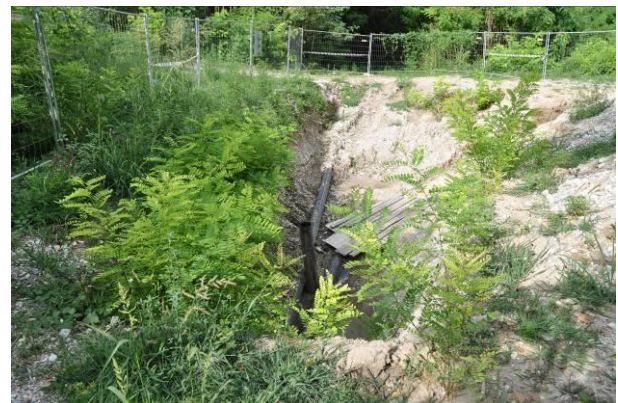
Scavo preliminare della BG n.2 con la presenza dei cavi della tratta 2