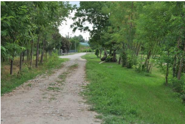
Scavo da 1200 a 1372