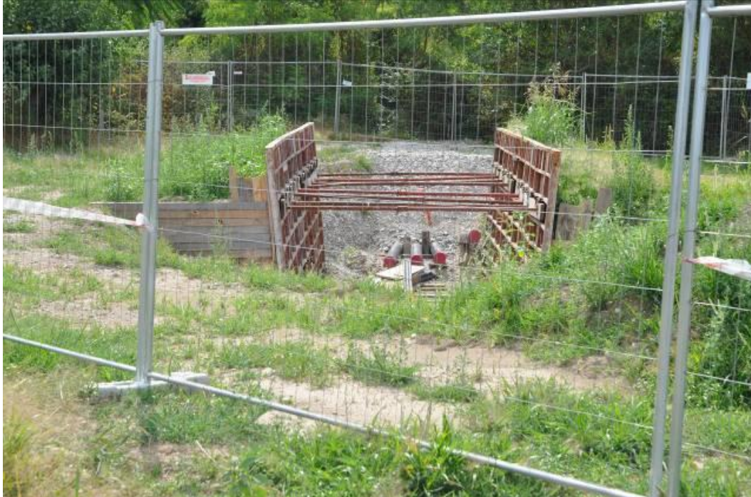
Area di micro cantiere della BG n.1