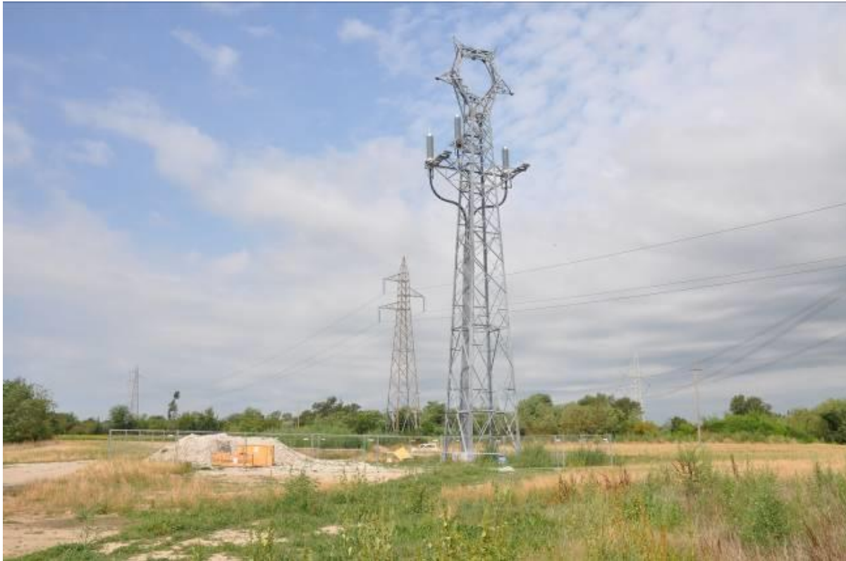
Attestazione dei cavi terminali sul sostegno n.11a e area di micro cantiere del sostegno n.11a.