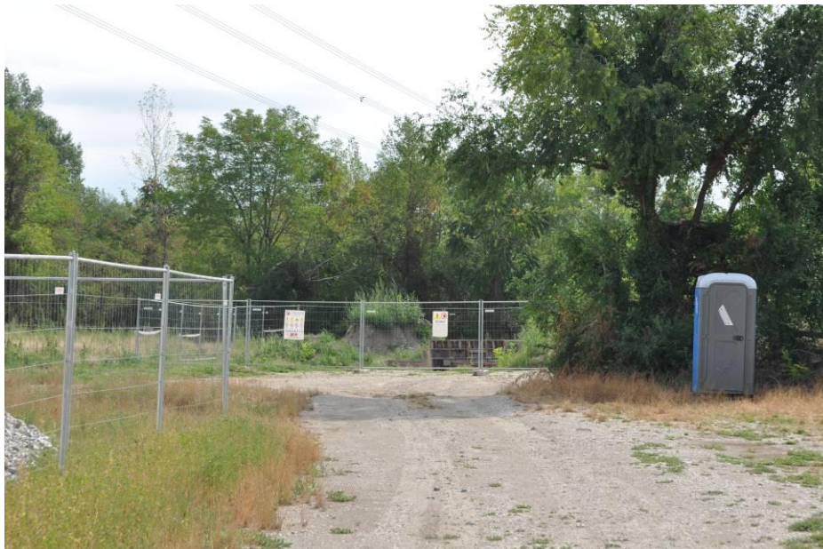
Pista di accesso all'area di micro cantiere rimanente dopo il rinterro della trincea per la posa del cavo dalla BG 1 al sostegno n.11a