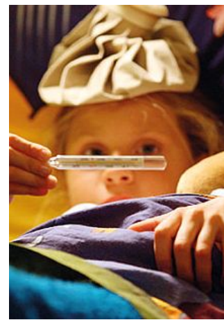
Una bambina misura la febbre

di stasi dell'epidemia. Per gli adulti i valori sono inferiori agli anni precedenti. A inizio febbraio il numero di casi si è avvicinato alla soglia epidemica (che per gli adulti è di 38 casi su 10 mila) senza però raggiungerla, e la scorsa settimana si è avuto un lievissimo calo, con 33 casi ogni 10 mila persone in Veneto. (s.b.)