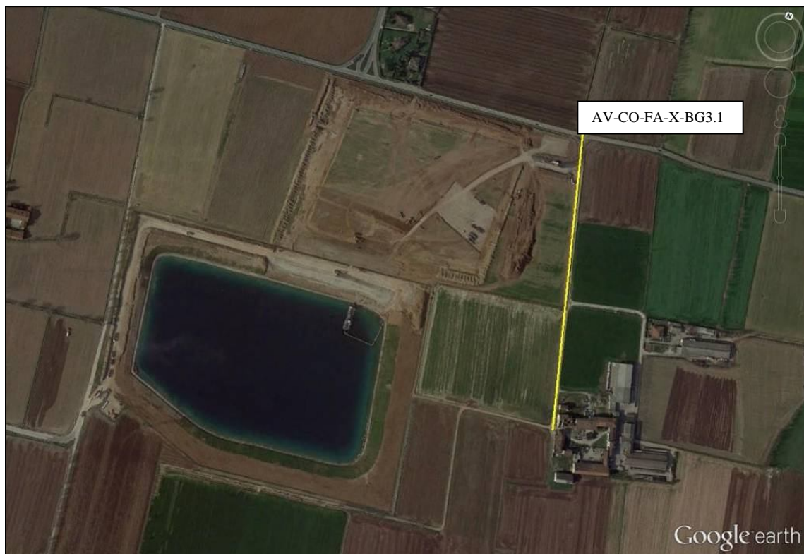
Figura 1 –Localizzazione del transetto di monitoraggio AV-CO-FA-X-BG3.1 (in giallo) presso la Cava di Covo

La localizzazione del transetto AV-CO-FA-X-BG3.1 nella stazione di monitoraggio è riportata in Figura 1.