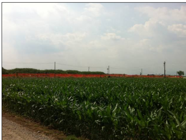
Figura 2 –Panoramiche del transetto di monitoraggio AV-CO-FA-X-BG3.1 presso la Cava di Covo