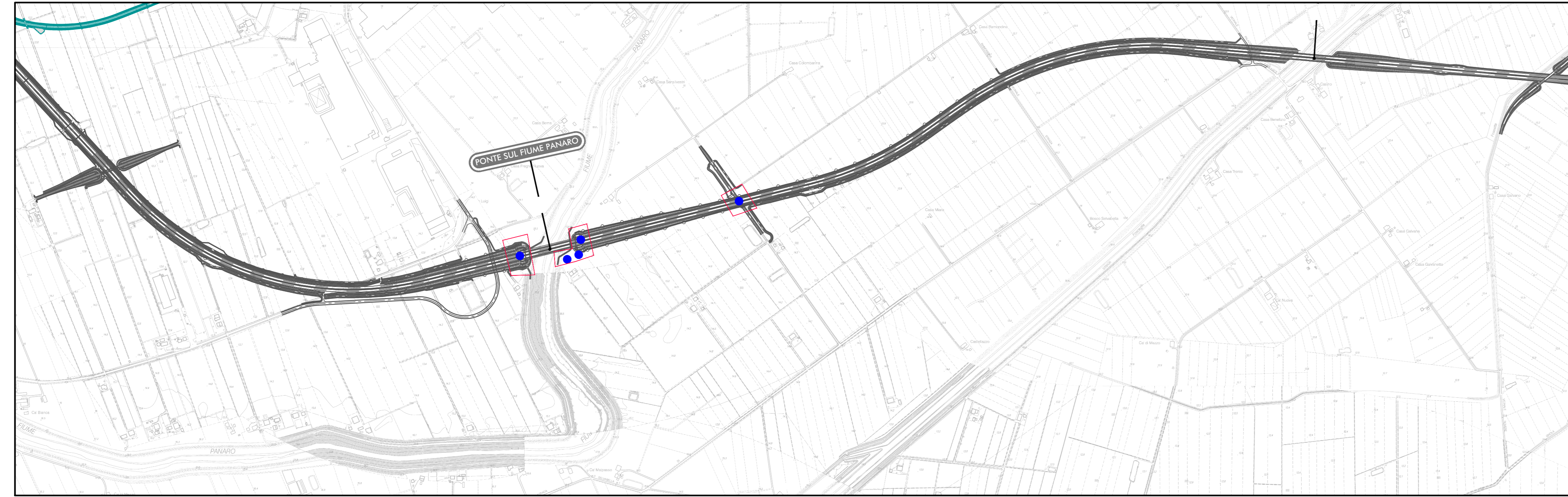
Posizionamento generale delle aree in cui si propongono indagini preliminari, su CTR - scala 1:10.000