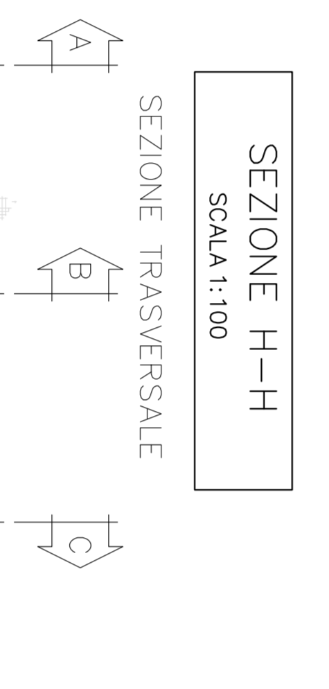
SEZIONE H-H SCALA 1:100