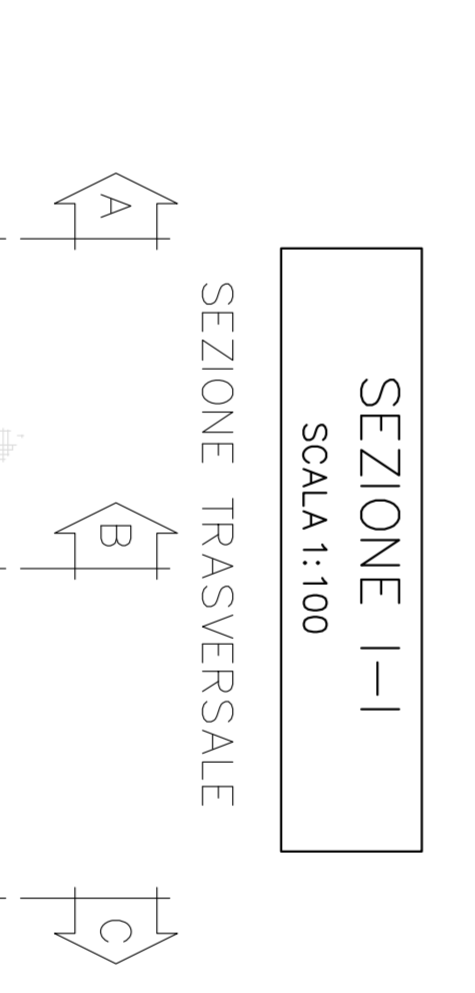
SEZIONE I-I SCALA 1:100