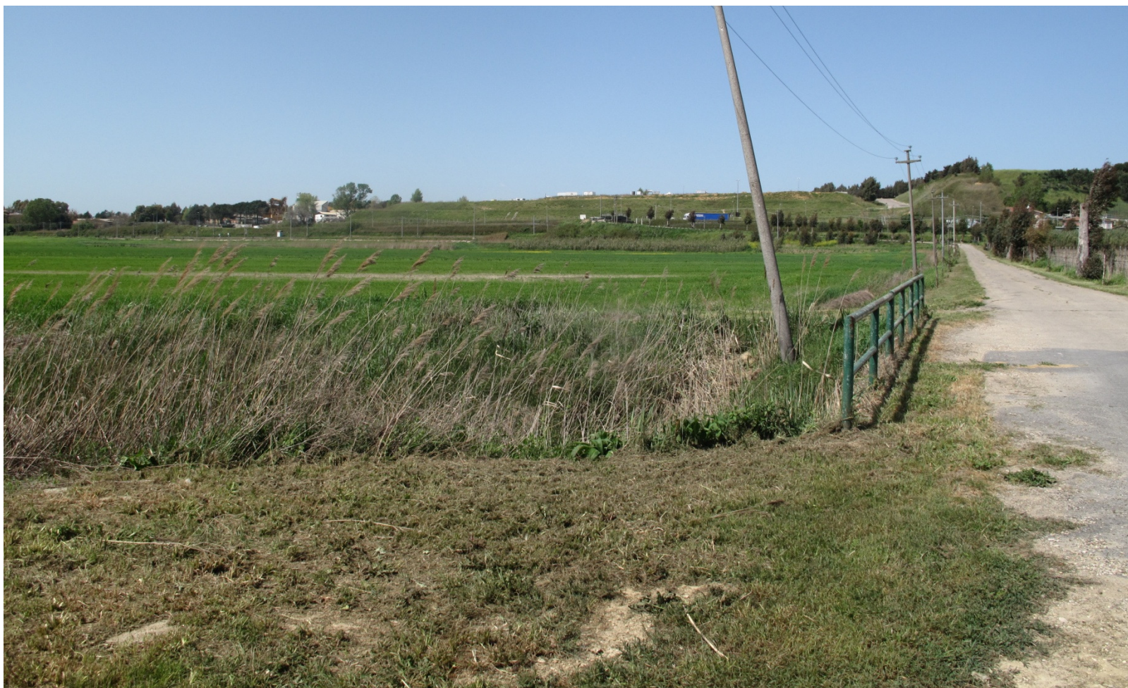
Foto 4 – Vista dalla strada al limite est del Sito in direzione ferrovia