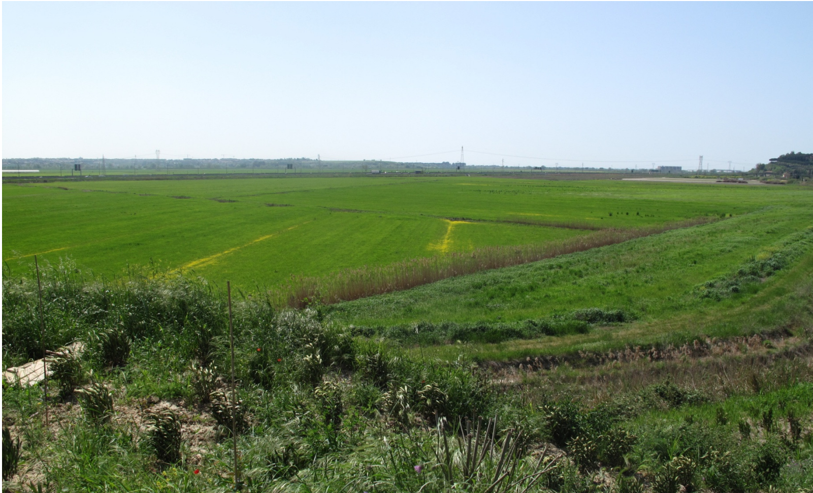
Foto 1- Vista di insieme dell'area dal ponte di accesso sulla ferrovia