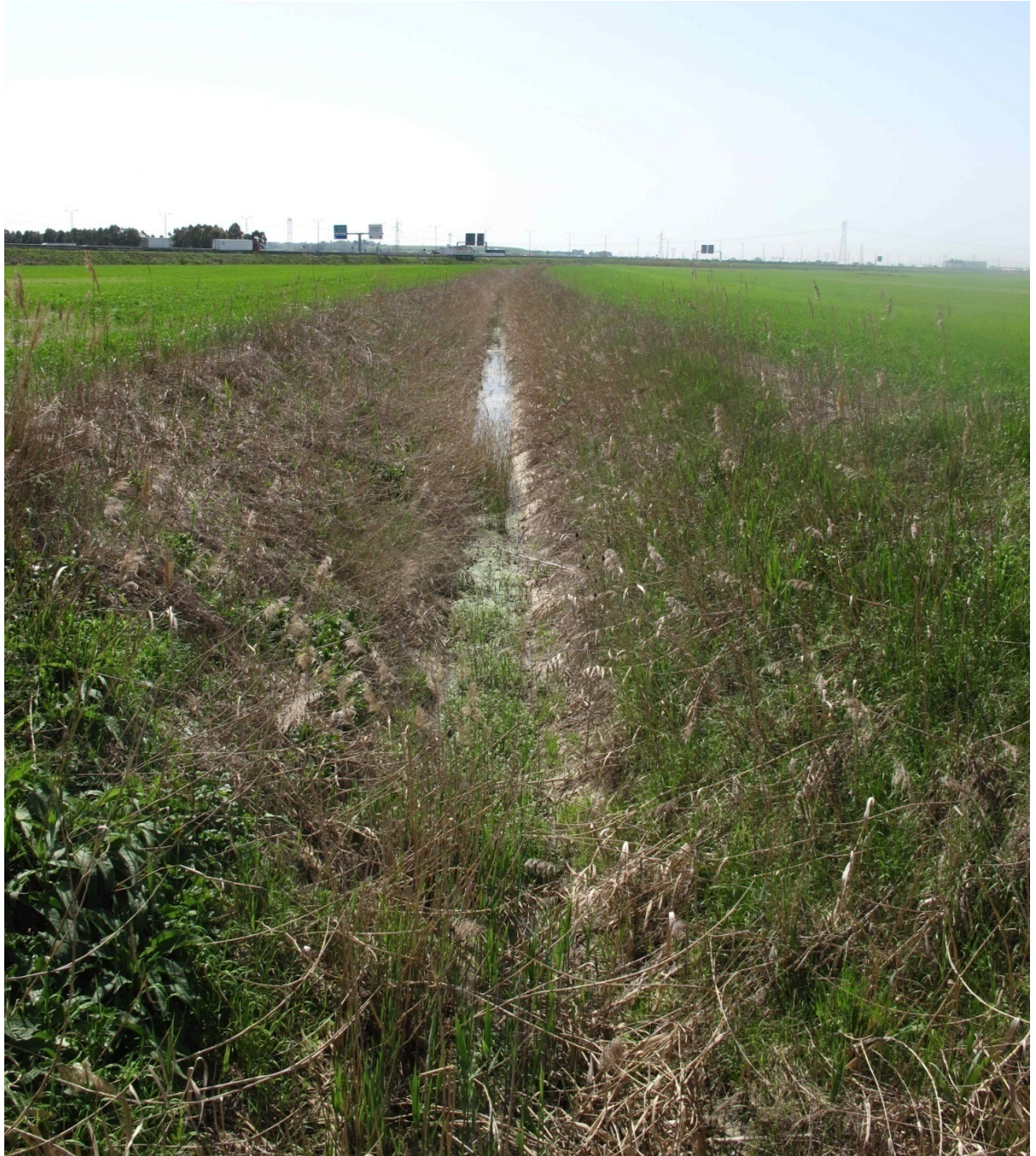
Foto 6 Canale di scolo che corre trasversale attraverso il limite sud del Sito