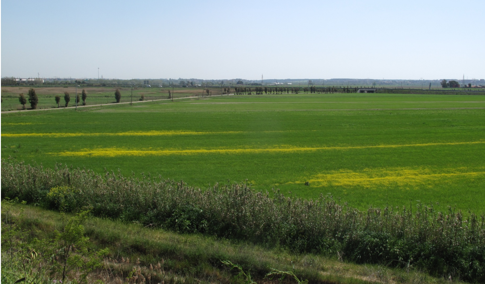
Foto 3- Vista del limite est dell'area del Sito in direzione dell'autostrada