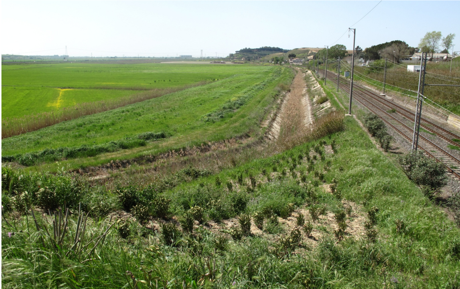
Foto 2- Canale posto tra la ferrovia e l'area di interesse