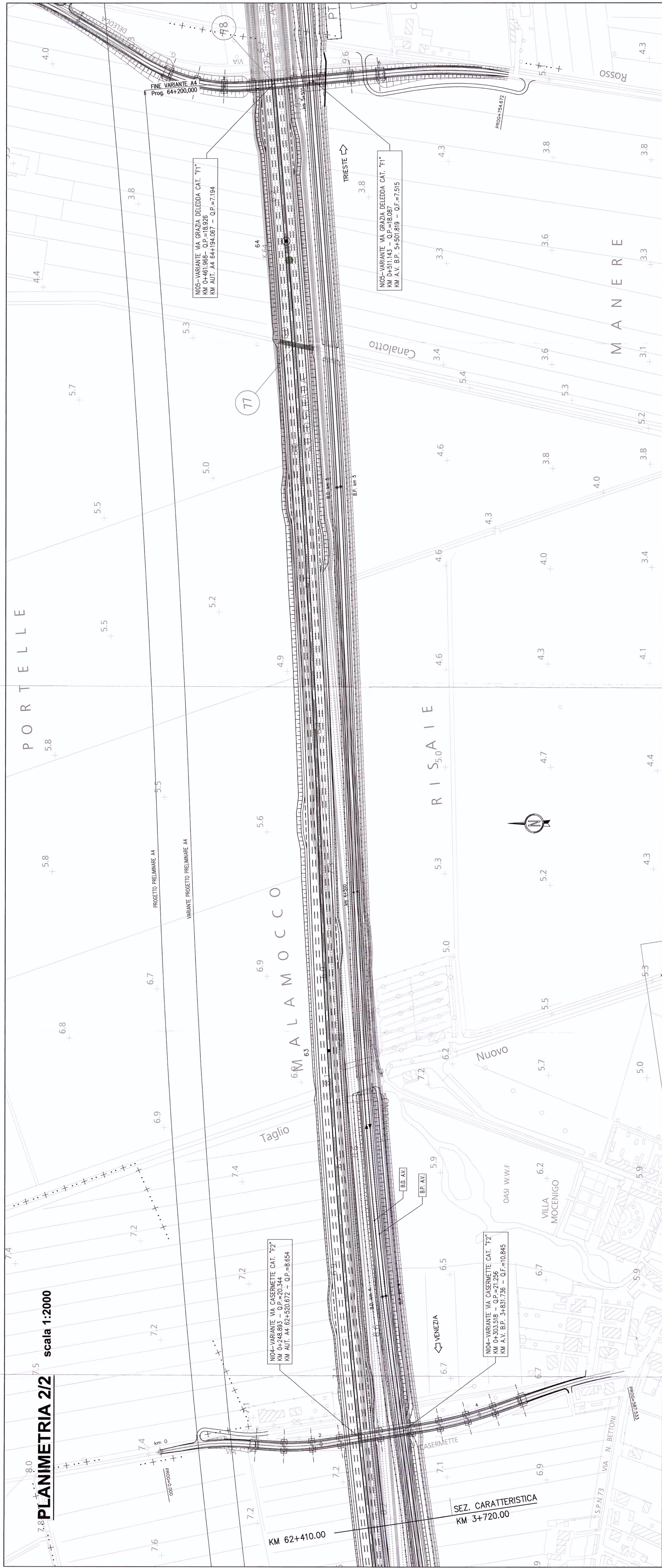
PLANIMETRIA 2/2 scala 1:2000